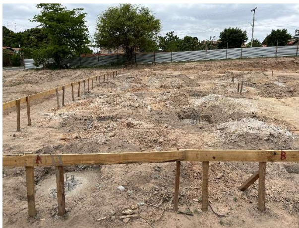
Fig. 3 – Locação da edificação principal