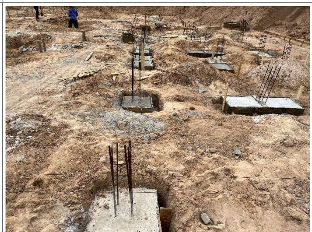
Fig. 8 – Concretagem de blocos de coroamento