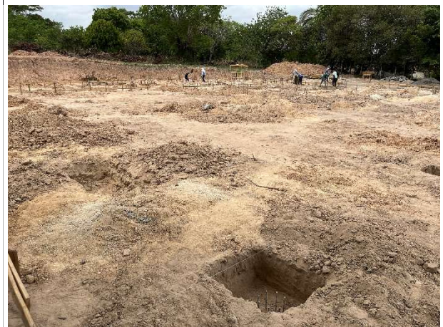
Fig. 4 – Escavações/regularização do terreno