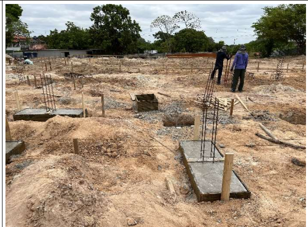
Fig. 12 – Infraestrutura (fundações da edificação)