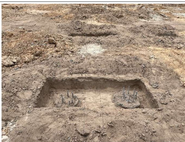
Fig. 7 – Estacas concretadas (edificação principal)