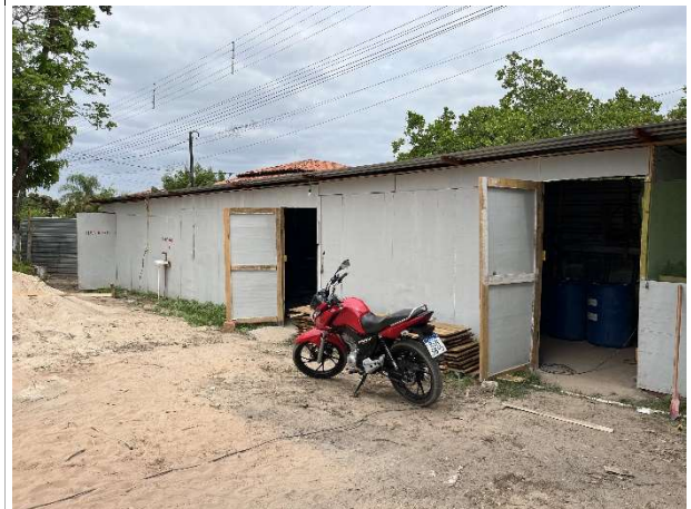
Fig. 10 – Estruturas de apoio do canteiro