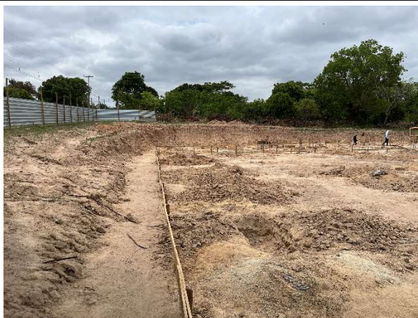
Fig. 11 – Locação da obra/regularização do terreno