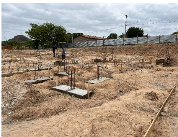
Fig. 5 – Infraestrutura (fundações da edificação)