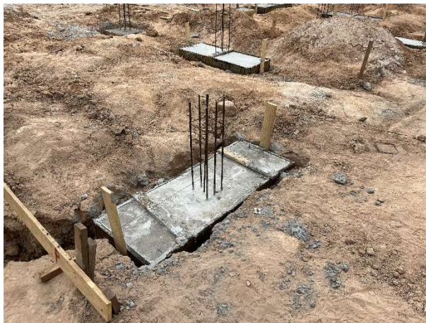
Fig. 9 – Concretagem de blocos de coroamento