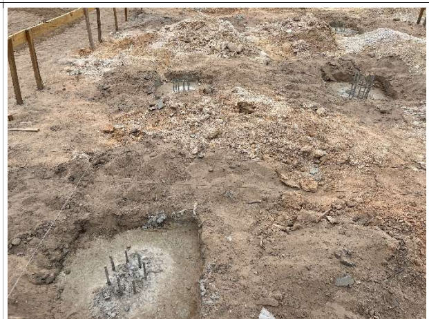
Fig. 6 – Concretagem de blocos de coroamento