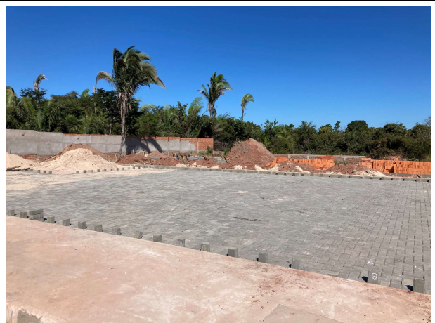
Fig. 4 – execução de pavimento intertravado