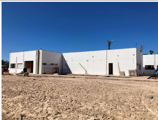
Fig. 3 – fachada lateral