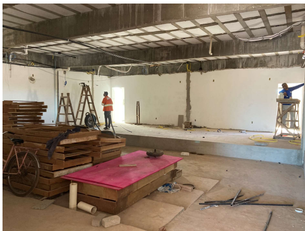
Fig. 9 – Tribunal do Júri