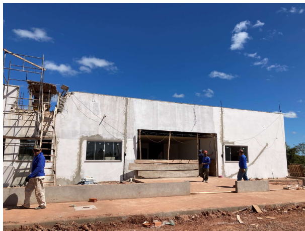
Fig. 1 – fachada frontal