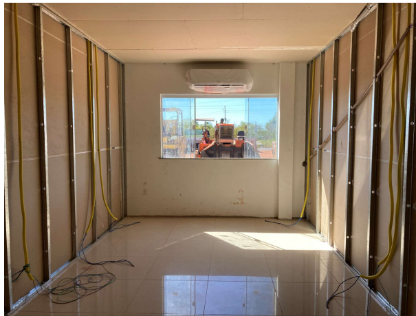
Fig. 7 – instalações elétricas e ar condicionado