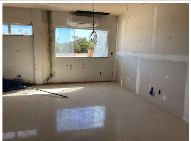
Fig. 6 – instalações elétricas e ar condicionado