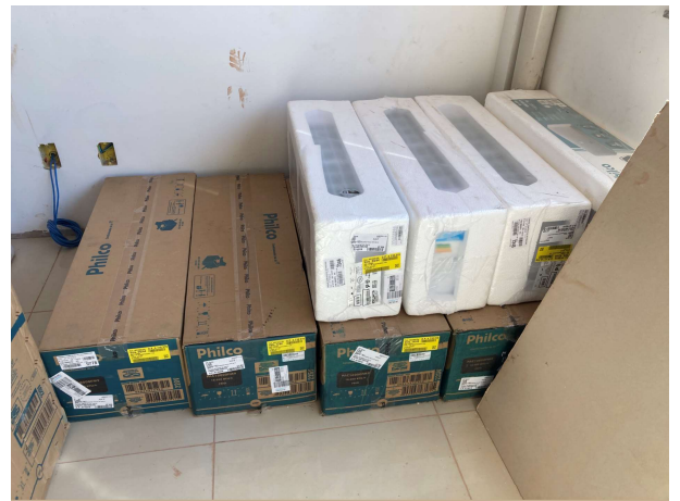
Fig. 14 – aparelhos de ar condicionado