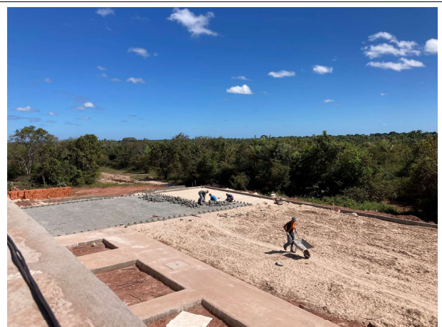
Fig. 12 – execução de pavimento intertravado