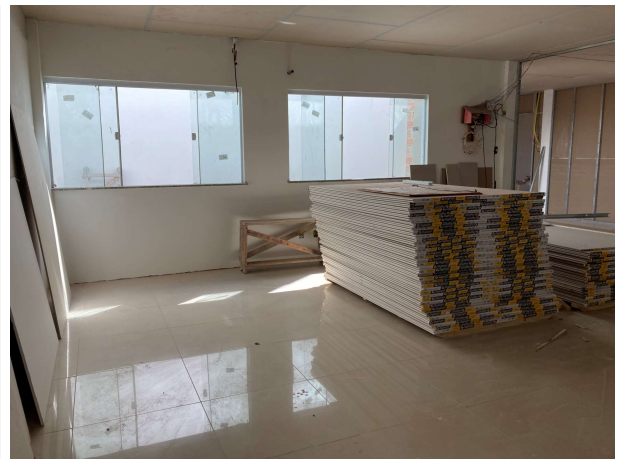
Fig. 8 –paredes de drywall