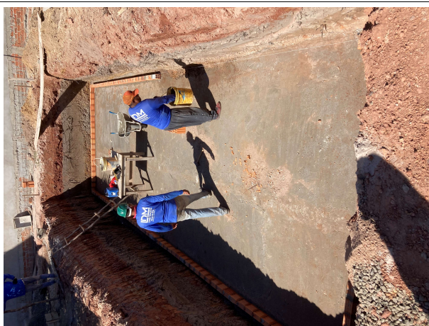
Fig. 11 – execução da cisterna