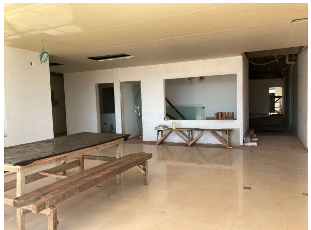
Fig. 2 – entrada do Fórum