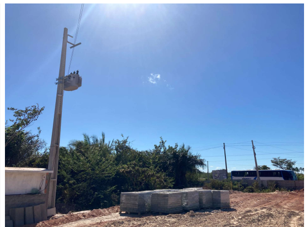
Fig. 10 – subestação aérea