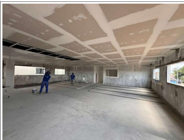
Fig. 11 – execução de forro