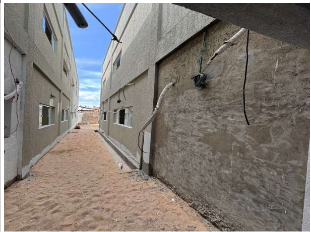
Fig. 8 – execução de instalações de climatização