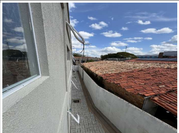
Fig. 10 – execução de piso intertravado