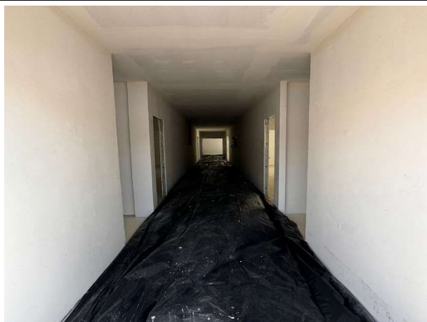
Fig. 3 – execução de piso, paredes, forro e pintura