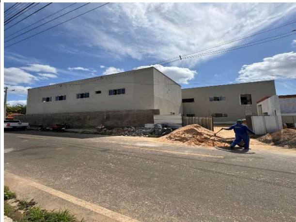
Fig. 2 – fachada lateral