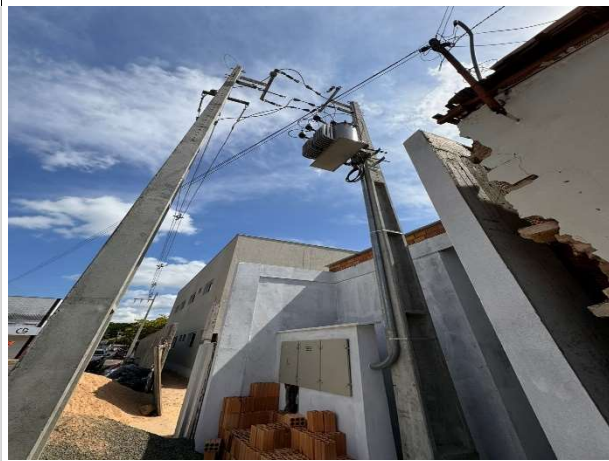
Fig. 7 – subestação aérea