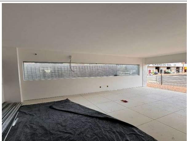
Fig. 5 – execução de piso, paredes, instalações e pintura