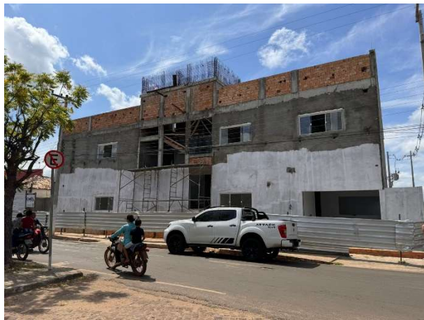
Fig. 1 – fachada frontal