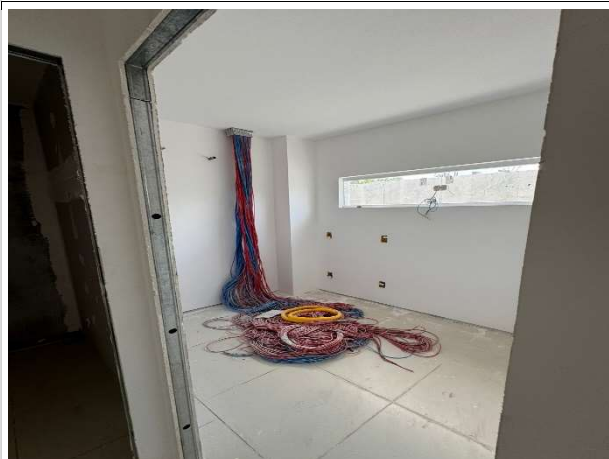
Fig. 9 – execução de instalações lógicas e pluviais