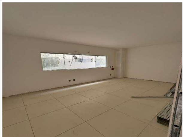
Fig. 4 – instalações de climatização, elétricas e lógicas