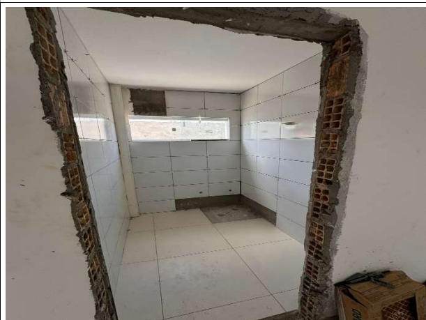
Fig. 6 – execução de revestimento e esquadrias