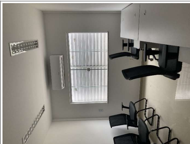
Fig. 13 – instalações elétricas, piso, pintura e esquadrias