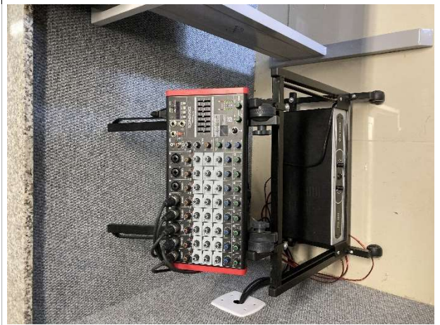
Fig. 10 – instalações de sonorização