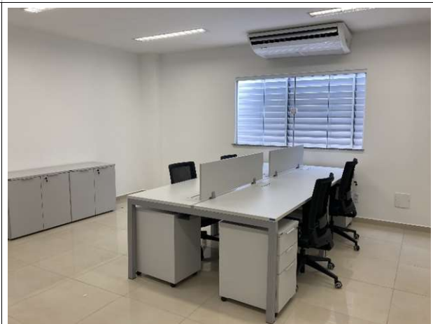
Fig. 8 – secretaria do JECR