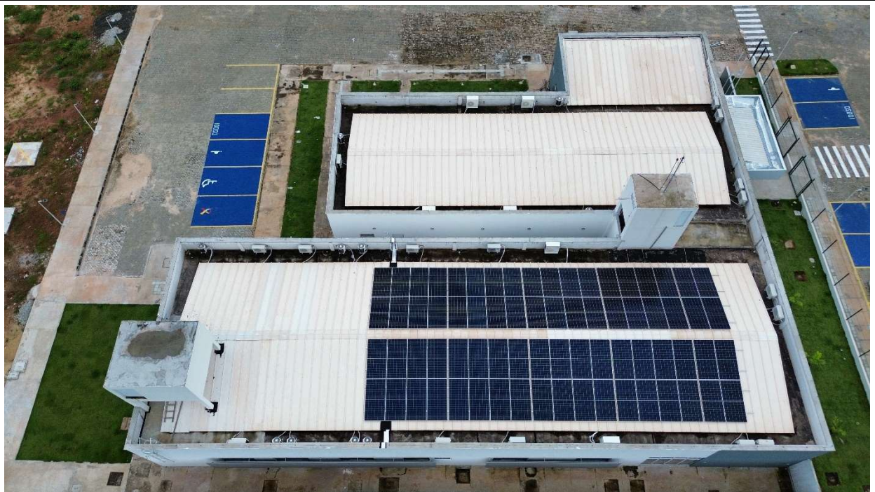
Fig. 2 – Vista aérea da obra