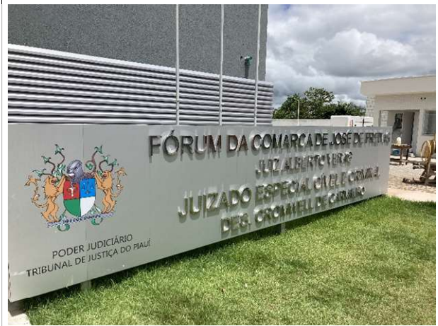
Fig. 4 – totem e letreiro em inox