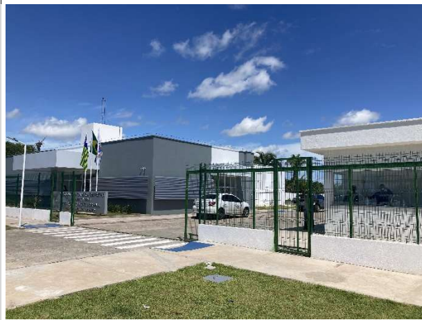
Fig. 3 – entrada do Fórum