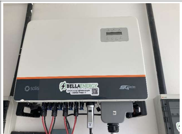
Fig. 14 – inversor do sistema fotovoltaico