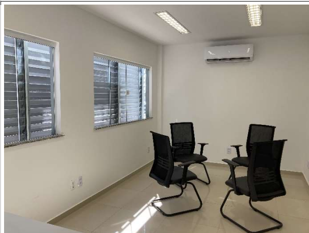
Fig. 5 – sala de apoio