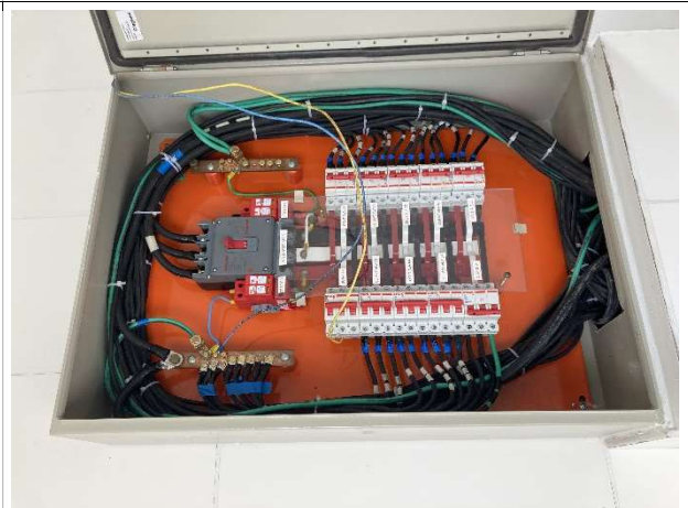
Fig. 12 – instalações elétricas