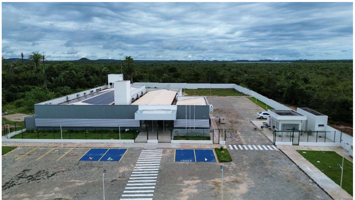
Fig. 1 – Vista aérea da obra