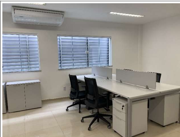
Fig. 7 – secretaria do Fórum