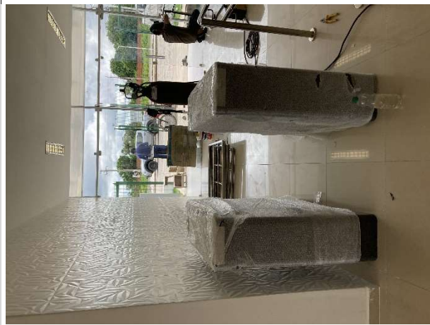
Fig. 9 – catracas de controle de acesso