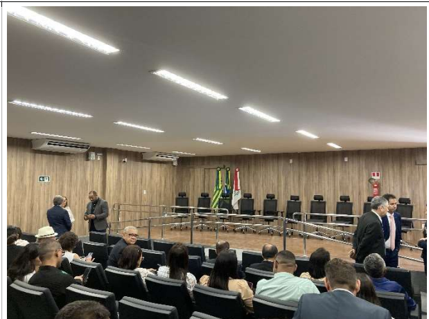
Fig. 6 – tribunal do júri