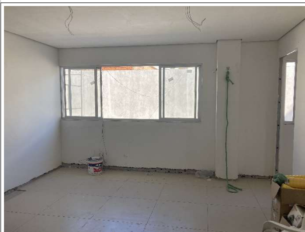
Fig. 7 – execução de piso cerâmico e esquadrias