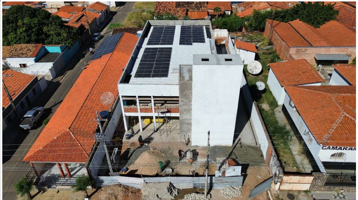
Fig. 1 – Vista aérea da obra