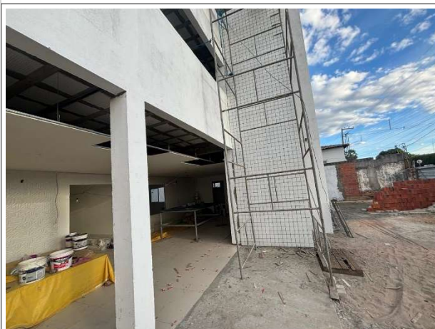
Fig. 13 – execução de pintura e revestimento cerâmico