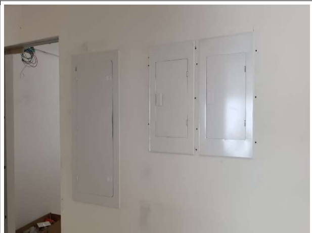
Fig. 12 – quadros de instalações elétricas