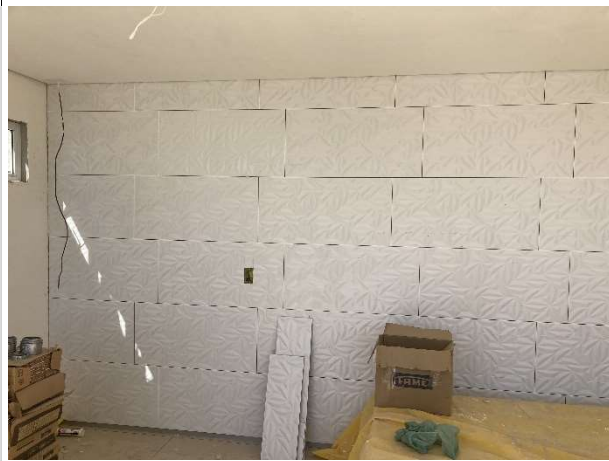
Fig. 3 – revestimento 3D