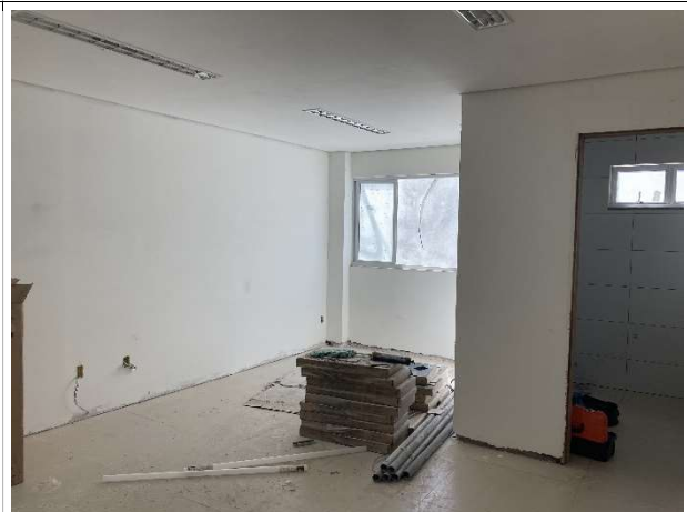
Fig. 6 – execução de instalações, piso e forro