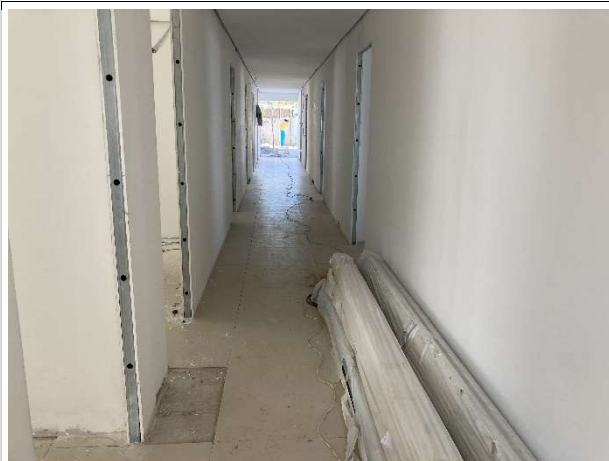
Fig. 5 – paredes de drywall e pintura