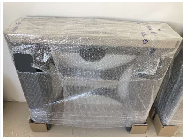
Fig. 10 – catracas eletrônicas (controle de acesso)