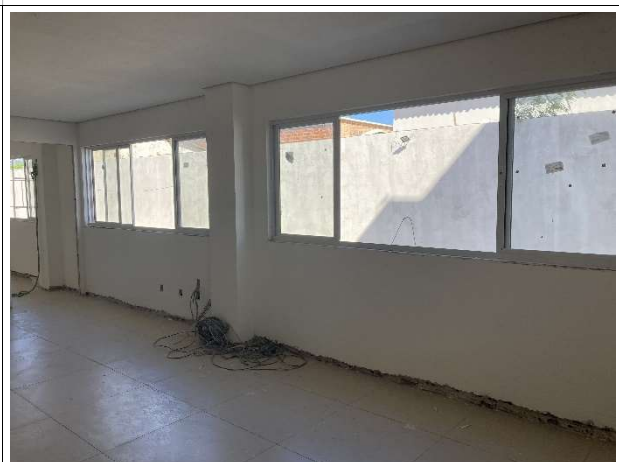
Fig. 8 – execução de instalações elétricas, esquadrias e forro