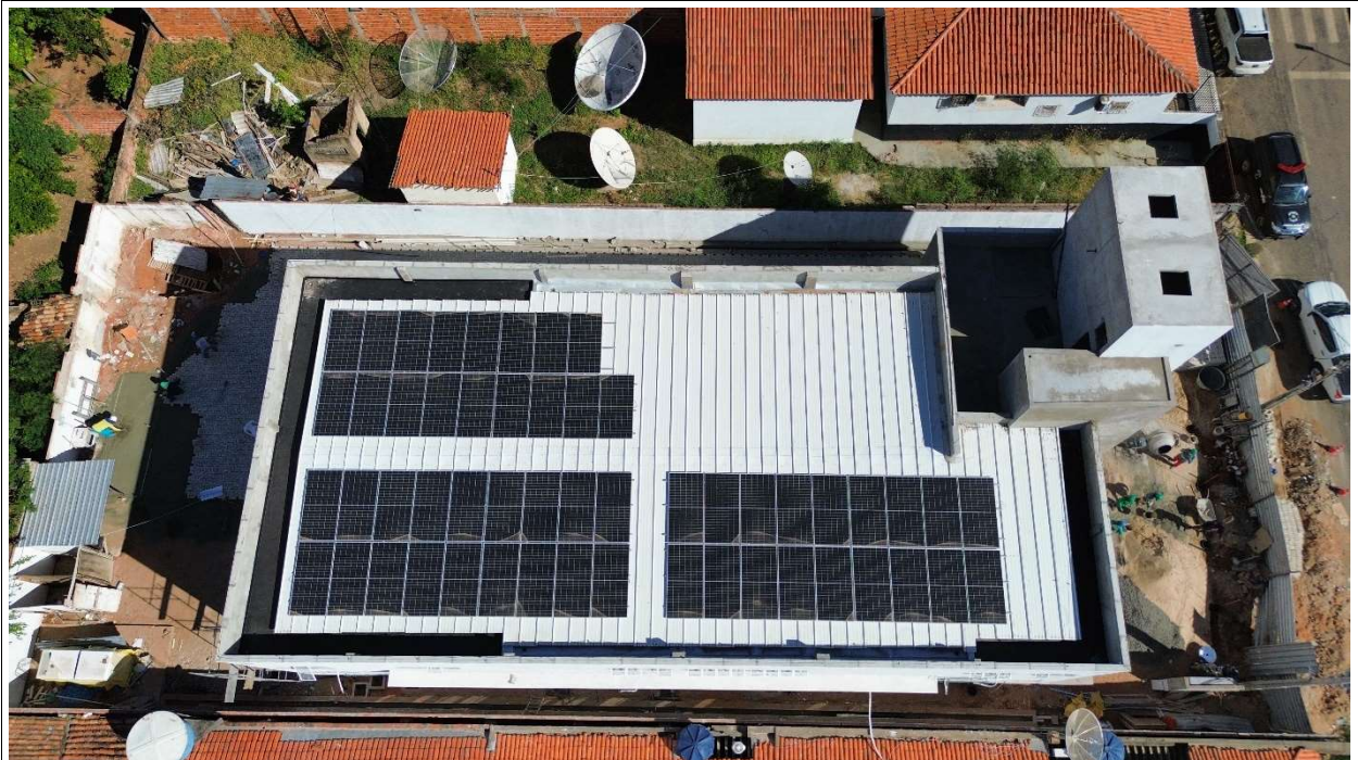
Fig. 2 – Vista aérea da obra