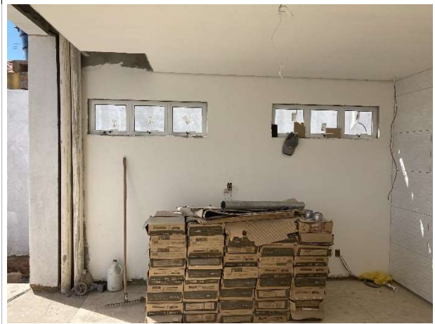
Fig. 4 – execução de pintura e instalações