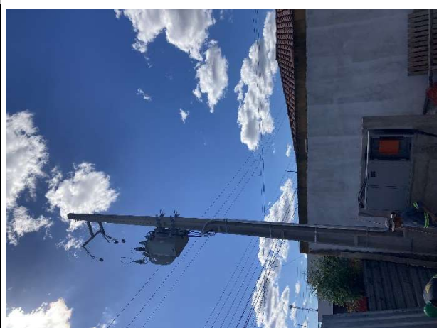
Fig. 14 – subestação aérea e entrada de medição