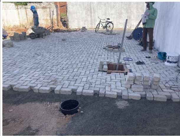
Fig. 9 – execução de piso intertravado