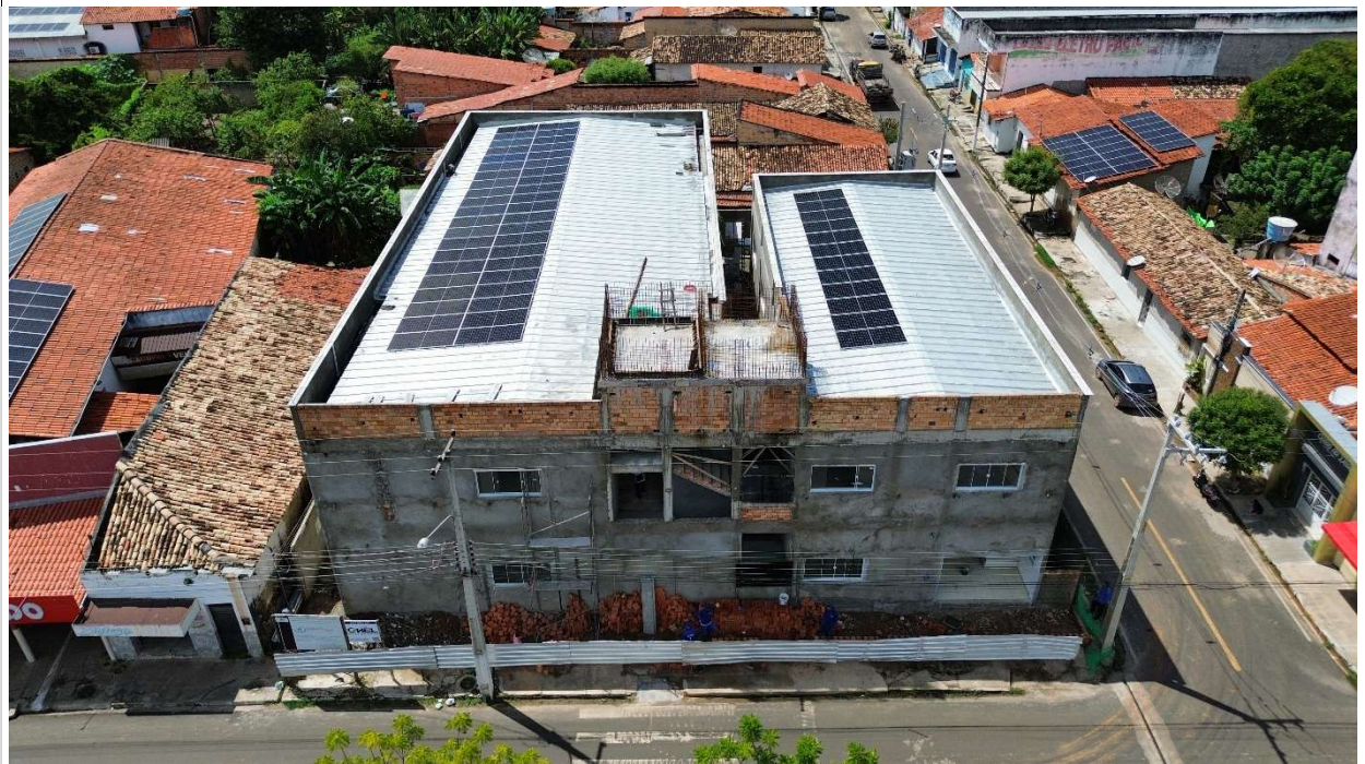
Fig. 1 – Vista aérea da obra