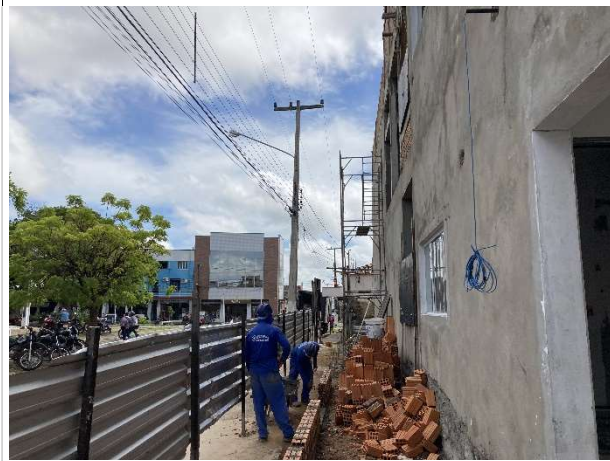
Fig. 3 – execução de mureta na fachada frontal