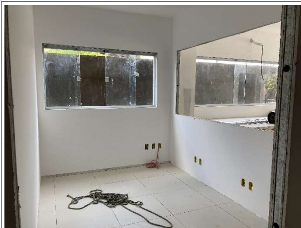
Fig. 7 – execução de piso, paredes, instalações e pintura