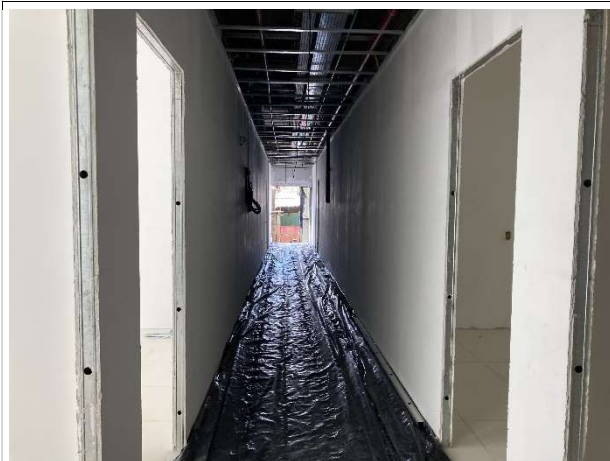
Fig. 5 – execução de piso, paredes e pintura