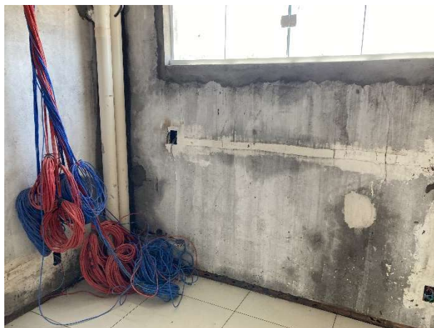
Fig. 11 – execução de instalações lógicas e pluviais