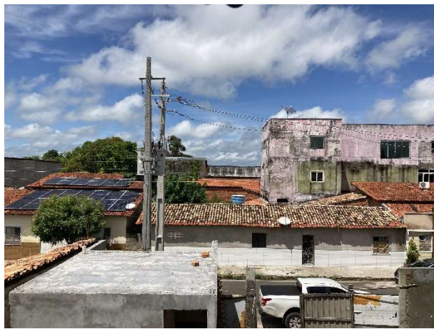
Fig. 9 – subestação aérea