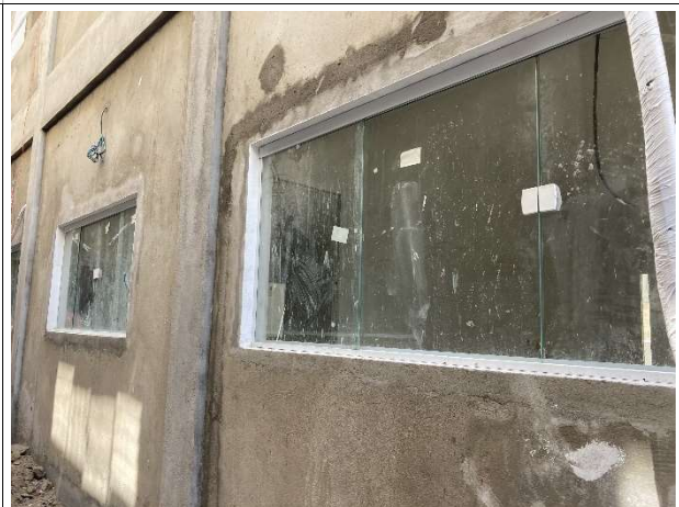
Fig. 8 – execução de revestimento e esquadrias