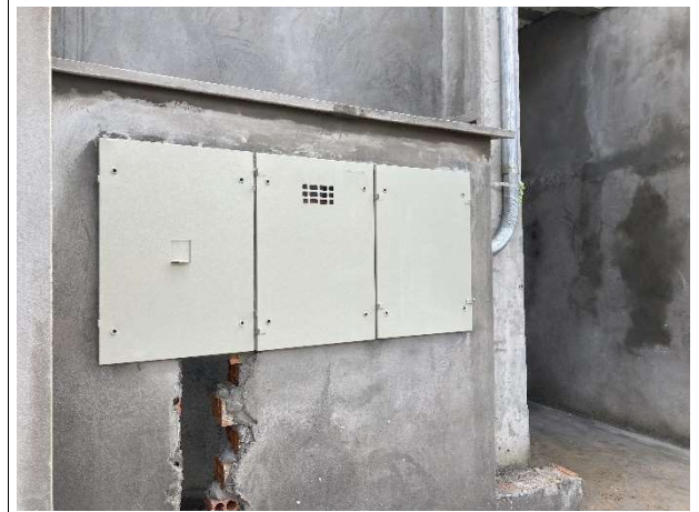
Fig. 16 – padrão de medição