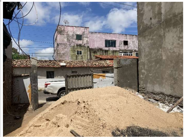
Fig. 4 – execução de movimentação de terra