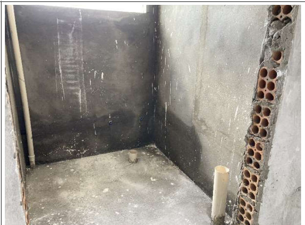
Fig. 14 – revestimentos e instalações hidrossanitárias