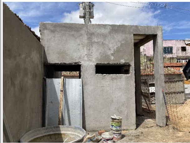
Fig. 15 – estrutura da guarita