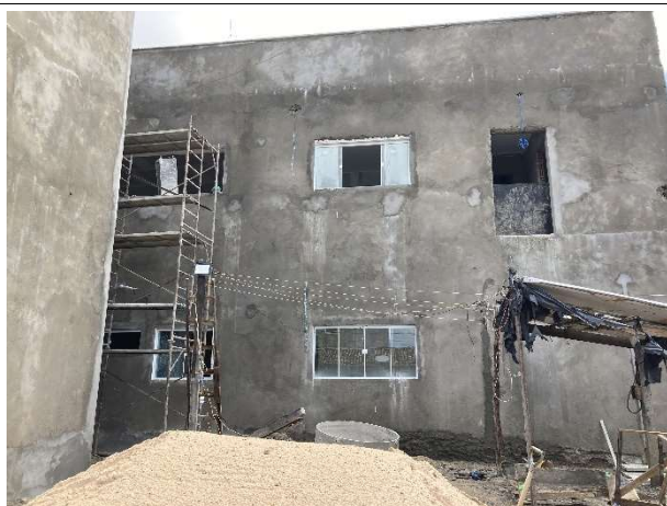
Fig. 13 – execução de revestimentos e esquadrias