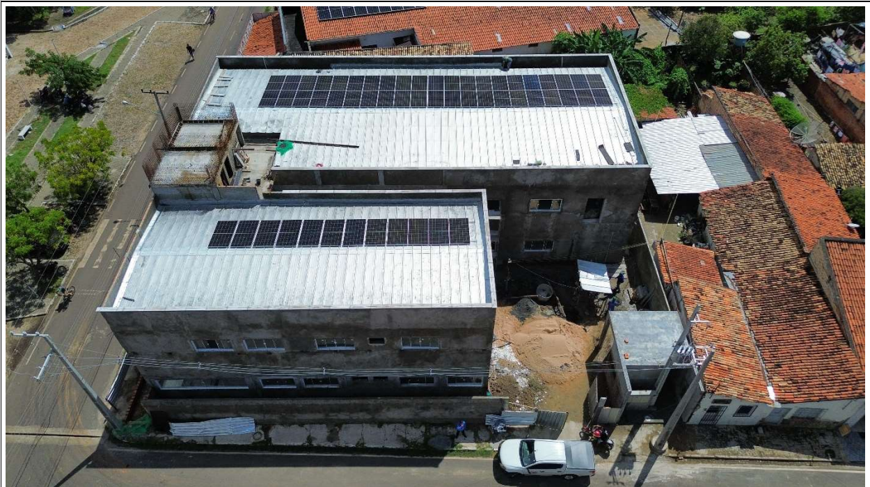
Fig. 2 – Vista aérea da obra