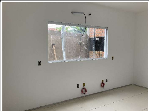
Fig. 6 – instalações de climatização, elétricas e lógicas