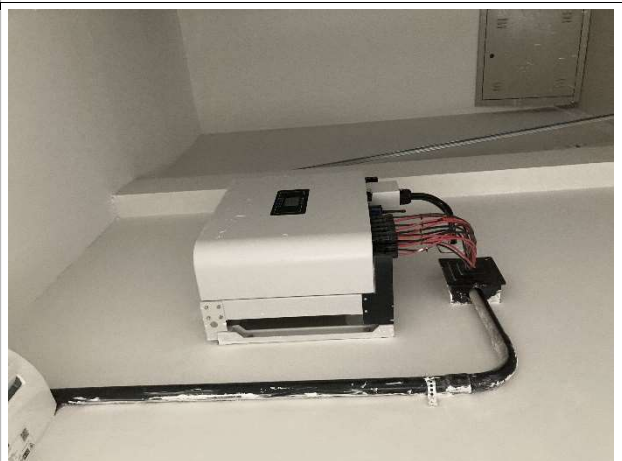
Fig. 12 – Inversor do sistema fotovoltaico