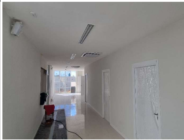
Fig. 9 – Execução de pintura, instalações e esquadrias