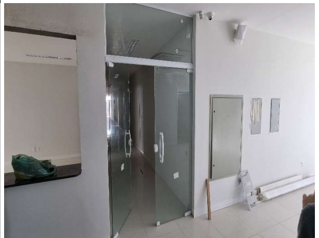
Fig. 10 – Pintura e instalações elétricas