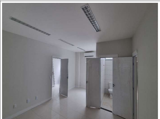
Fig. 14 – Esquadrias, pintura e instalações