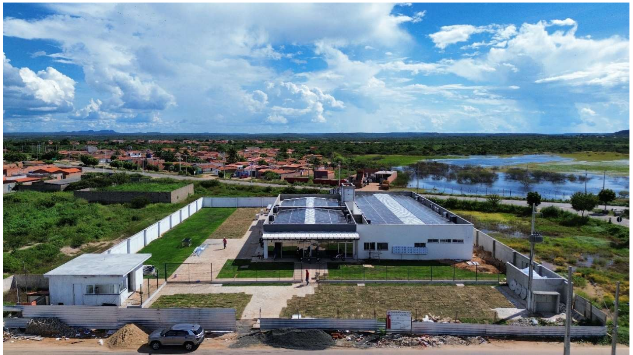
Fig. 1 – Vista aérea da obra