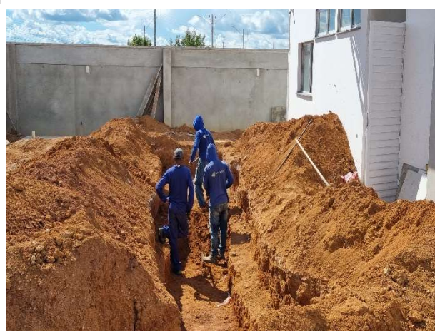
Fig. 7 – Execução de instalações sanitárias