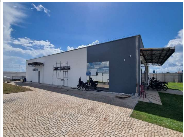
Fig. 4 – Execução de pintura