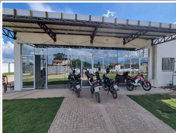
Fig. 5 – Execução de esquadrias