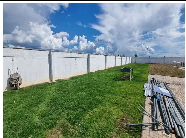
Fig. 6 – Execução de paisagismo