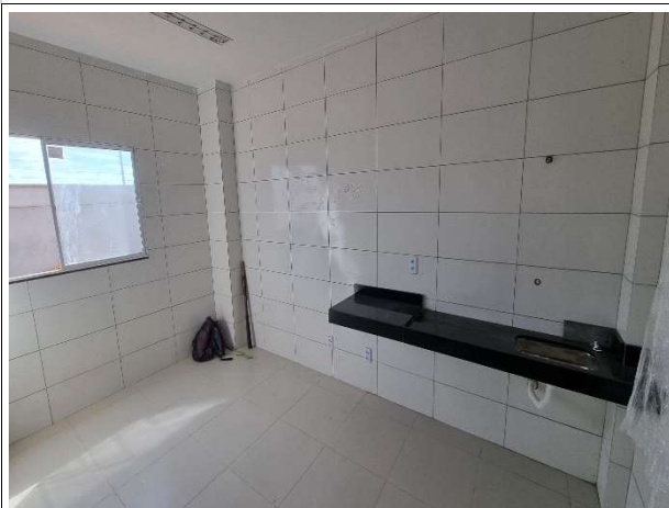
Fig. 13 – Instalações hidrossanitárias e revestimentos