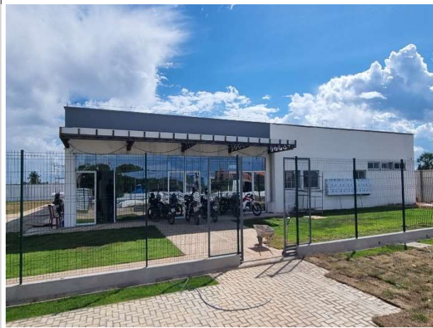
Fig. 3 – Fachada frontal