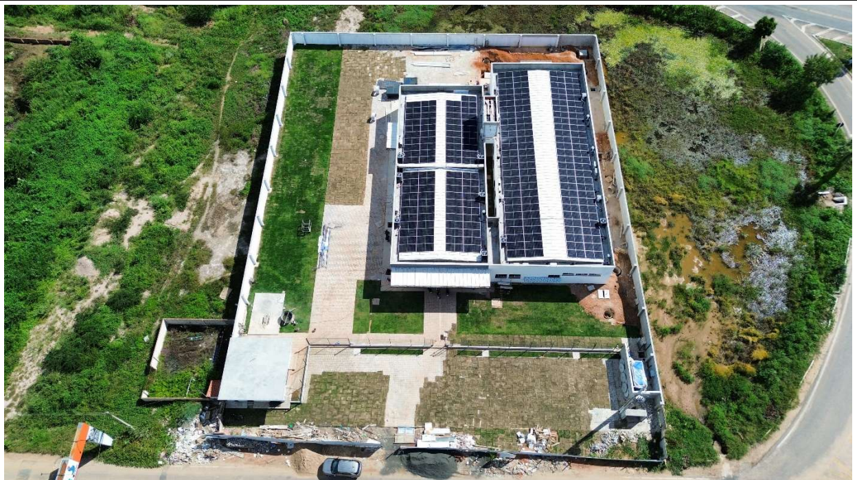
Fig. 2 – Vista aérea da obra