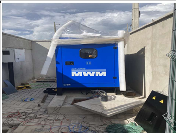
Fig. 11 – Grupo gerador