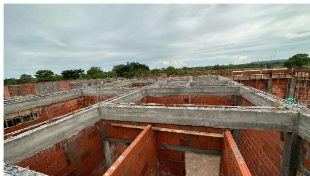
Fig. 6 – (2.3 Superestrutura) – Vigas Concretadas