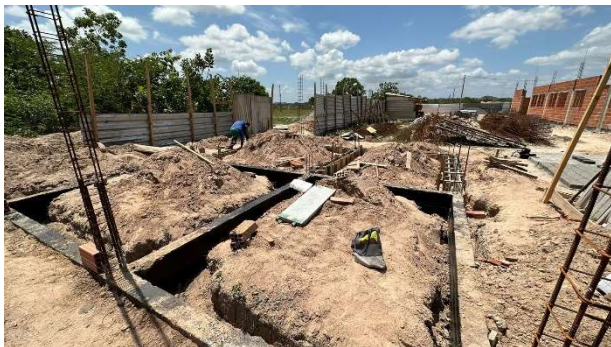
Fig. 1 – (2.0 Infraestrutura) – Movimento de terra – Aterro e compactação