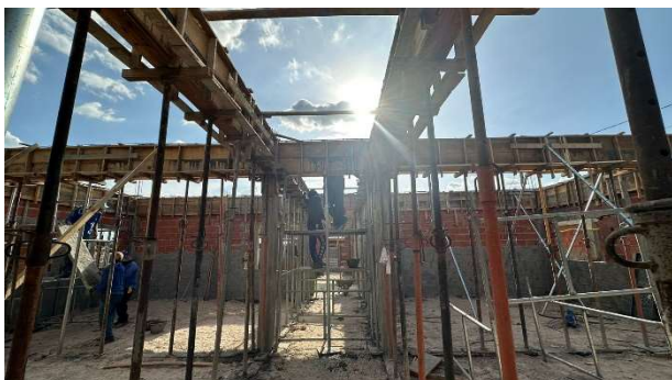
Fig. 5 – (2.3 Superestrutura) – Forma e Armação de vigas