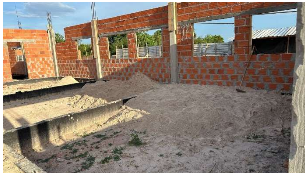
Fig. 2 – (2.0 Infraestrutura) – Movimento de terra – Aterro e compactação