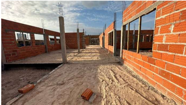
Fig. 13 – (2.3 Superestrutura) – Verga de janelas