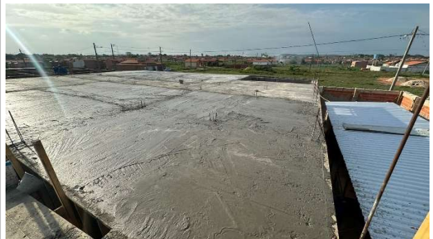
Fig. 10 – (2.3 Superestrutura) – Laje concretada