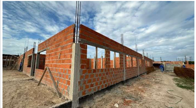
Fig. 14 – (2.3 Superestrutura) – Verga de janelas