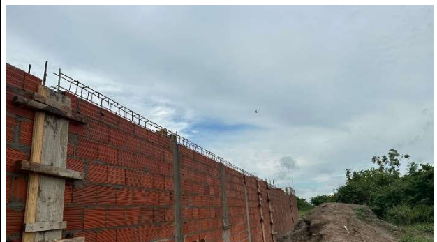
Fig. 18 - (4.0 Paredes e Paineis) – Alvenaria de Vedação