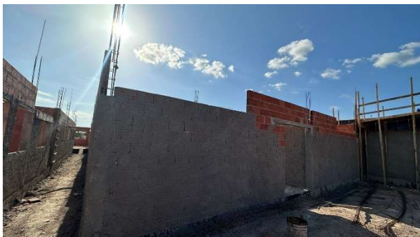
Fig. 11 – (2.3 Superestrutura) – Verga de portas