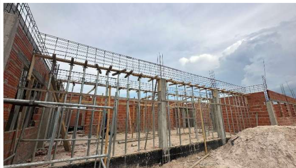
Fig. 4 – (2.3 Superestrutura) – Pilares concretados e armação das vigas