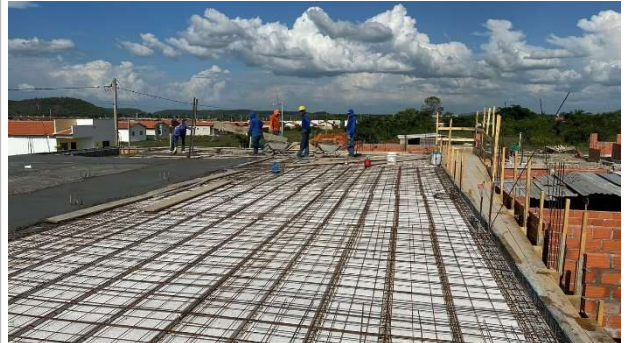
Fig. 8 – (2.3 Superestrutura) – Montagem e concretagem de Laje