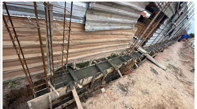
Fig. 16 - (3.0 Construção de Muro) - concretagem de viga e armação de pilares