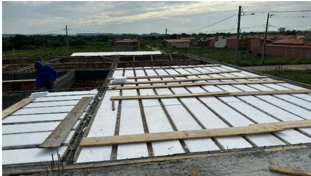
Fig. 7 – (2.3 Superestrutura) – Montagem de Laje