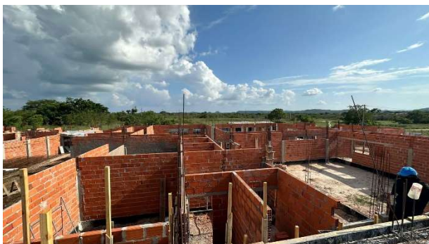
Fig. 17 -(4.0 Paredes e Paineis) – Alvenaria de Vedação