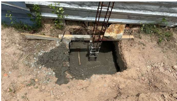
Fig. 15 – (3.0 Construção de Muro) – Fundação