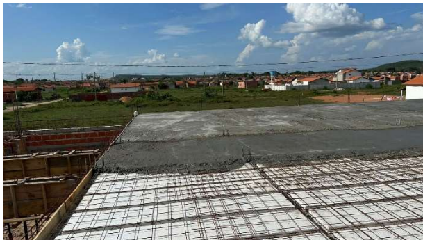
Fig. 9 – (2.3 Superestrutura) – Concretagem de Laje