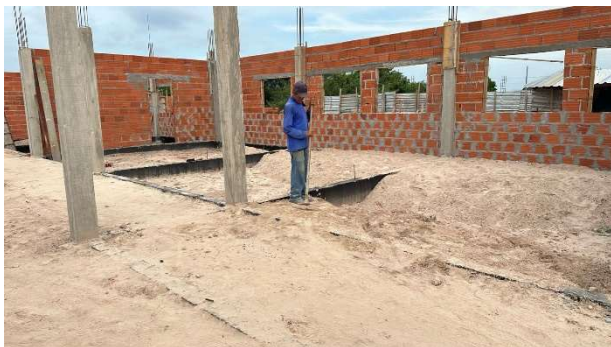
Fig. 3 – (2.0 Infraestrutura) – Movimento de terra – Aterro e compactação