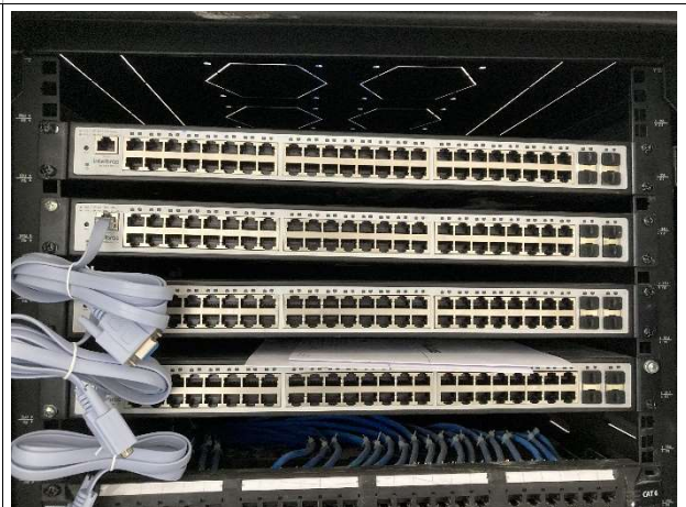
Fig. 6 – instalações de cabeamento estruturado