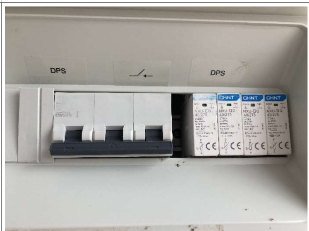
Fig. 12 – execução de instalações elétricas