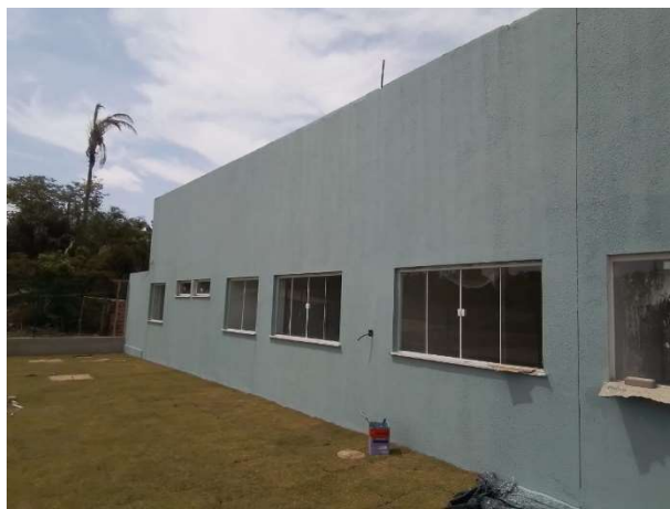
Fig. 1 – execução de pintura da fachada