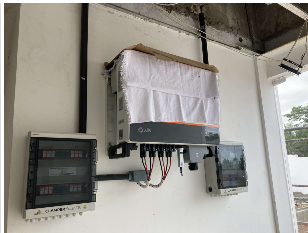
Fig. 7 – inversor do sistema fotovoltaico