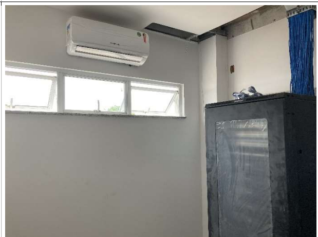
Fig. 10 – instalação de cabeamento estruturado e climatização