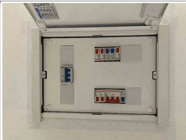
Fig. 9 – execução de instalações elétricas