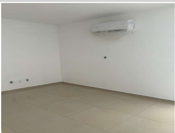
Fig. 5 – execução de pintura e instalação de climatização