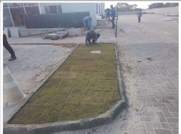
Fig. 4 – execução de pavimentação e plantio de grama