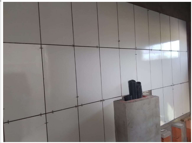
Fig. 8 – instalações elétricas e revestimentos