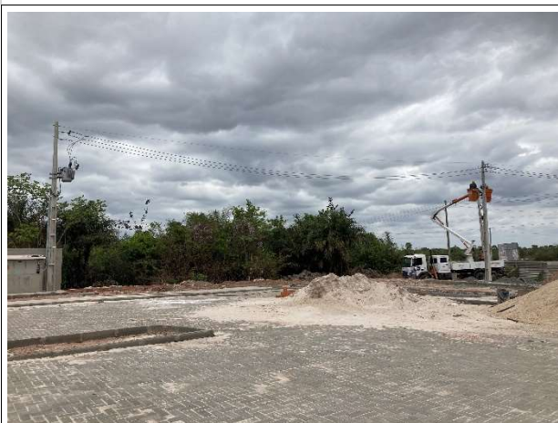
Fig. 11 – execução de pavimentação