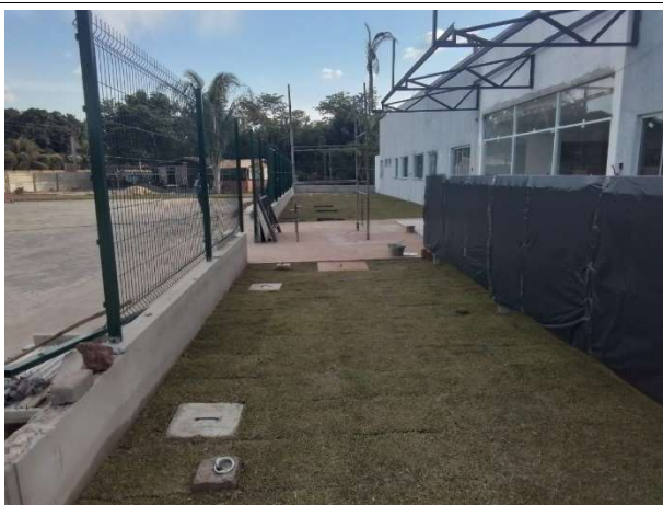
Fig. 3 – execução de plantio de grama e pintura