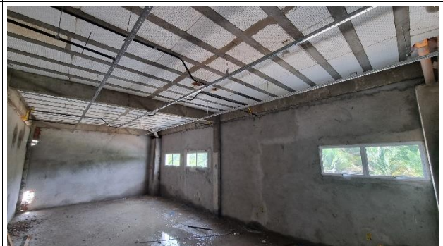
Fig. 16 – Revestimento, Esquadrias, Instalações Elétricas - SUGESQ.