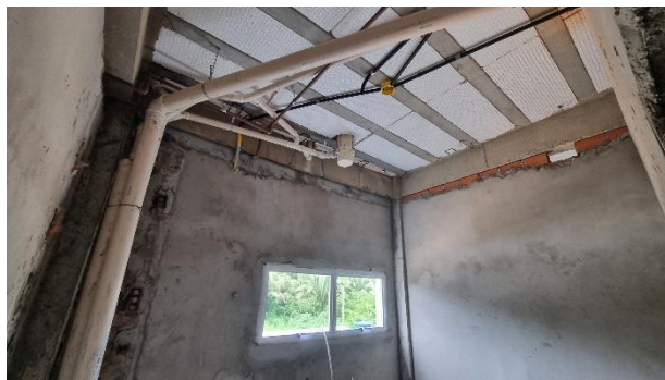
Fig. 9 – Instalações Elétricas e Sanitária - SUGESQ.