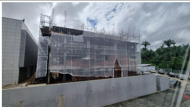
Fig. 5 – Fachada Auditório.