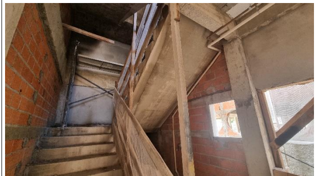
Fig. 14 – Escada