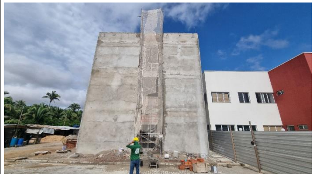
Fig. 2 - Fachada lateral da SUGESQ.