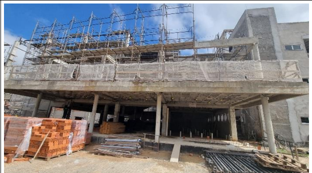
Fig. 6 – Fachada Auditório.