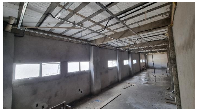
Fig. 10 – Revestimento, Esquadrias, Instalações Elétricas e Sanitária - SUGESQ.