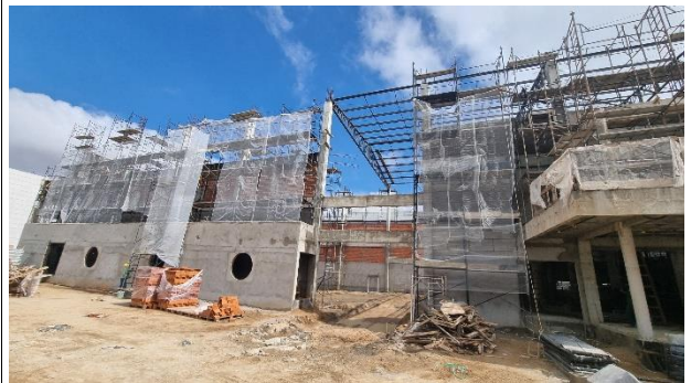
Fig. 4 – Fachada Auditório.