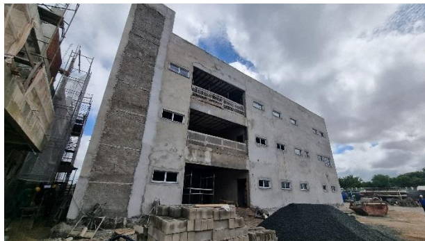
Fig. 3 – Fachada lateral da SUGESQ.