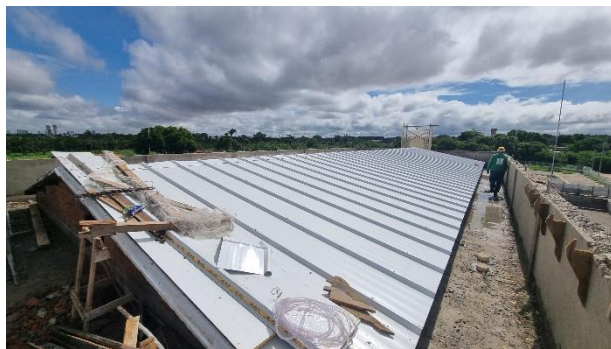
Fig. 11 – Cobertura