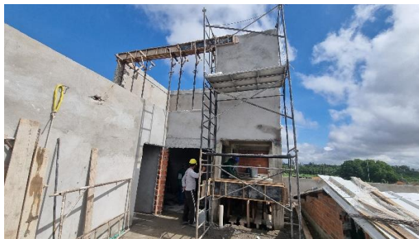
Fig. 13 – Caixa d'água