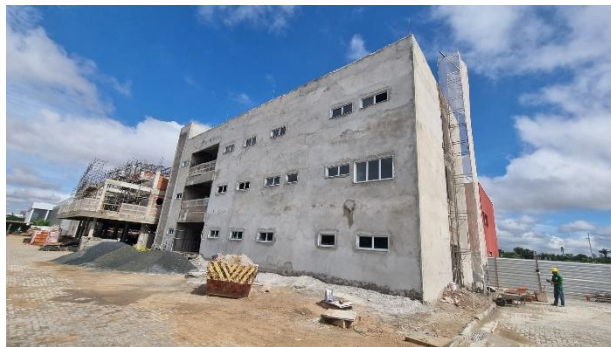
Fig. 1 – Fachada lateral da SUGESQ.