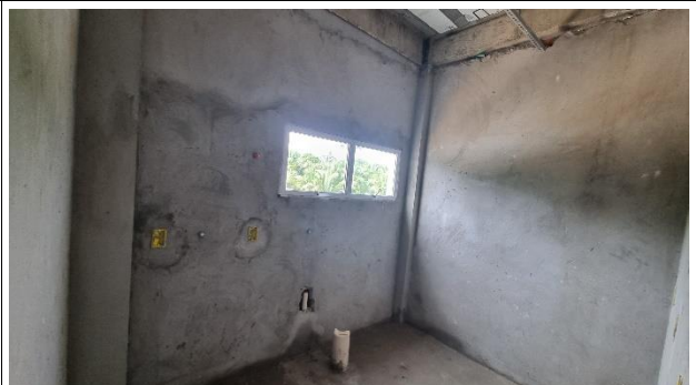
Fig. 8 – Revestimento, Instalações hidráulica, Sanitária e Esquadrias - SUGESQ.