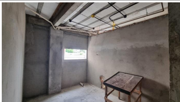
Fig. 7 – Revestimento e Instalações - SUGESQ.