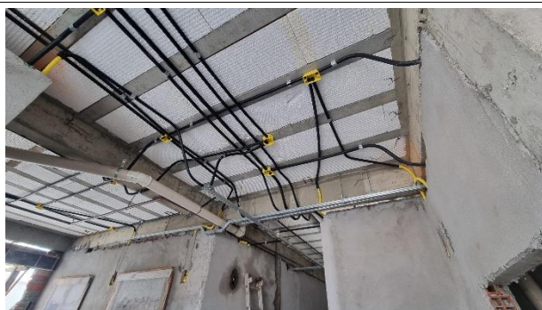
Fig. 15 – Instalações Elétricas