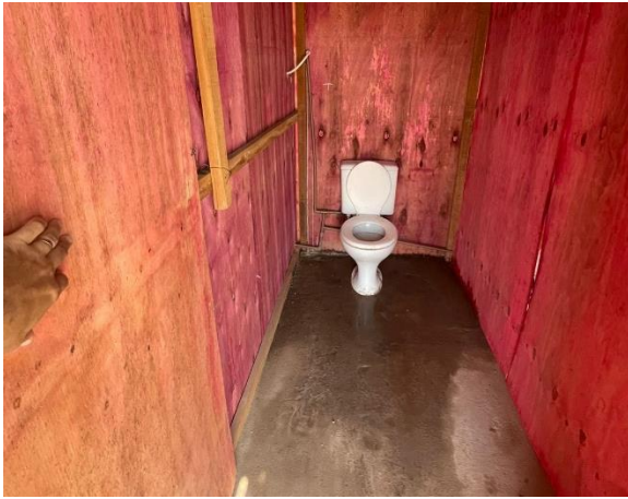
Fig. 9 – Banheiro do canteiro de obra