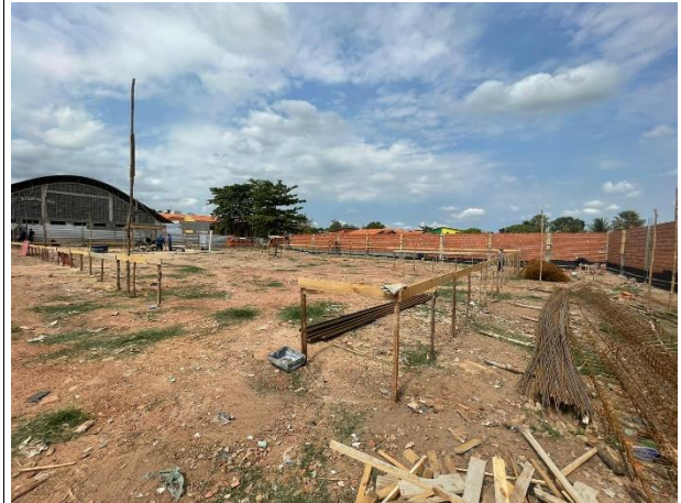
Fig. 10 – Locação com tábuas corridas pontaletadas iniciada