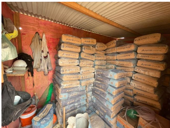
Fig. 7 – Almoarifado do canteiro de obra