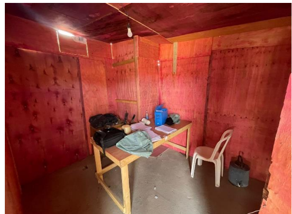
Fig. 8 – Escritório do canteiro de obra