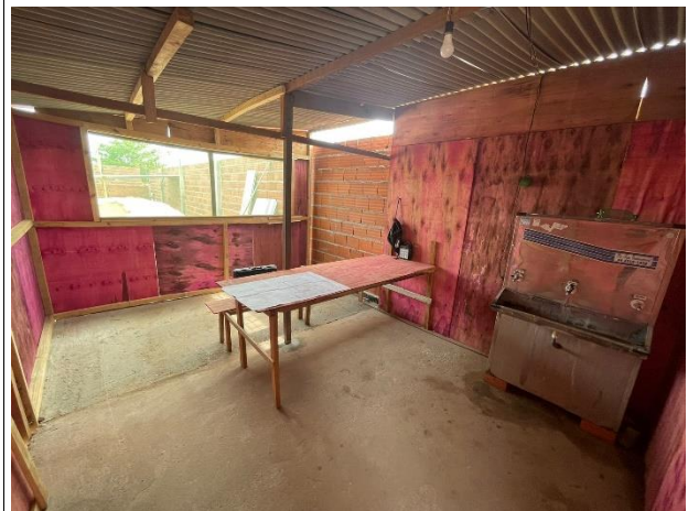
Fig. 6 – Refeitório do canteiro de obra