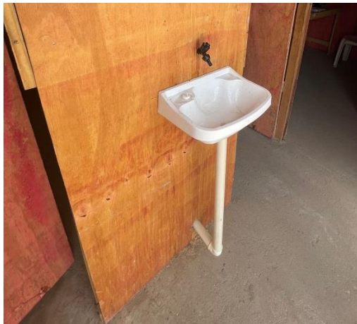
Fig. 13 – Instalações do canteiro obras