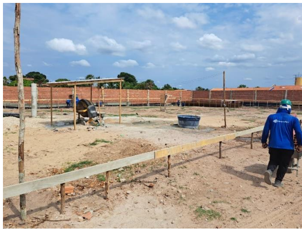
Fig. 3 – Terreno limpo de vegetação