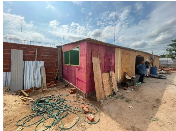
Fig. 14 – Disposição do canteiro de obras