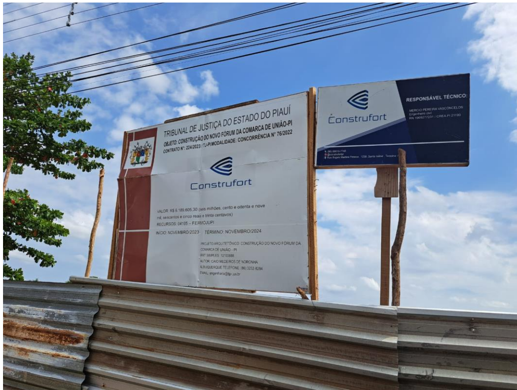
Fig. 1 – Placa da obra