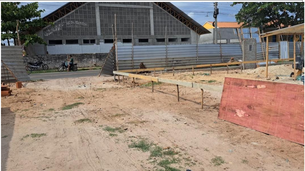
Fig. 2 – Tapume fechando a parte frontal da obra