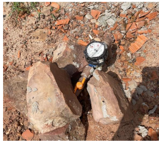
Fig. 4 – Instalação provisória de água