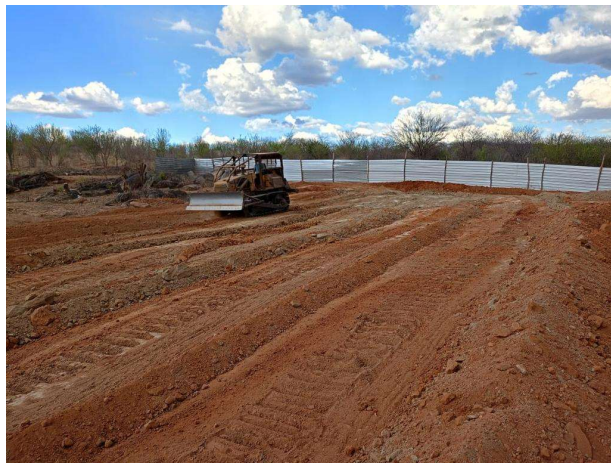
Fig. 7 – (2.0 Infraestrutura) – Movimento de terra