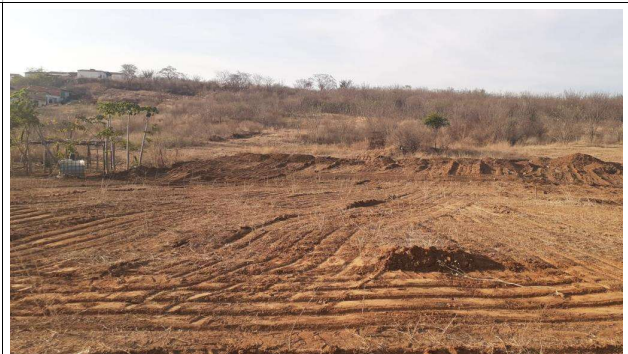
Fig. 10 (2.0 Infraestrutura) – Movimento de terra