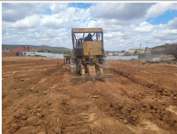
Fig. 9 – (2.0 Infraestrutura) – Movimento de terra