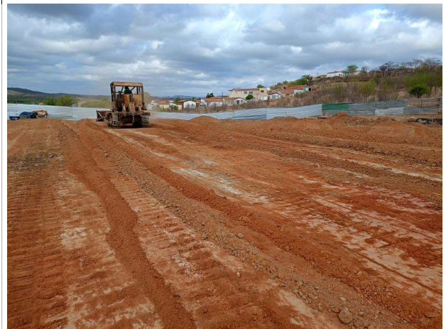
Fig. 8 – (2.0 Infraestrutura) – Movimento de terra