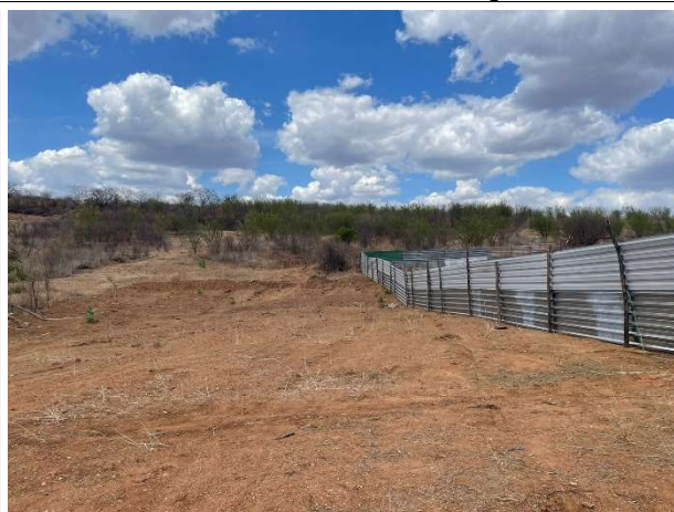
Fig. 2 – (1.0 Serviços Preliminares) - Fechamento em tapume