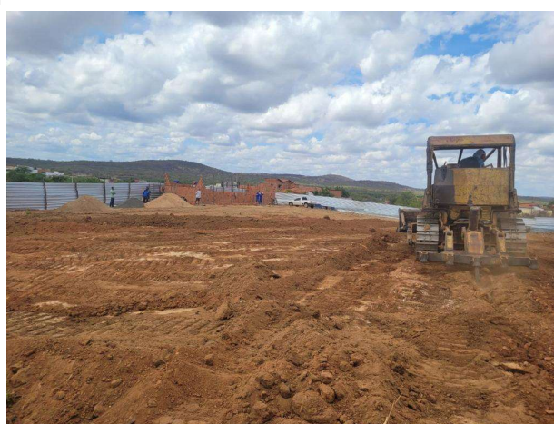
Fig. 6 (2.0 Infraestrutura) – Movimento de terra