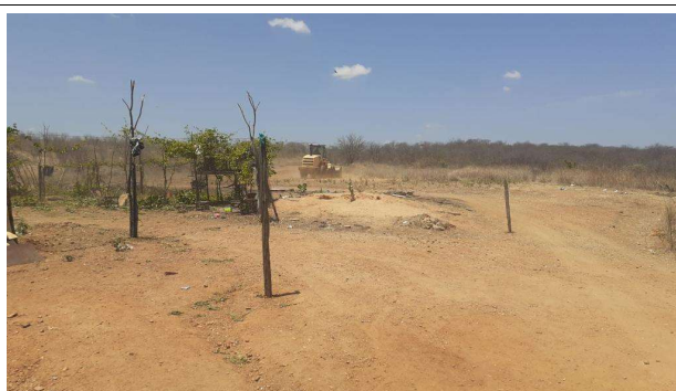
Fig. 3 – (1.0. Serviços preliminares) – Limpeza mecanizada do terreno