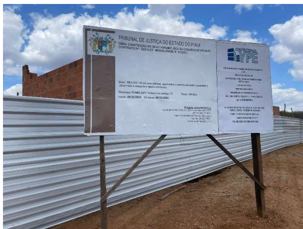
Fig. 1 – (1.0. Serviços preliminares) – Placa de obra