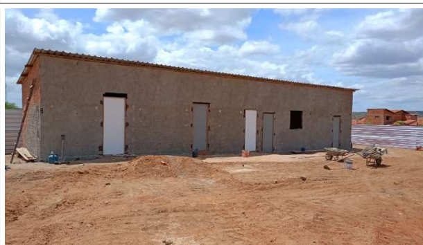
Fig. 4 – (1.0 Serviços preliminares) – Canteiro de obras