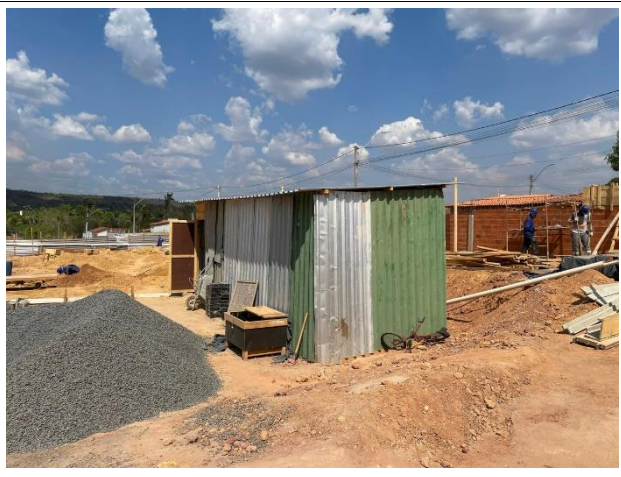
Fig 8 (1.0 Serviços Preliminares) – Execução de Almoxarifado