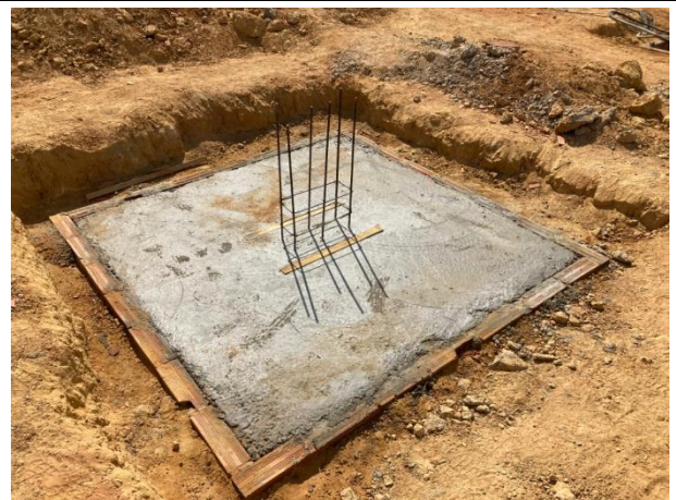
Fig. 6 (4.0 infraestrutura) – CONCRETO FCK = 30MPA, TRAÇO 1:2,1:2,5 (EM MASSA SECA DE CIMENTO/ AREIA MÉDIA/ BRITA 1) - PREPARO MECÂNICO