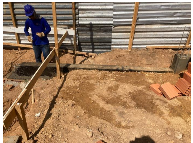
Fig. 4 (4.0 infraestrutura) – Execução de viga baldrame