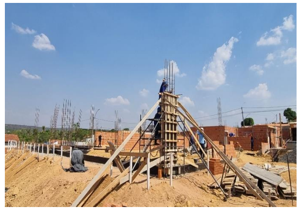
Fig 10 (5.0 Superestrutura)- ARMAÇÃO DE PILAR e LANÇAMENTO COM USO DE BALDES, ADENSAMENTO E ACABAMENTO DE CONCRETO EM ESTRUTURAS