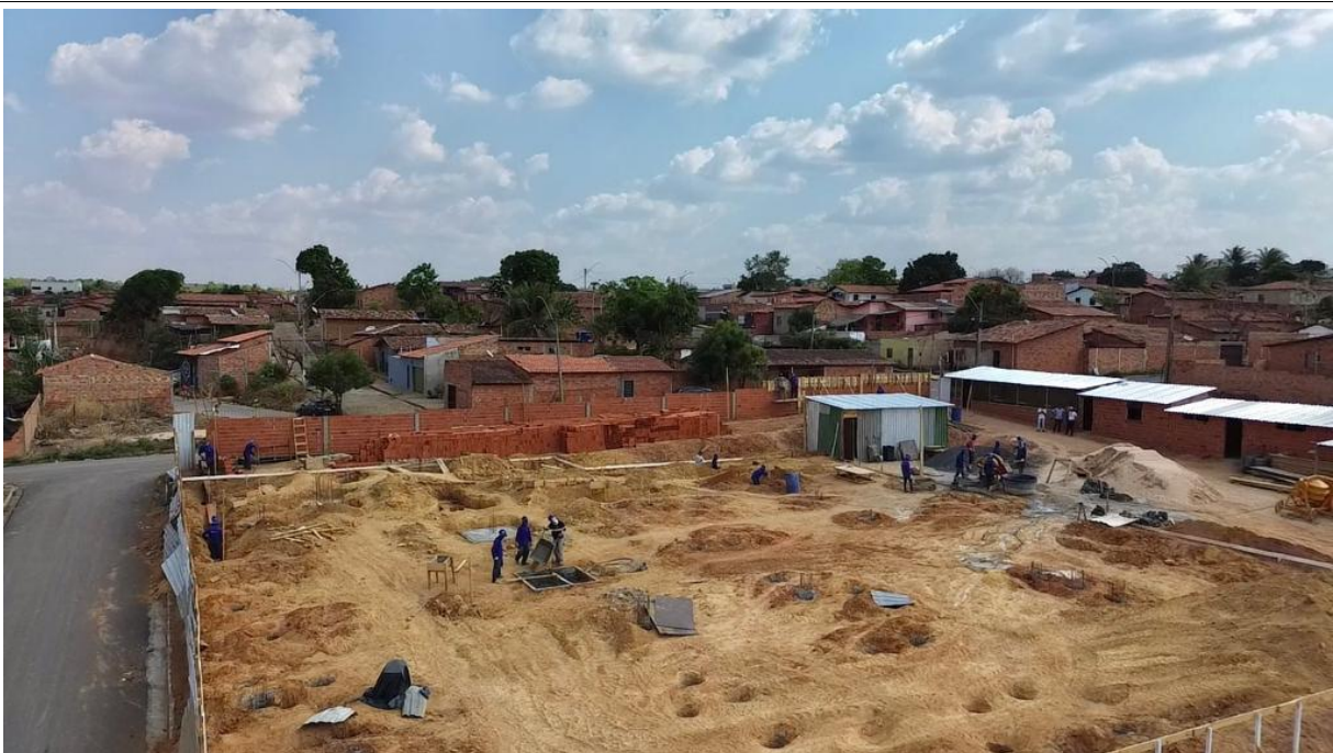
Fig. 2 (3.0 Movimentação de terra) – ESCAVAÇÃO MANUAL DE VALA PARA VIGA BALDRAME (INCLUINDO ESCAVAÇÃO PARA COLOCAÇÃO DE FÔRMAS)