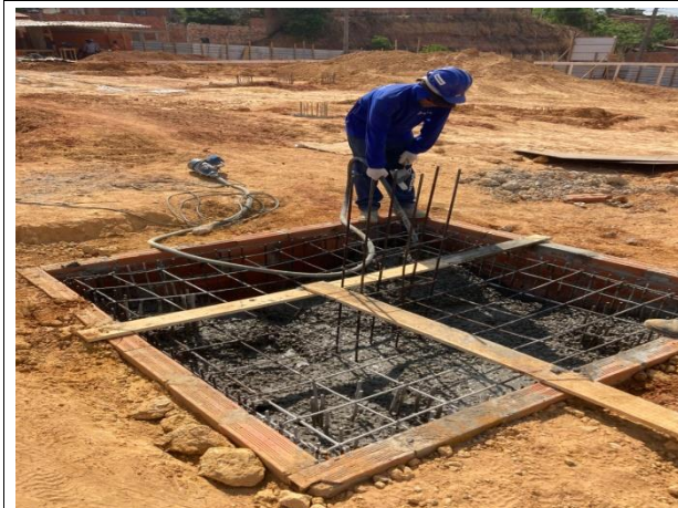
Fig. 5 (4.0 Infraestrutura) – ARMAÇÃO DE BLOCO, VIGA BALDRAME OU SAPATA UTILIZANDO AÇO CA-50 DE 10 MM - MONTAGEM. AF_06/2017