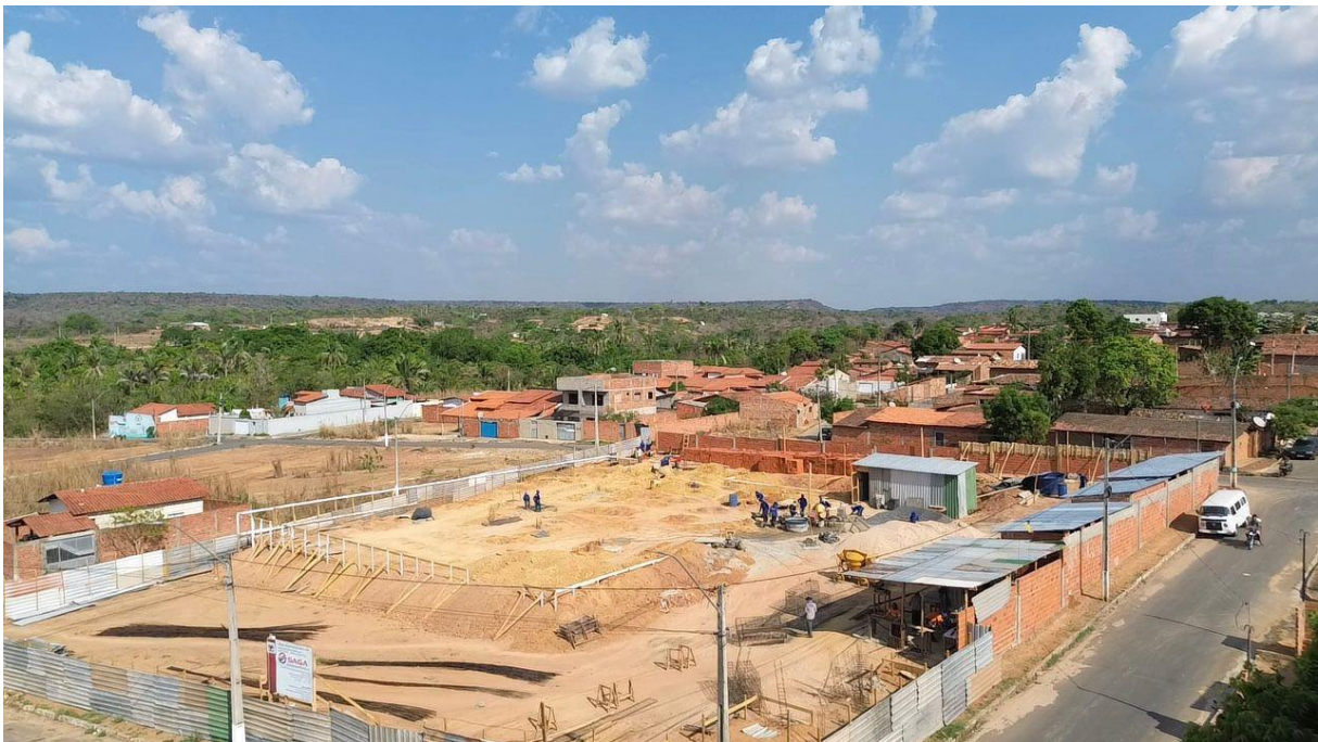
Fig. 1 – (3.0 Movimentação de Terra) EXECUÇÃO E COMPACTAÇÃO DE ATERRO COM SOLO PREDOMINANTEMENTE ARGILOSO-