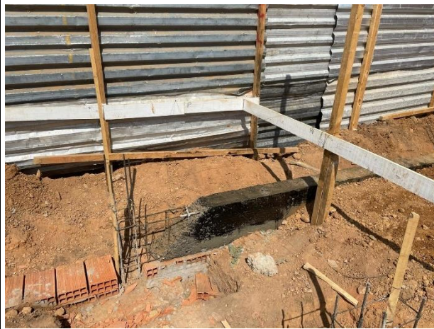
Fig. 9 (6.0 Impermeabilização) - IMPERMEABILIZAÇÃO DE SUPERFÍCIE COM MANTÁ ASFÁLTICA

SUPERINTENDÊNCIA DE ENGENHARIA E ARQUITETURA