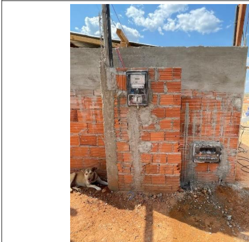
Fig. 7 (1.0 Serviços Preliminares) - INSTALAÇÃO PROVISÓRIA ÁGUA, LUZ/FORÇA E ESGOTO