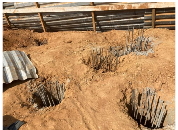
Fig. 4 – ( 4.0 Infraestrutura) - Execução de infraestrutura (estacas -45cm)