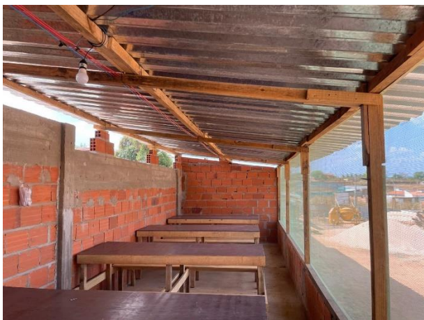
Fig. 9 – ( Serviços Preliminares) – Execução de Refeitório em canteiro de obra