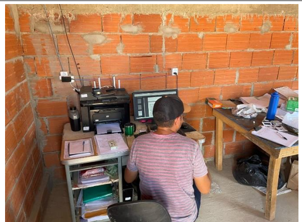
Fig. 12 ( Serviços preliminares) – Execução de Escritório em Canteiro de Obra.