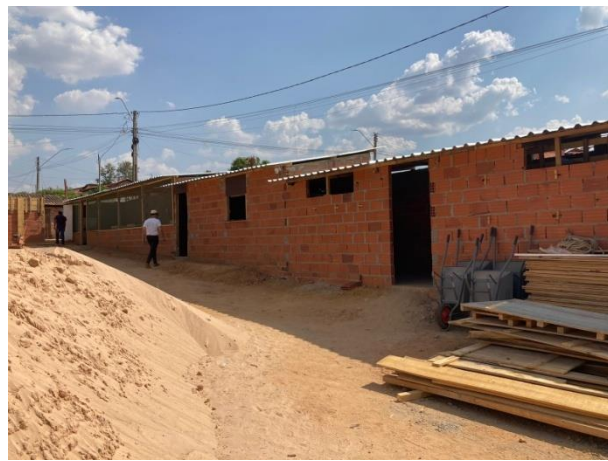
Fig. 7 – (1.0 Serviços Preliminares) – execução de almojarifado em canteiro de obra.