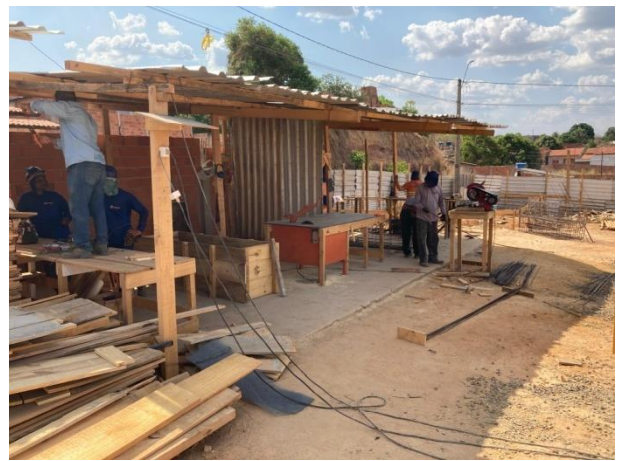
Fig. 8 – ( Serviços Preliminares)- Instalações de apoio do canteiro de obra