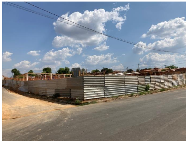
Fig. 1 – (1.0. Serviços preliminares)-instalação de tapumes com telha metálica