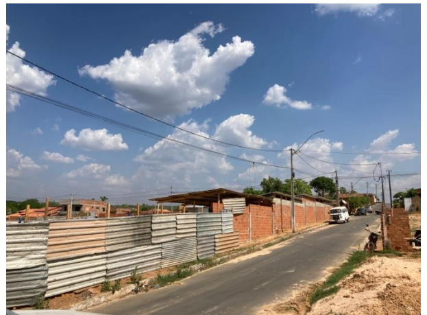
Fig. 2 – (1.0 Serviços Preliminares)- Fechamento em tapume e muro de alvenaria