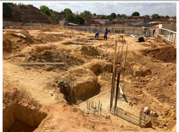
Fig. 6 – ( 4.0 Infraestrutura)- Escavações e infraestrutura (armação de bloco e estacas)