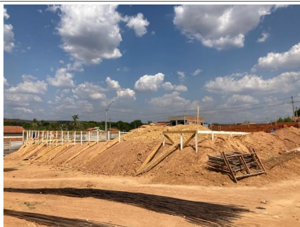
Fig. 5 – (1.0 Serviços Preliminares) -Locação de obra