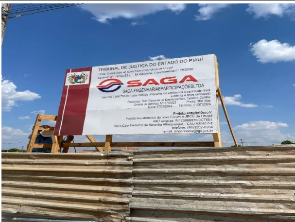
Fig. 3 – (1.0. Serviços preliminares)- placa de obra