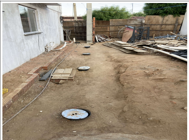
Fig. 14 – Execução de instalações elétricas