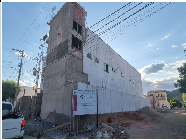
Fig. 3 – Fachada frontal