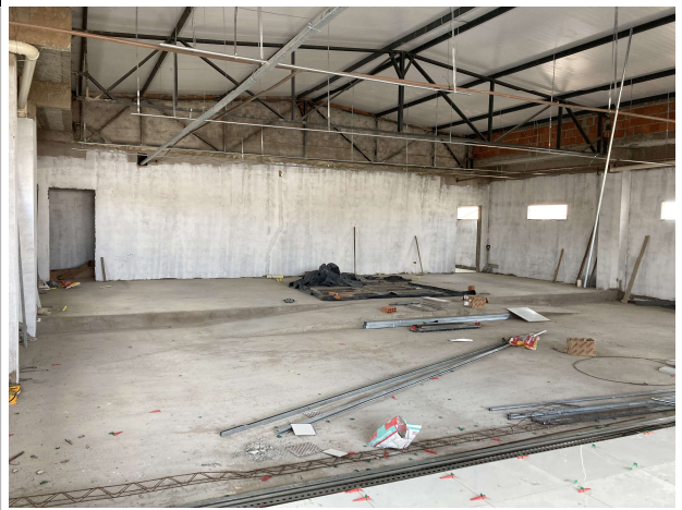
Fig. 10 – Execução de estrutura metálica