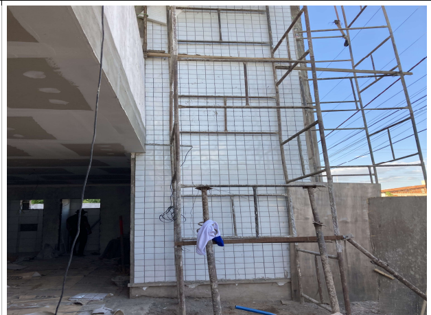
Fig. 6 – Execução de revestimentos