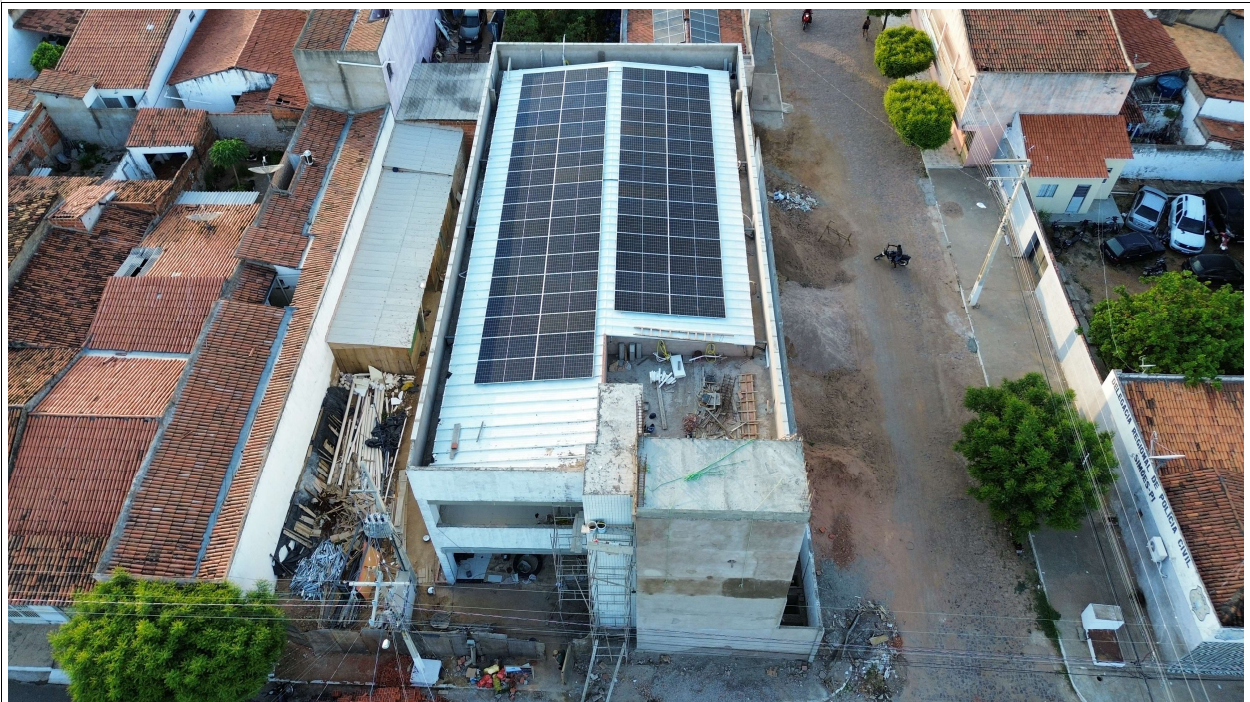
Fig. 2 – Vista aérea da obra