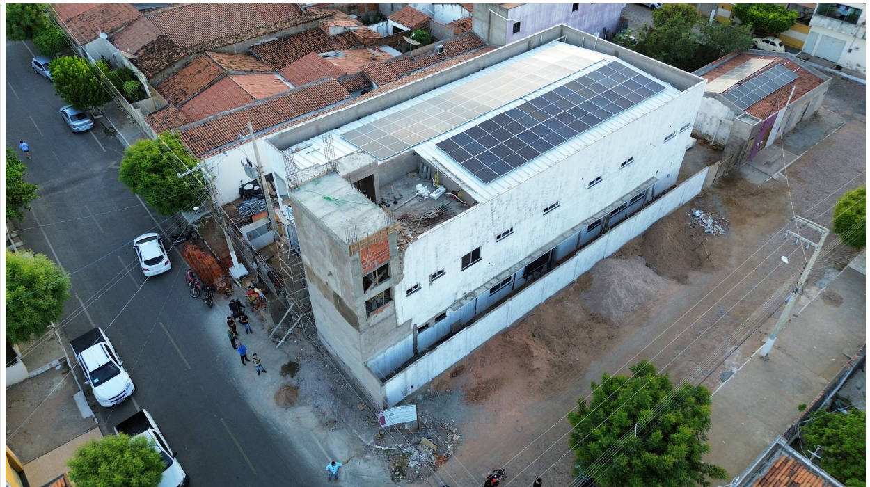
Fig. 1 – Vista aérea da obra