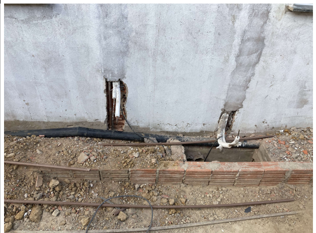
Fig. 12 – Execução de instalações hidrossanitárias