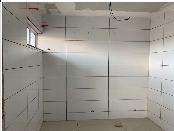
Fig. 11 – Execução de revestimentos e instalações hidráulicas