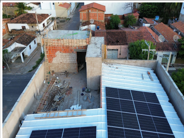
Fig. 5 – Execução de superestrutura e paredes