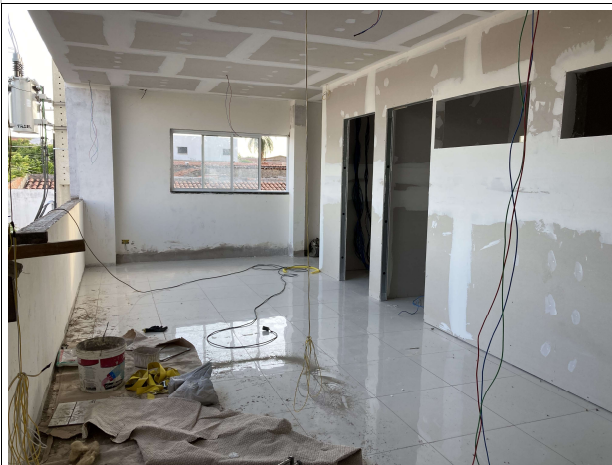
Fig. 13 – Execução de instalações, forro e paredes