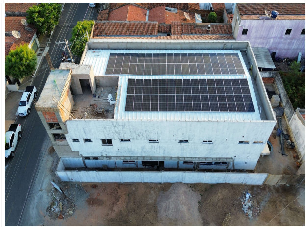
Fig. 4 – Fachada lateral