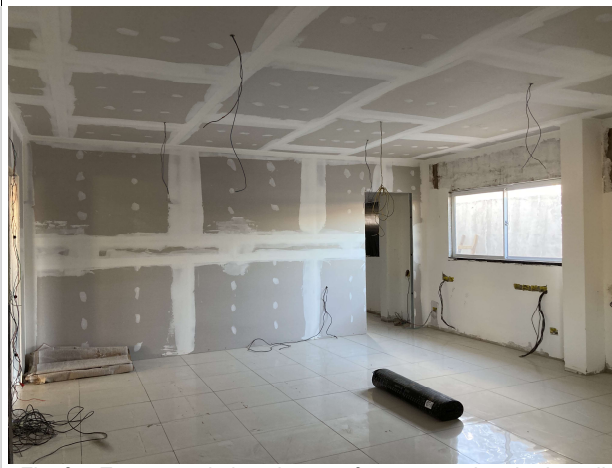
Fig. 9 – Execução de instalações, forro e paredes de drywall