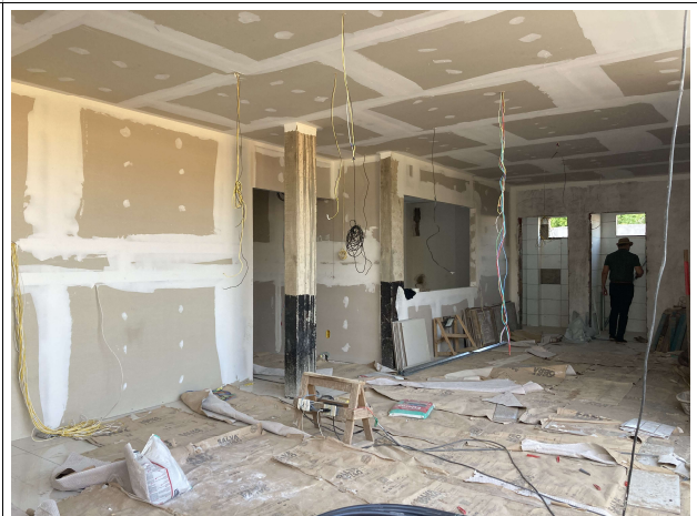
Fig. 8 – Execução de forro, paredes e instalações