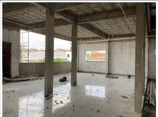
Fig. 12 – Execução de piso cerâmico