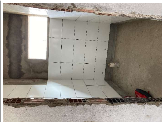
Fig. 8 – Revestimentos cerâmicos