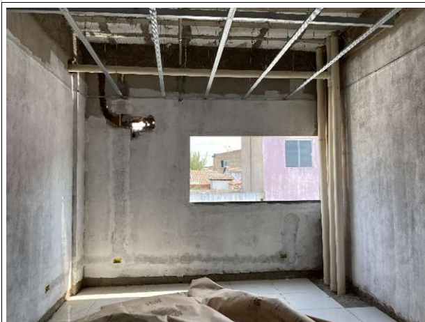
Fig. 19 – Instalações hidrossanitárias/águas pluviais