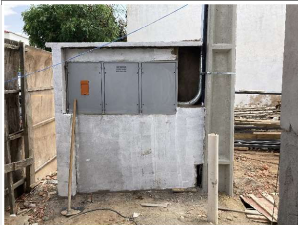
Fig. 5 – Quadro de medição