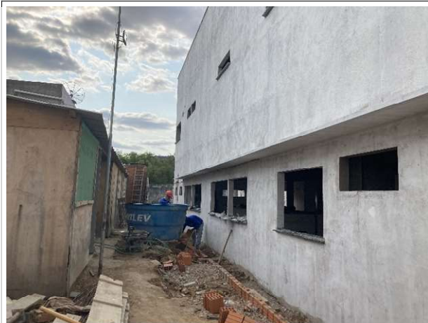
Fig. 17 – Execução de meio fio