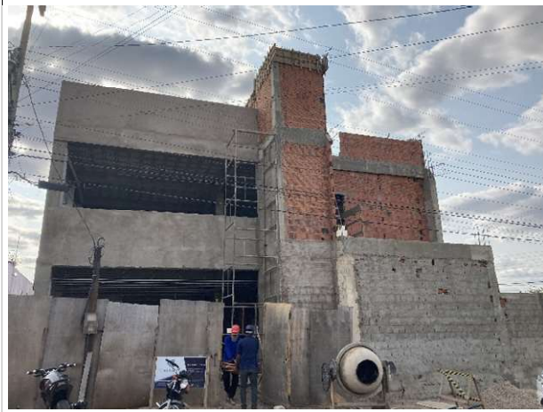
Fig. 3 – Fachada frontal