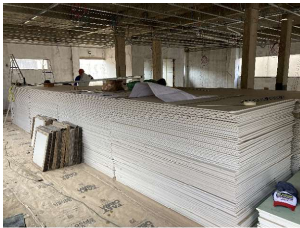
Fig. 9 – Placas de gesso acartonado