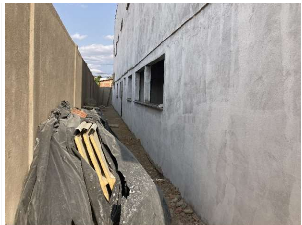
Fig. 16 – Peitoril de granito e emassamento