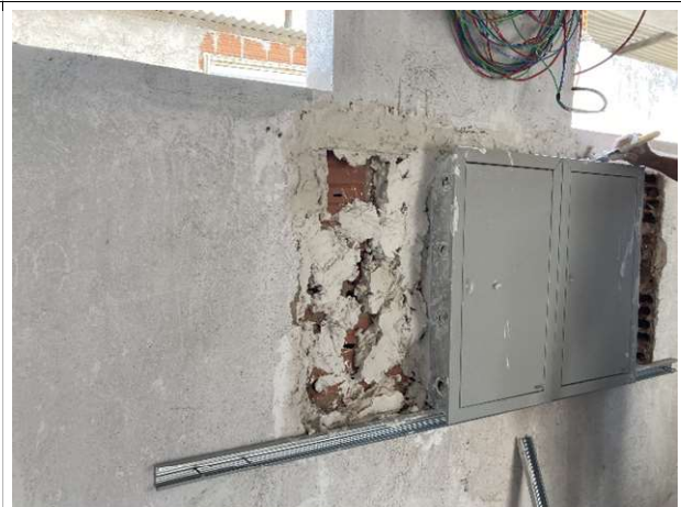
Fig. 18 – Quadros de distribuição