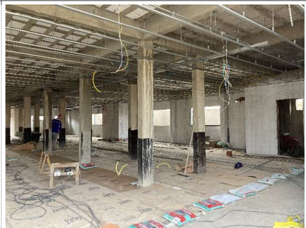
Fig. 6 – Execução de piso e instalações elétricas