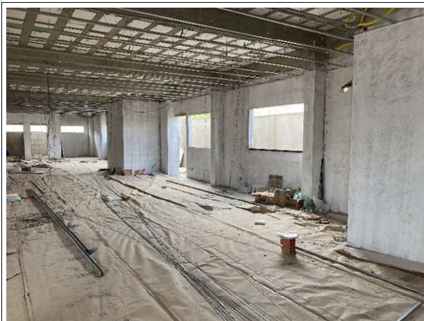
Fig. 7 – Execução de instalações elétricas e emassamento