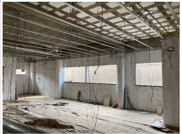
Fig. 10 – Execução de instalações elétricas