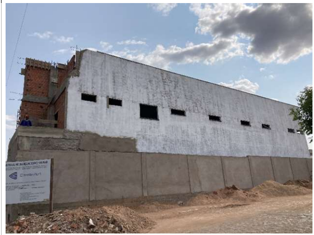
Fig. 4 – Fachada lateral