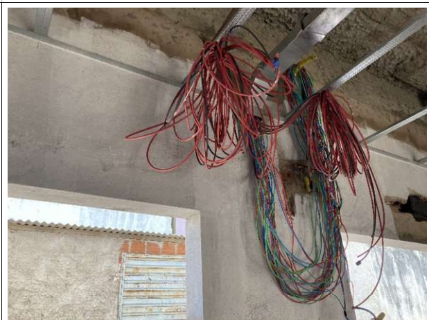
Fig. 20 – Execução de cabeamento