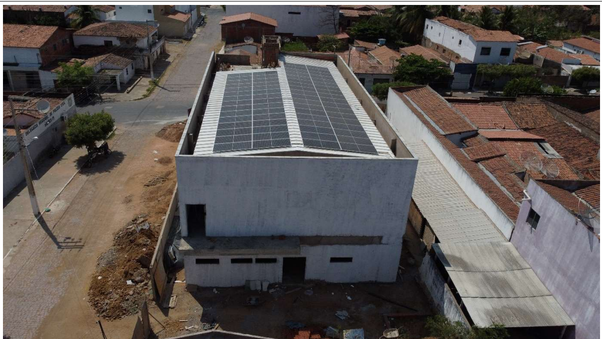
Fig. 2 – Vista aérea da obra