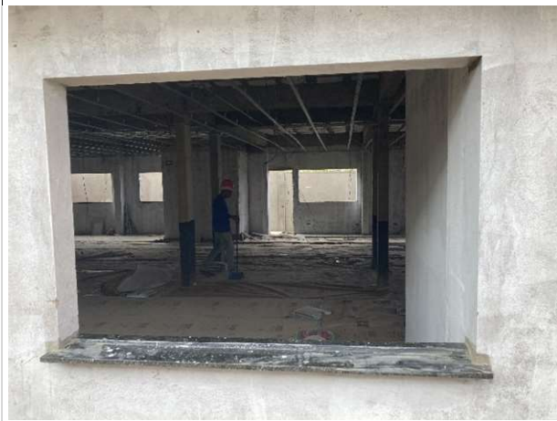
Fig. 15 – Peitoril de granito