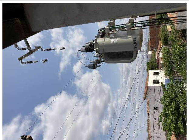
Fig. 14 – Subestação aérea