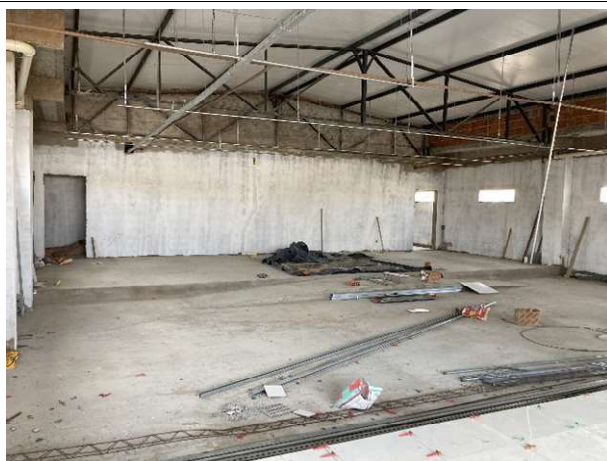
Fig. 11 – Tribunal do Júri