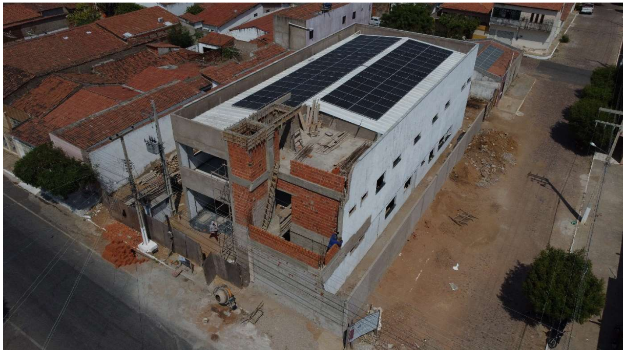
Fig. 1 – Vista aérea da obra