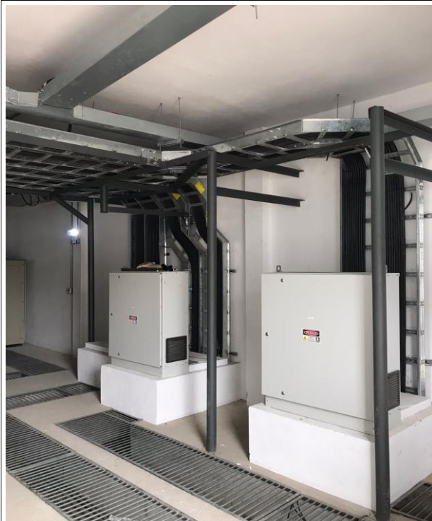
Fig. 17 – Subestação