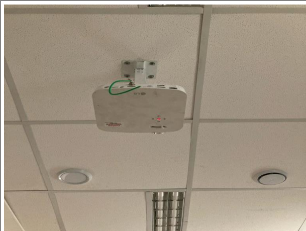
Fig. 13 – Instalações de CATV