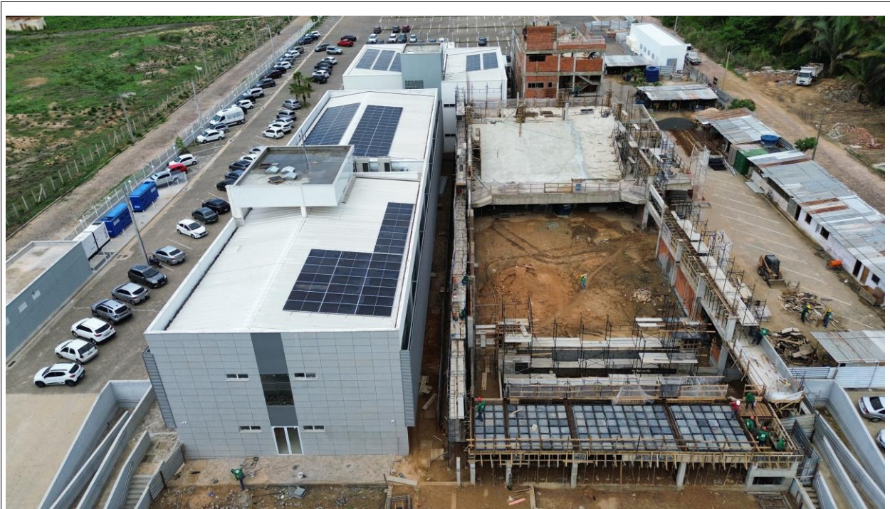
Fig. 1 – Vista aérea da obra