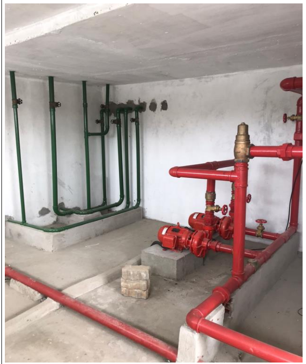
Fig. 28 – Instalações Incêndio