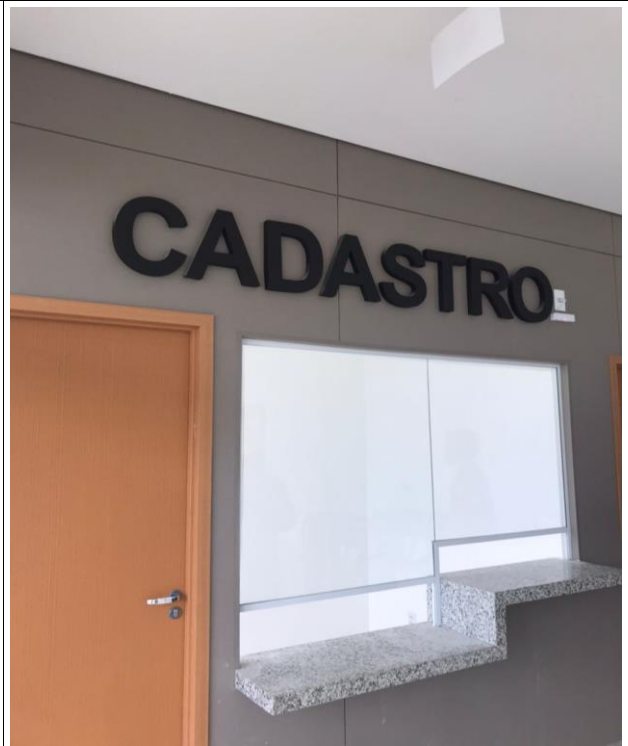
Fig. 22 – Comunicação visual