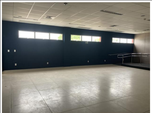
Fig. 14 – Acabamento e revestimentos da EJUD