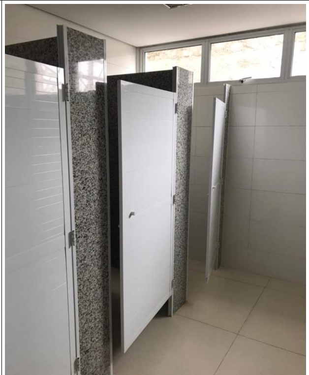
Fig. 30 – Divisórias Granito/Portas Alumínio