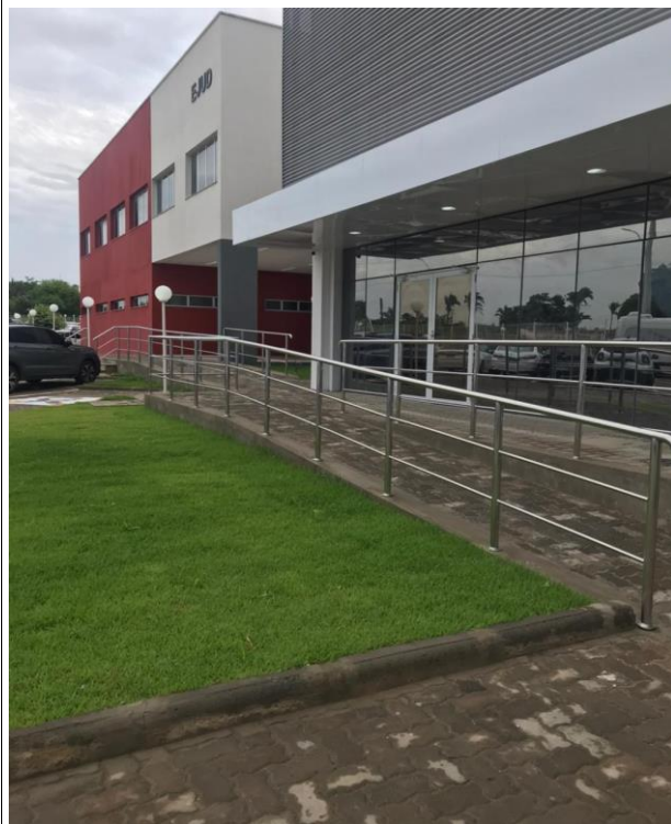
Fig. 19 – Corrimão/Paisagismo