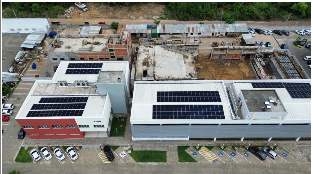
Fig. 2 – Vista aérea da obra