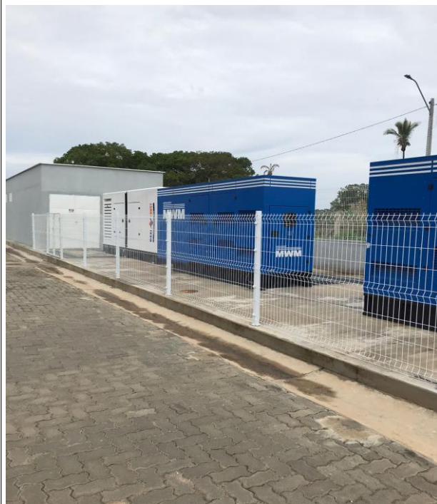
Fig. 15 – Geradores/Subestação