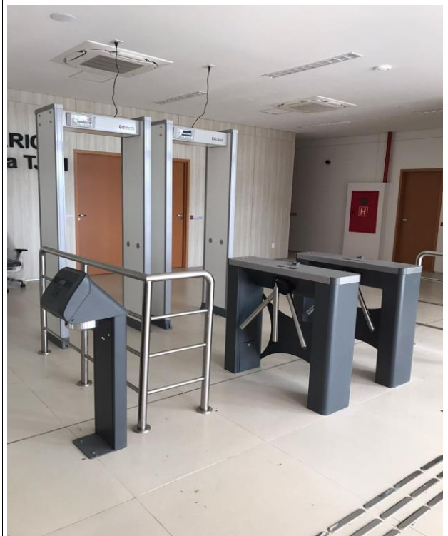
Fig. 20 – Guarda-corpo/Catracas/Detectores