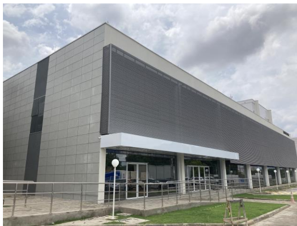
Fig. 3 – Fachada Corregedoria