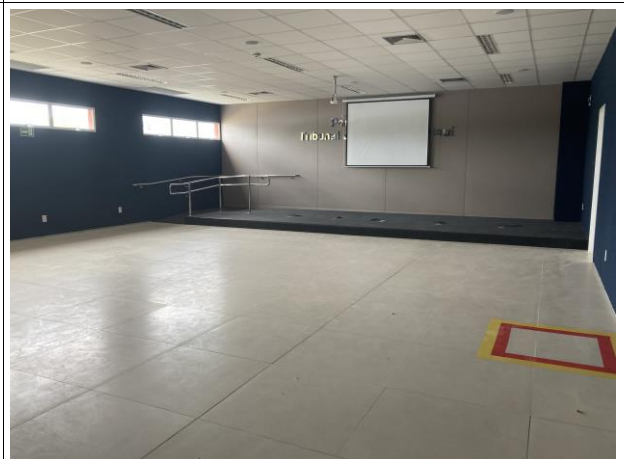
Fig. 8 – Auditório da EJUD