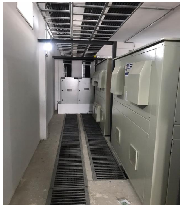
Fig. 16 – Subestação