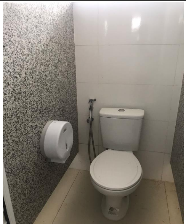
Fig. 26 – Instalações e aparelhos