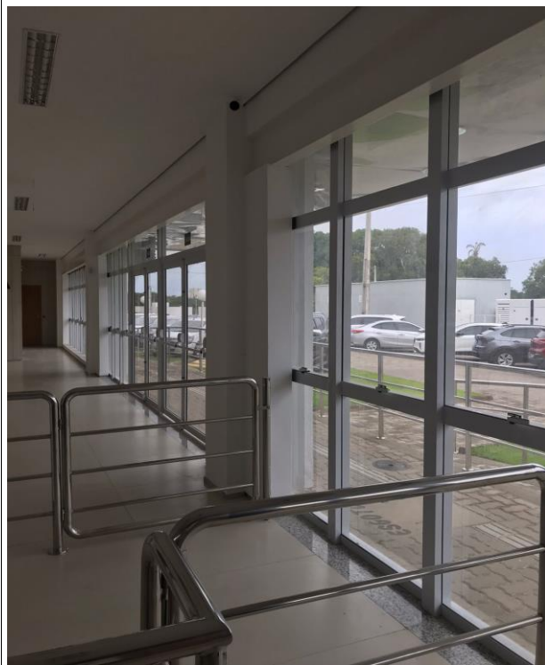
Fig. 27 – Esquadrias