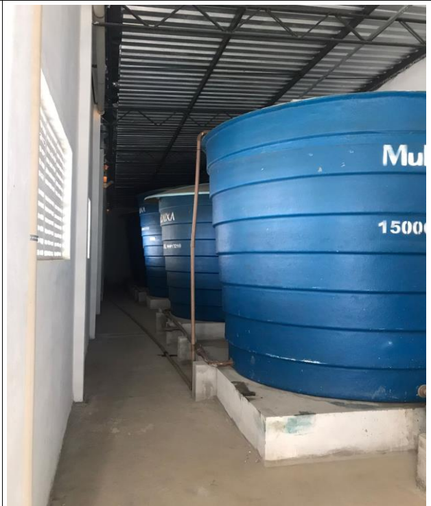
Fig. 18 – Cisternas