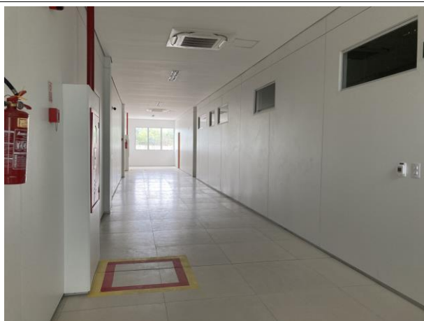
Fig. 7 – Circulação da EJUD