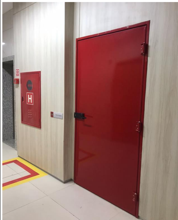
Fig. 23 – Incêndio/Porta Corta Fogo