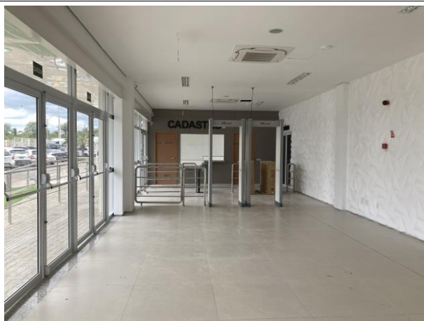
Fig. 5 – Instalações da entrada da Corregedoria