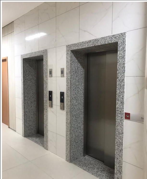
Fig. 21 – Granito Elevadores