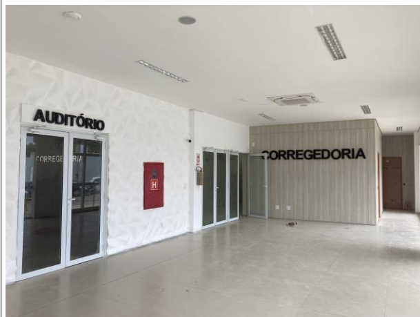
Fig. 9 – Peças de acabamento da Corregedoria