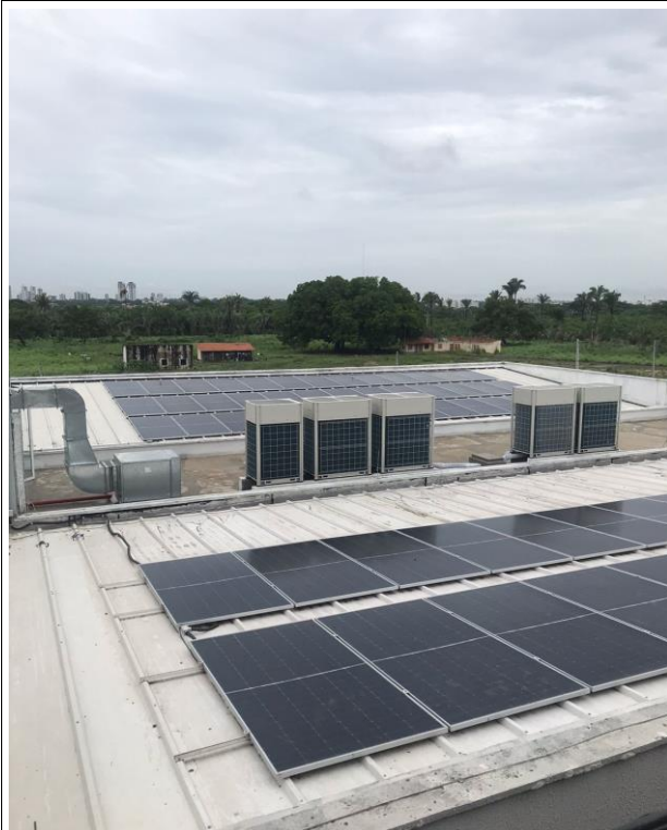
Fig. 29 – Instalações/Placas/Condensadoras