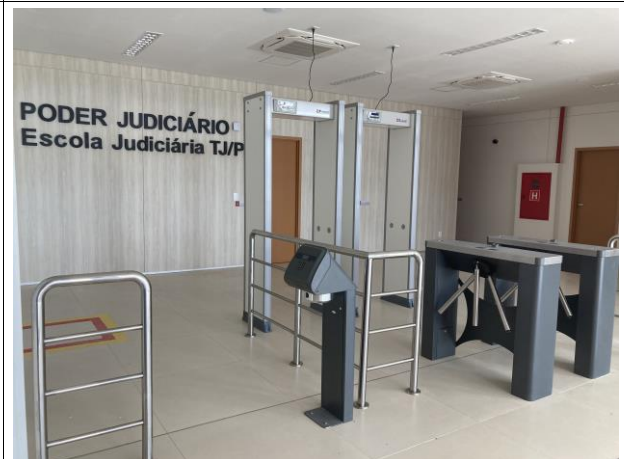
Fig. 6 – Instalações da entrada da EJUD