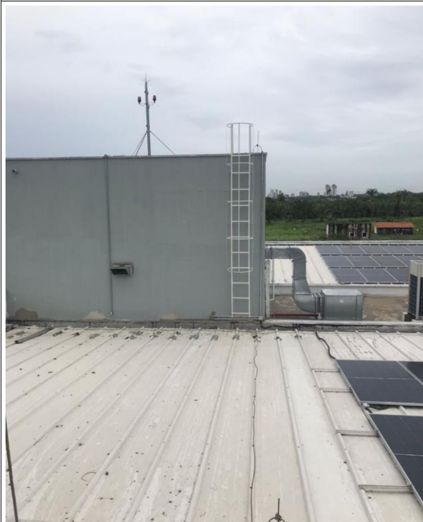
Fig. 25 – Escada Marinheiro