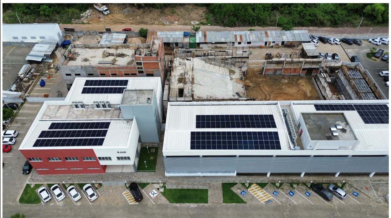
Fig. 2 – Vista aérea da obra