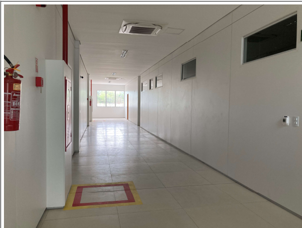
Fig. 7 – Circulação da EJUD