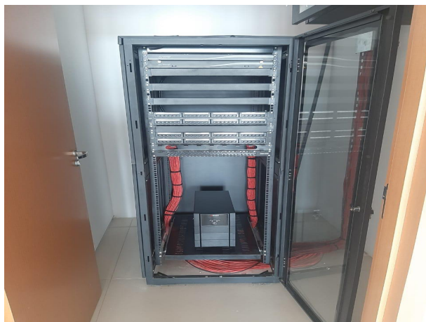
Fig. 11 – Instalações de cabeamento estruturado