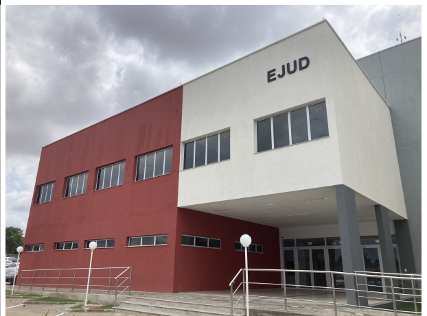
Fig. 4 – Fachada EJUD