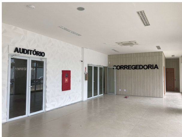
Fig. 9 – Peças de acabamento da Corregedoria