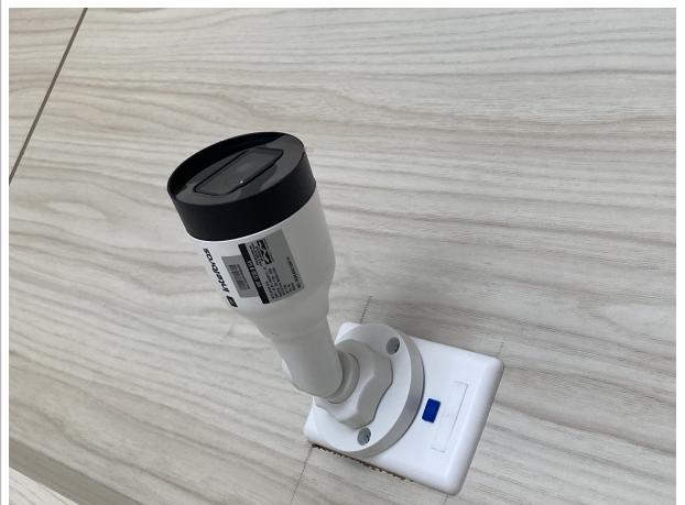
Fig. 12 – Instalações de CFTV