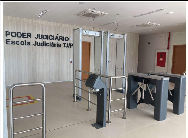
Fig. 6 – Instalações da entrada da EJUD