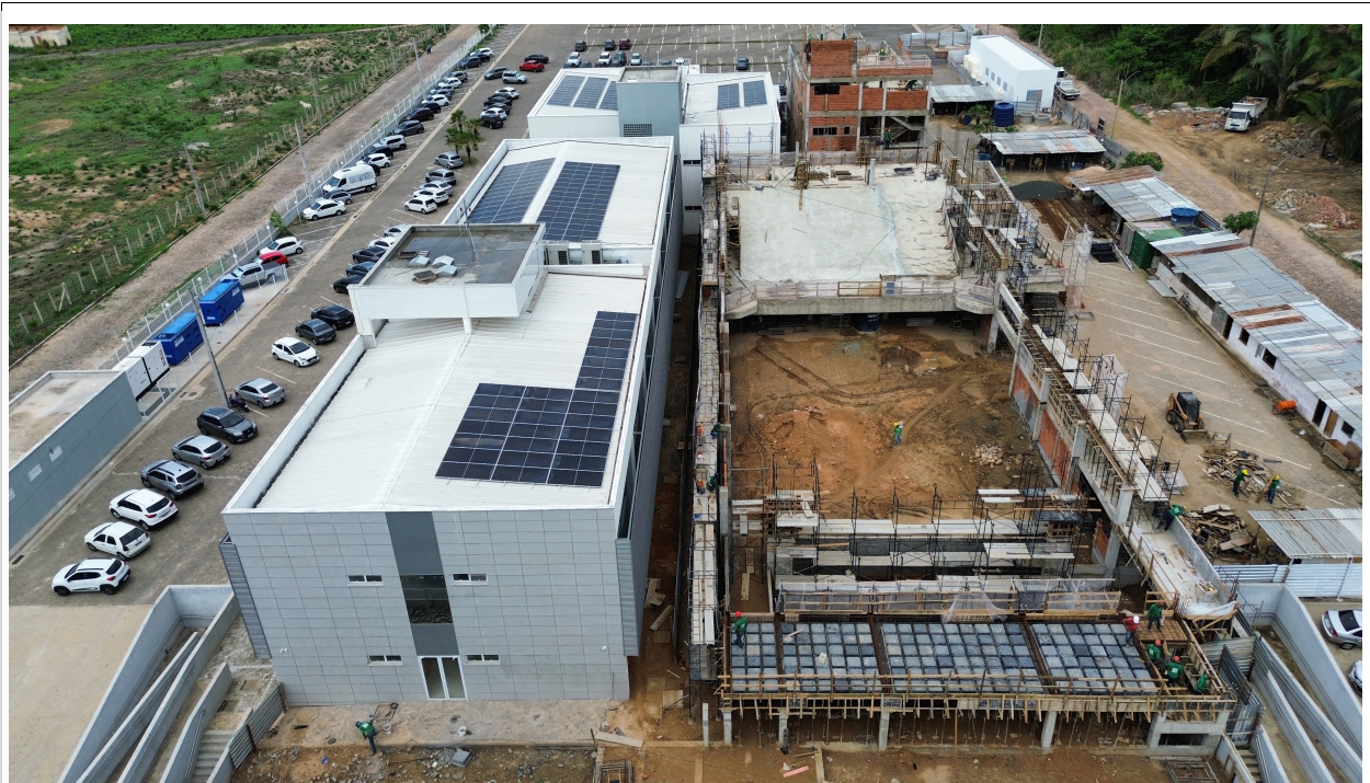
Fig. 1 – Vista aérea da obra