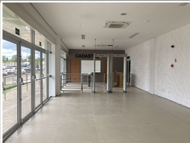
Fig. 5 – Instalações da entrada da Corregedoria