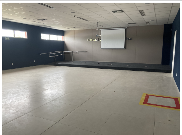
Fig. 8 – Auditório da EJUD