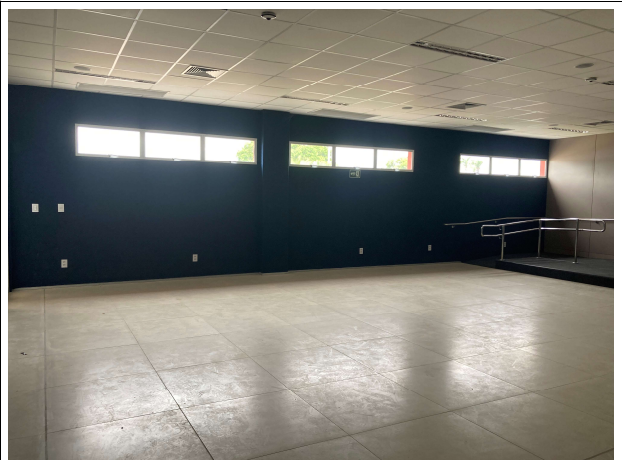
Fig. 14 – Acabamento e revestimentos da EJUD