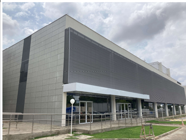
Fig. 3 – Fachada Corregedoria