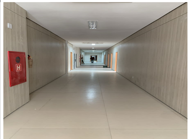
Fig. 10 – Acabamento da Corregedoria