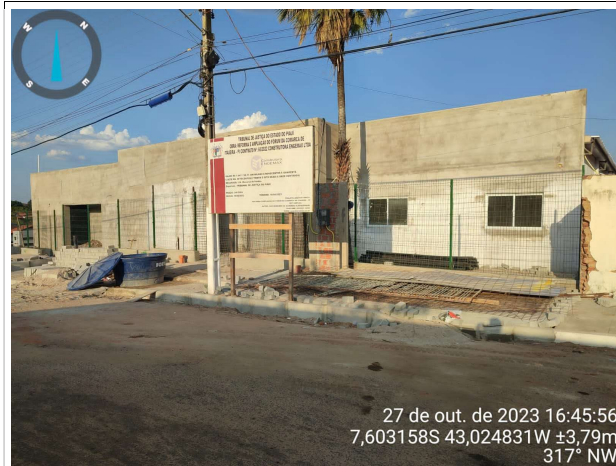
Fig. 3 – fachada frontal