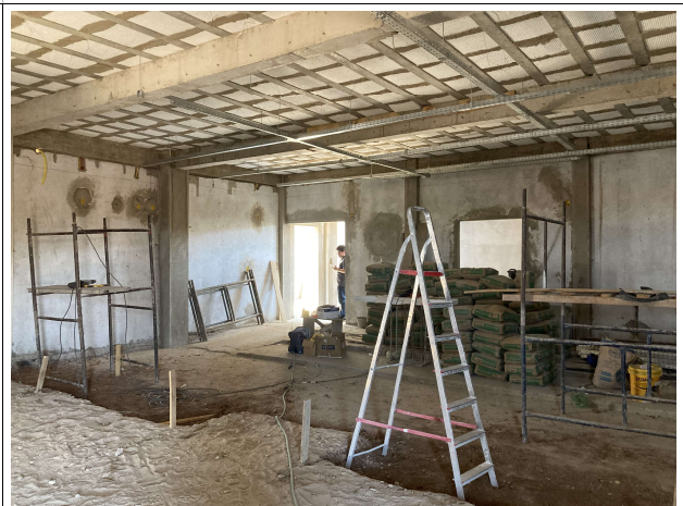
Fig. 8 – tribunal do júri