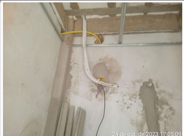
Fig. 12 – execução de instalações de ar condicionado