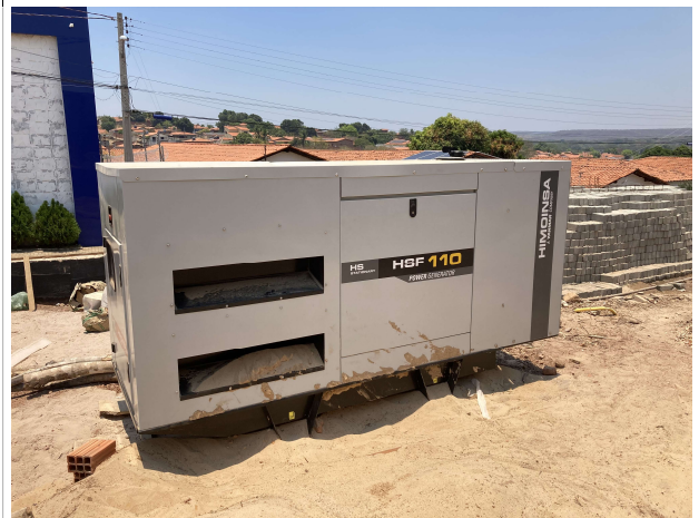
Fig. 4 – grupo gerador cabinado