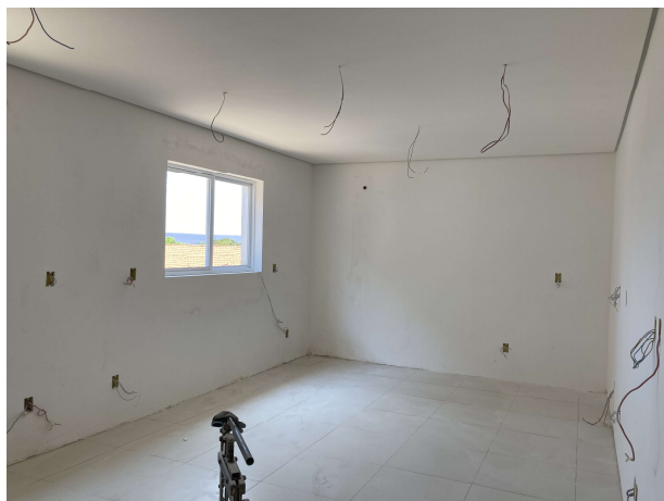
Fig. 5 – execução de instalações elétricas e pintura