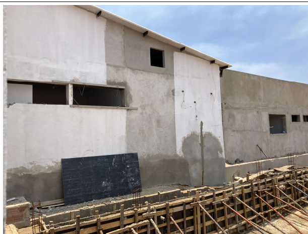
Fig. 7 – execução de emassamento