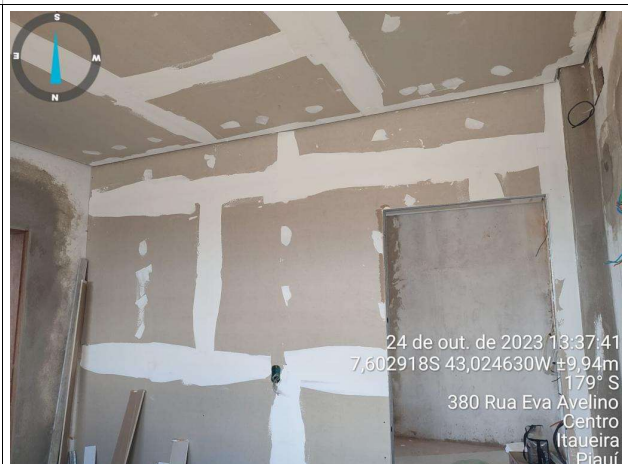
Fig. 14 – execução de parede de gesso acartonado