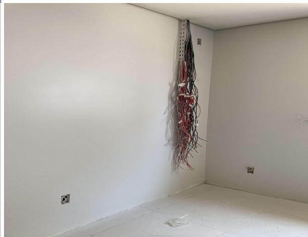
Fig. 9 – execução de instalações lógicas