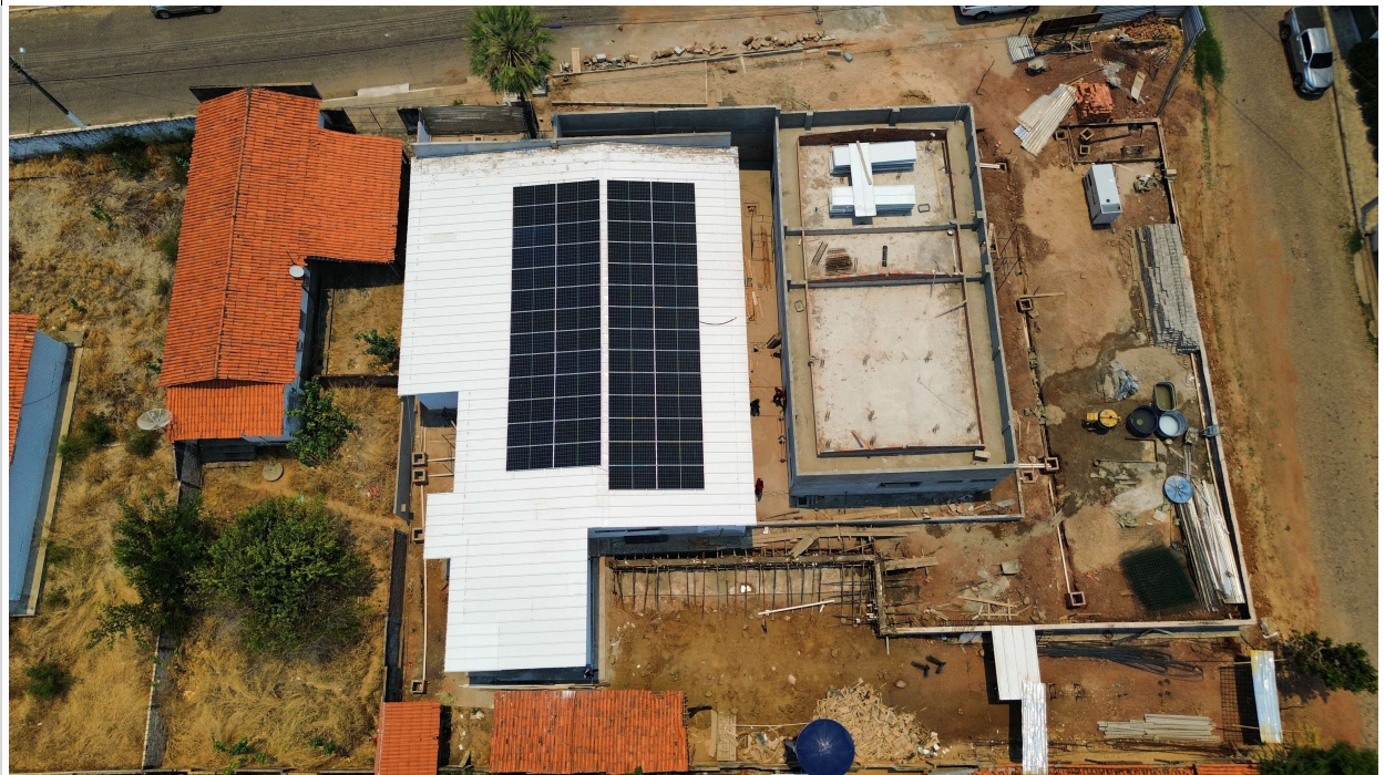
Fig. 1 – Vista aérea da obra