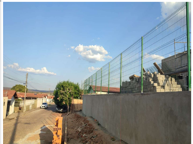
Fig. 10 – execução de gradil