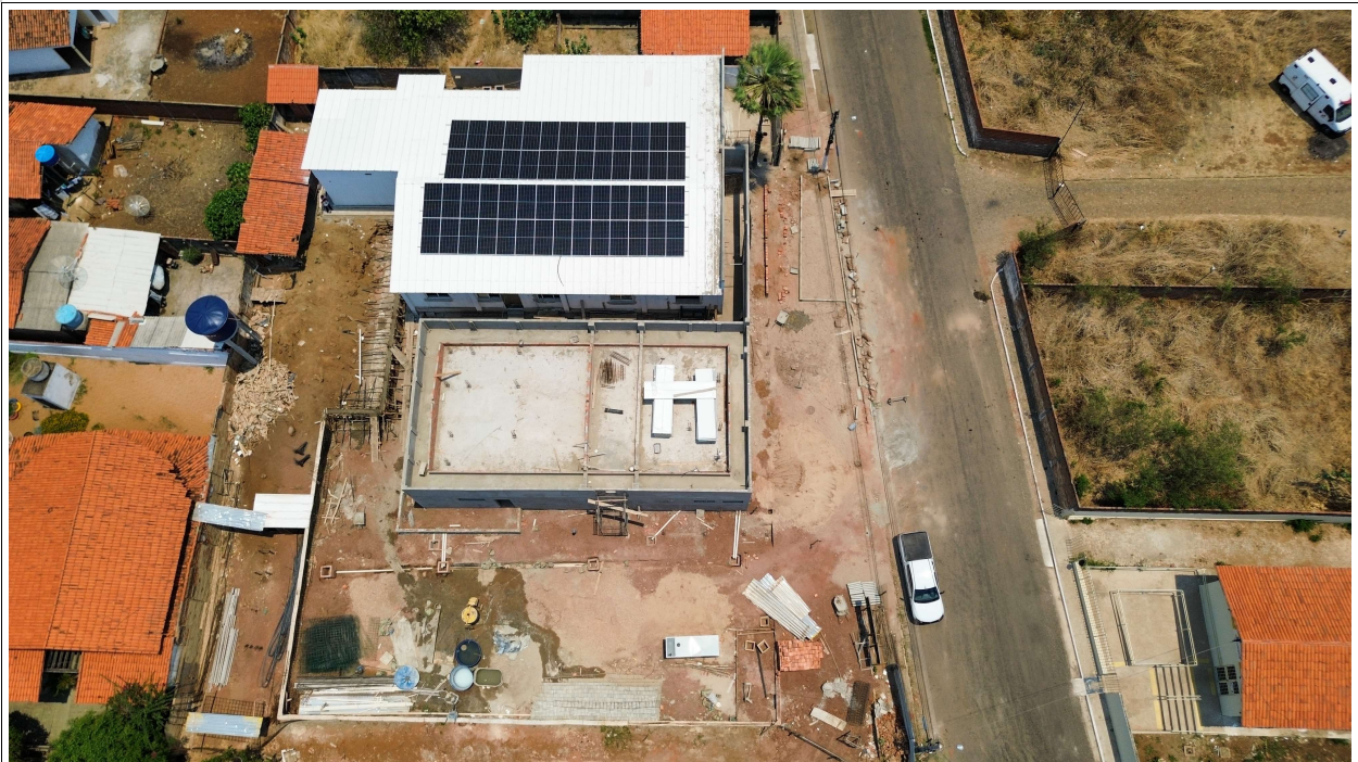
Fig. 2 – Vista aérea da obra