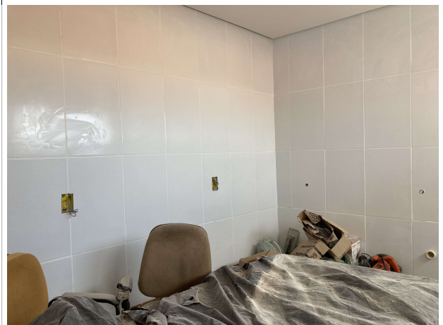
Fig. 6 – execução de revestimentos