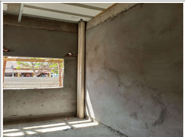
Fig. 9 – execução de instalação pluvial