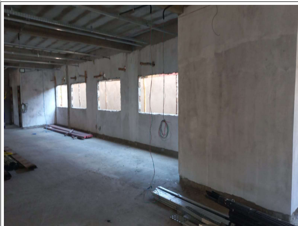
Fig. 8 – execução de emassamento para pintura