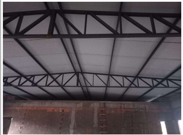
Fig. 11 – execução de alvenaria e estrutura metálica