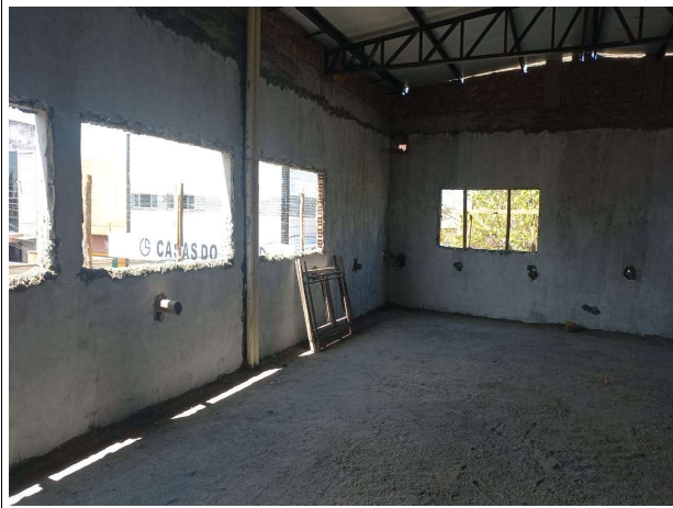
Fig. 10 – execução de emassamento para pintura