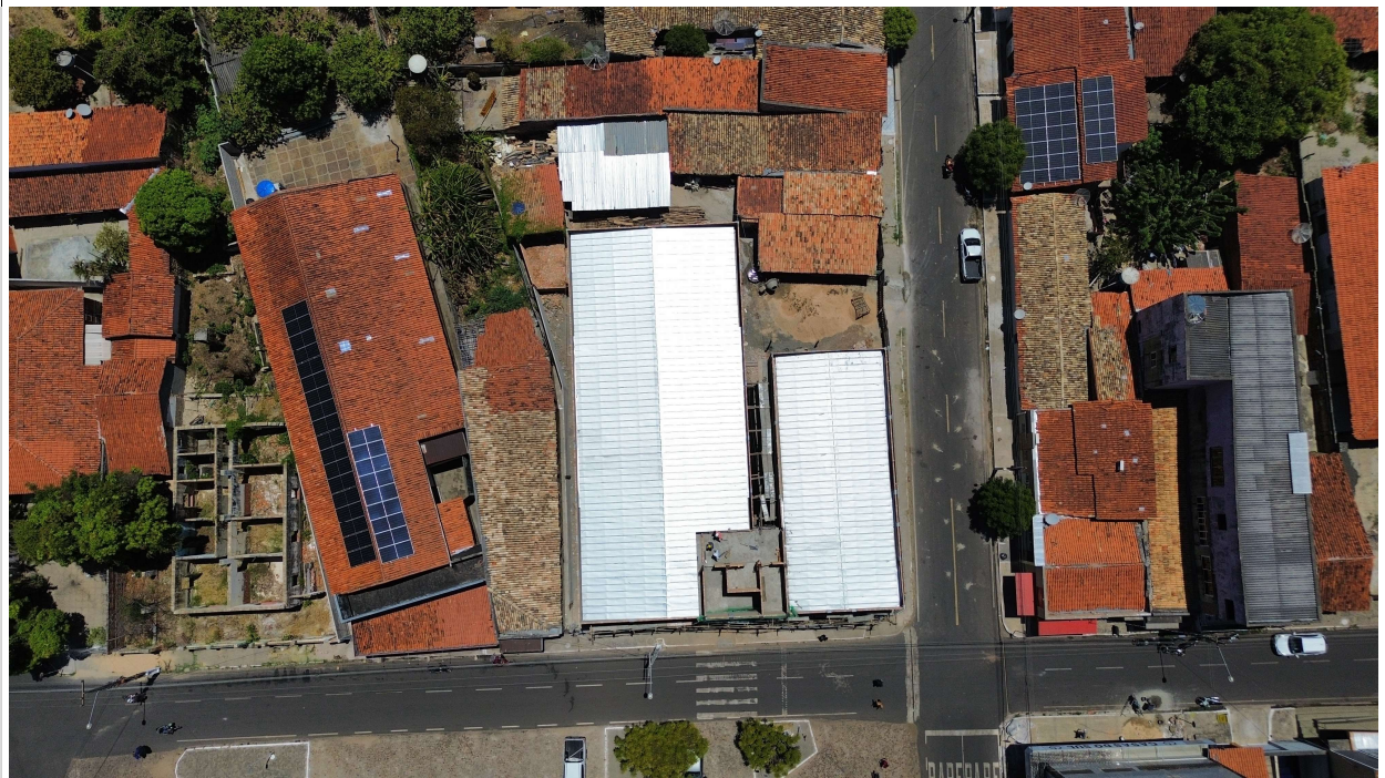
Fig. 1 – Vista aérea da obra