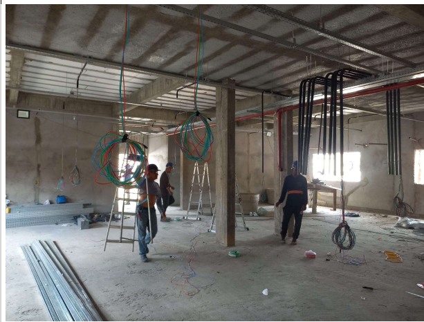
Fig. 4 – execução de instalações elétricas e de som