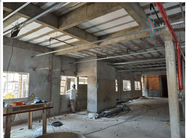
Fig. 7 – execução de contrapiso e instalações de climatização