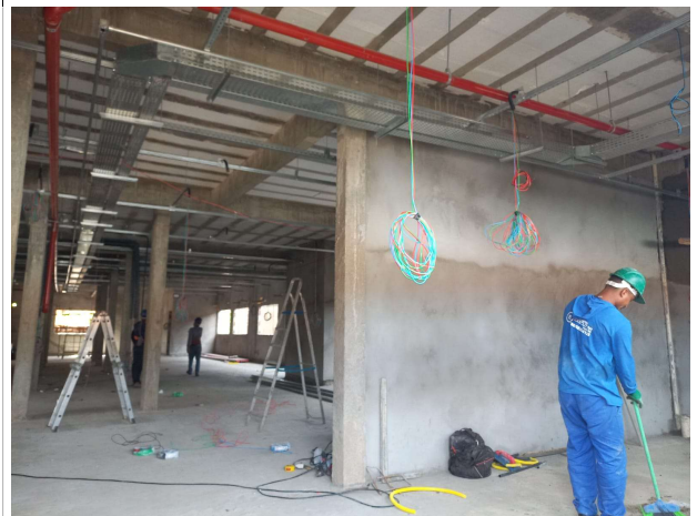
Fig. 5 – execução de instalação de combate a incêndio