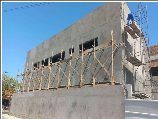
Fig. 2 – execução de muro e revestimentos