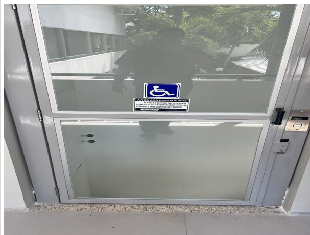
Fig. 11 – Plataforma elevatória