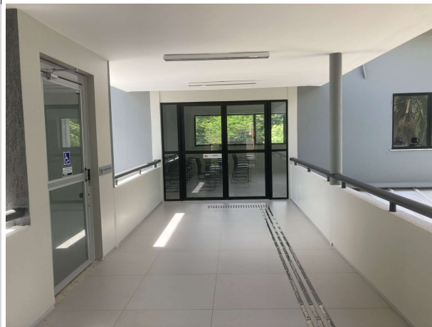
Fig. 9 – Instalações do 1º Pavimento