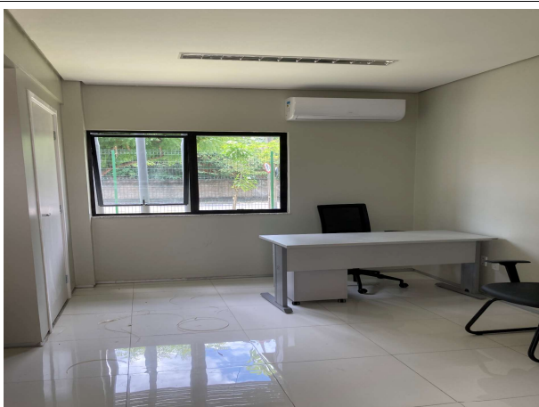
Fig. 7 – Instalações do JECC Horto