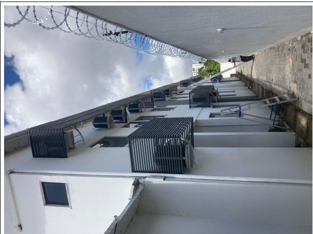
Fig. 20 – Brises metálicos