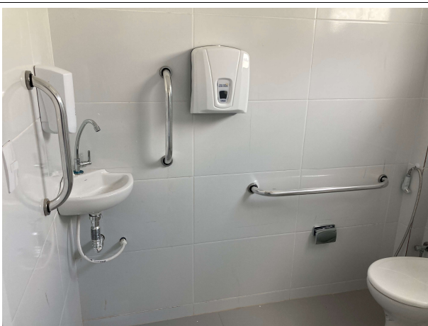
Fig. 19 – Banheiros com acessibilidade