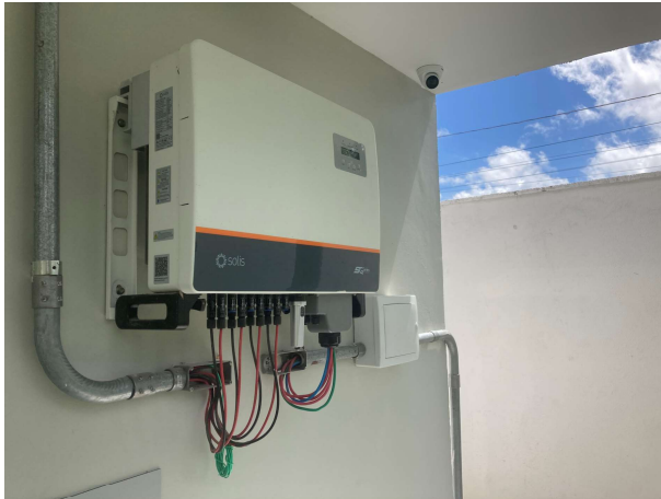
Fig. 15 – Inversor do sistema fotovoltaico