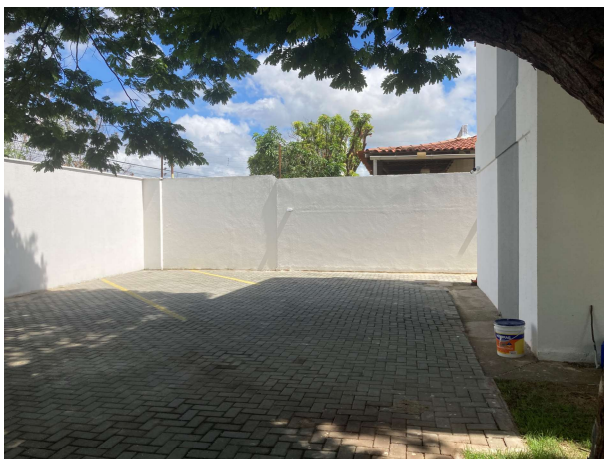
Fig. 17 – Estacionamento interno