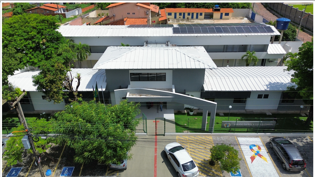
Fig. 1 – Vista aérea da obra