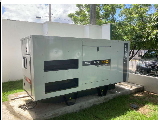
Fig. 13 – Grupo gerador