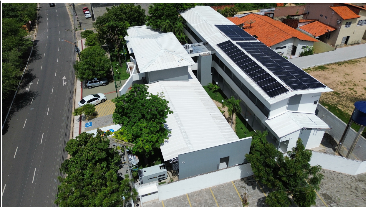
Fig. 2 – Vista aérea da obra