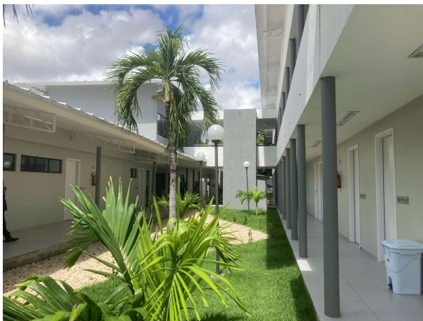
Fig. 5 – Circulação/jardim central