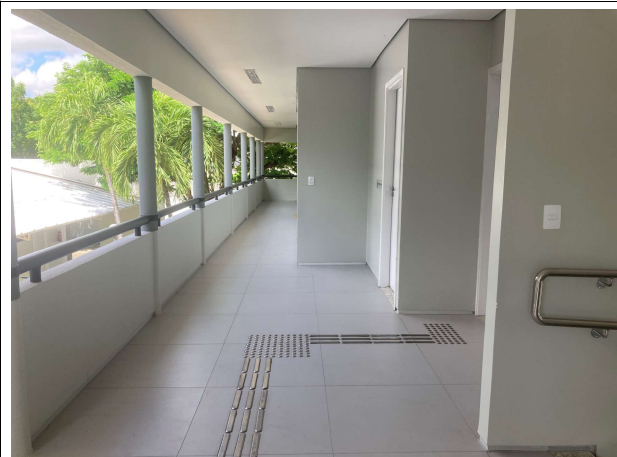
Fig. 8 – Instalações do 1º Pavimento