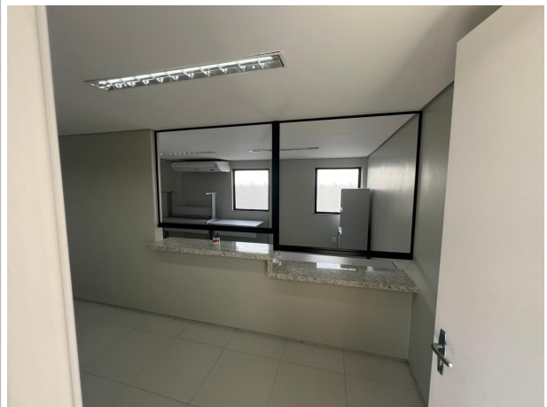
Fig. 6 – Secretaria do JECC