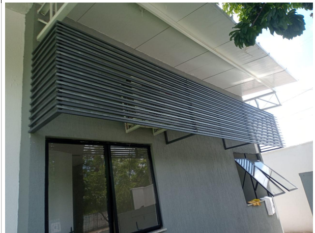
Fig. 10 – Brises metálicos