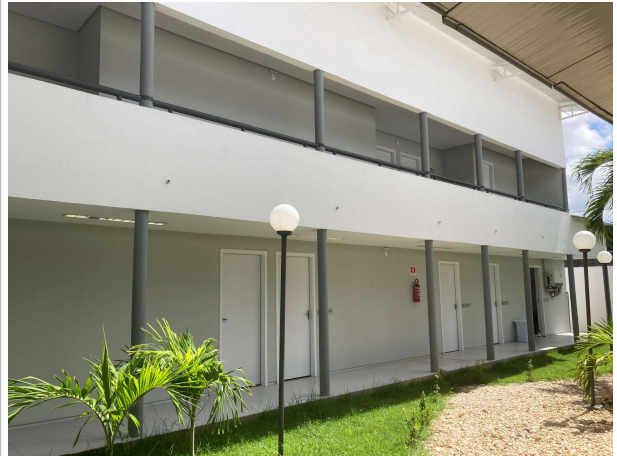
Fig. 4 – Circulação/jardim central