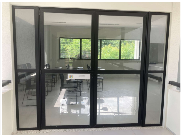
Fig. 18 – Auditório para 34 lugares