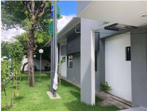
Fig. 3 – Fachada frontal