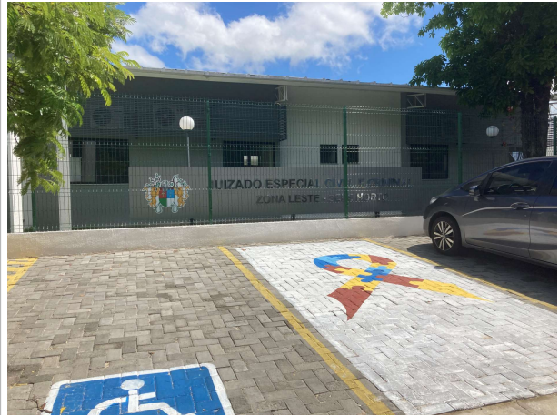
Fig. 16 – Estacionamento com acessibilidade