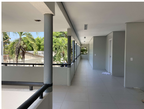
Fig. 11 – Execução de pintura