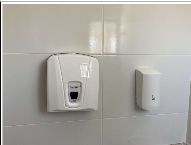
Fig. 7 – Acessórios de instalações hidrossanitárias