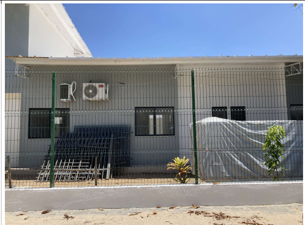
Fig. 4 – Execução de gradil metálico