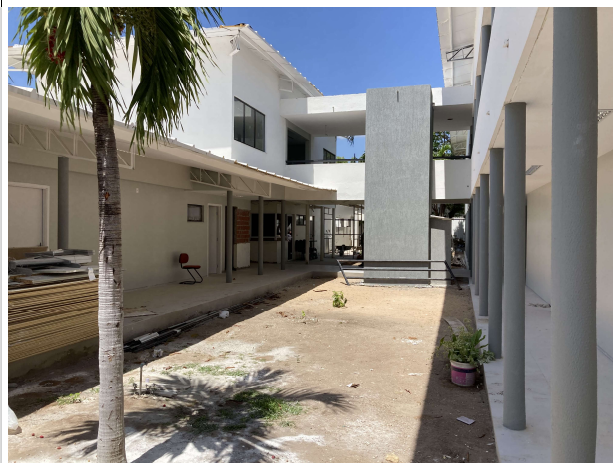
Fig. 5 – Jardim central