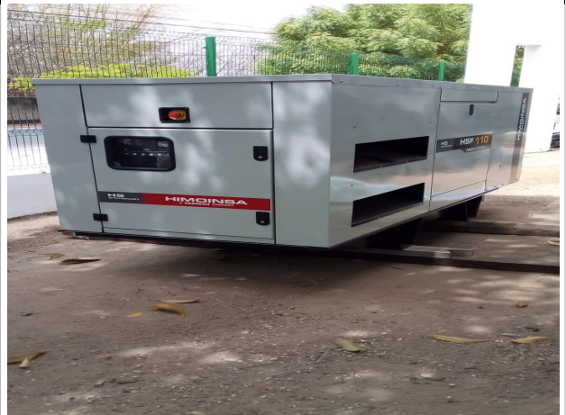
Fig. 10 – Grupo gerador