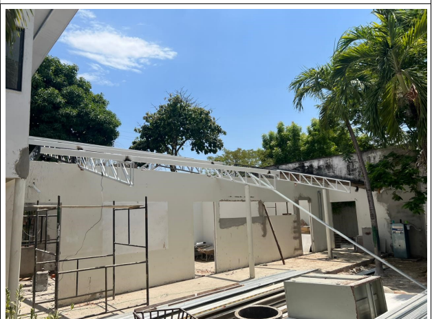
Fig. 14 – Estrutura metálica da cobertura