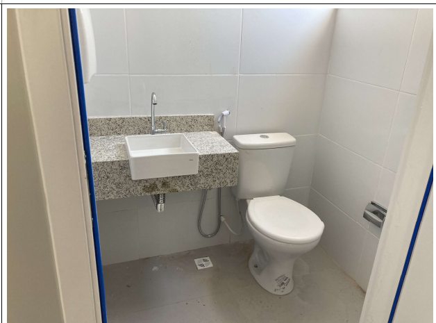
Fig. 8 – Instalações hidrossanitárias