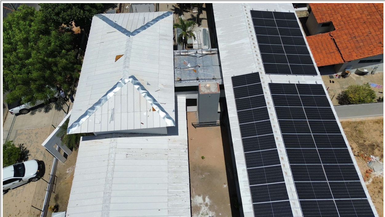
Fig. 2 – Execução de impermeabilização, cobertura e sistema fotovoltaico