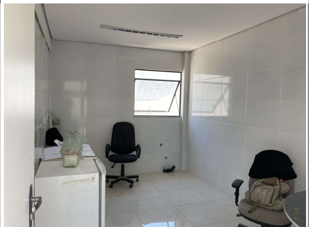
Fig. 12 – Execução de forro e revestimentos