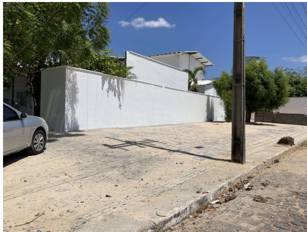
Fig. 9 – Execução de pavimento intertravado