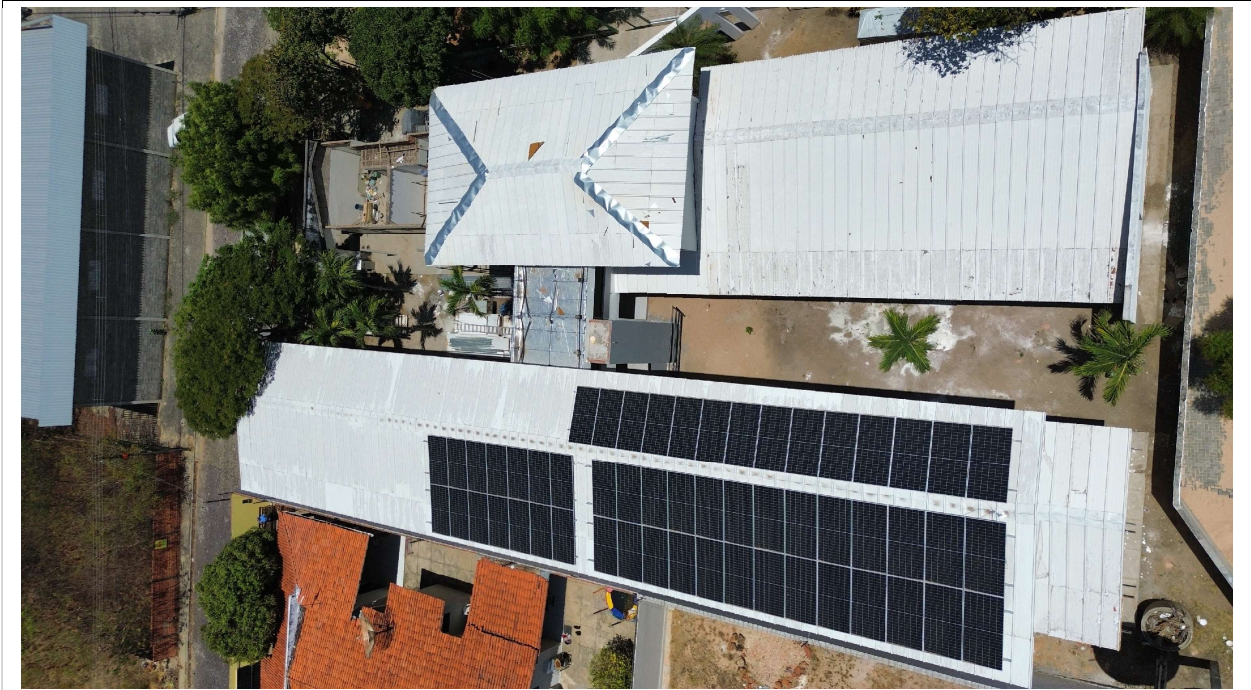
Fig. 1 – Vista aérea da obra