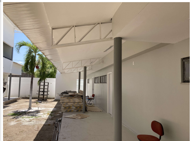
Fig. 6 – Execução de pintura e forro