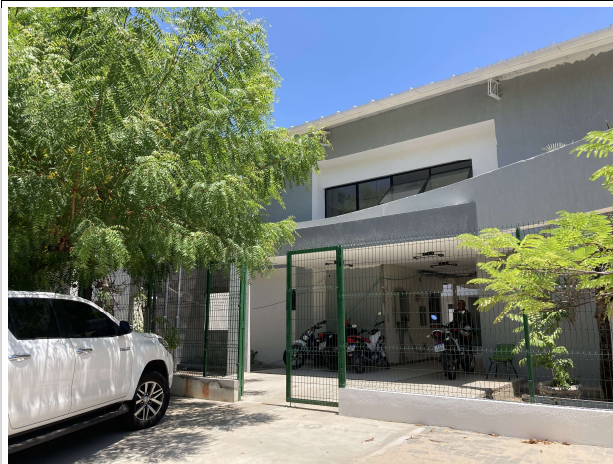
Fig. 3 – Fachada frontal