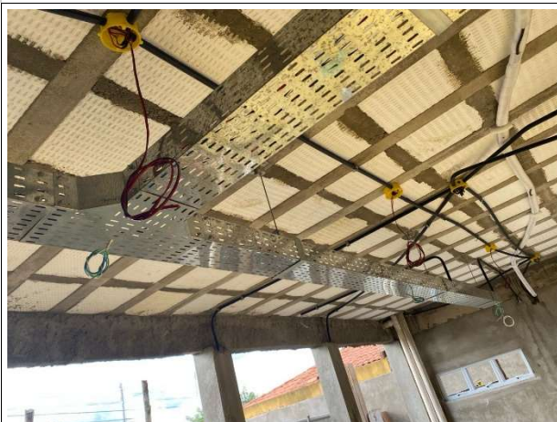
Fig. 13 – execução de instalações elétricas e lógicas