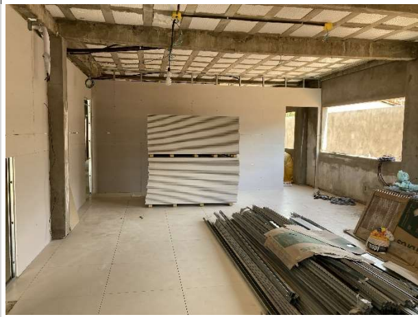
Fig. 9 – instalação de paredes de drywall