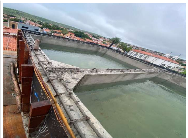
Fig. 14 – estrutura da caixa d'água