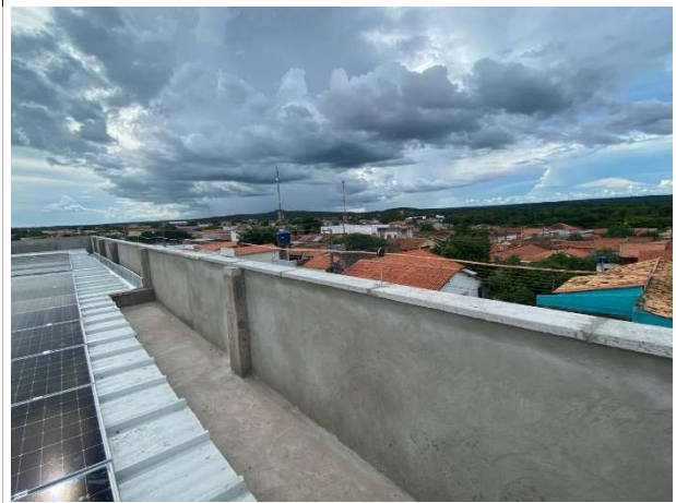
Fig. 4 – execução de SPDA