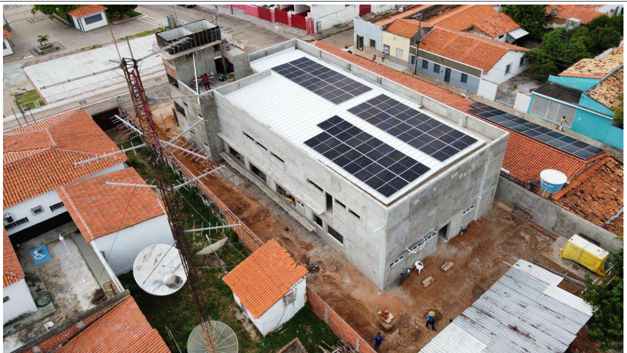
Fig. 2 – Vista aérea da obra