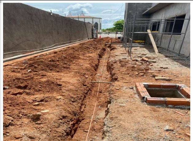
Fig. 12 – malha de aterramento