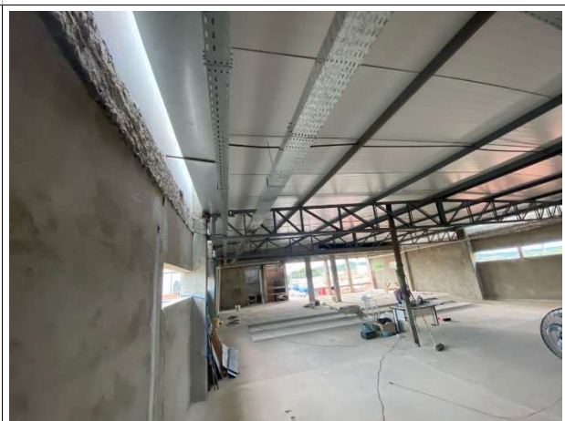
Fig. 8 – execução de instalações elétricas e lógicas