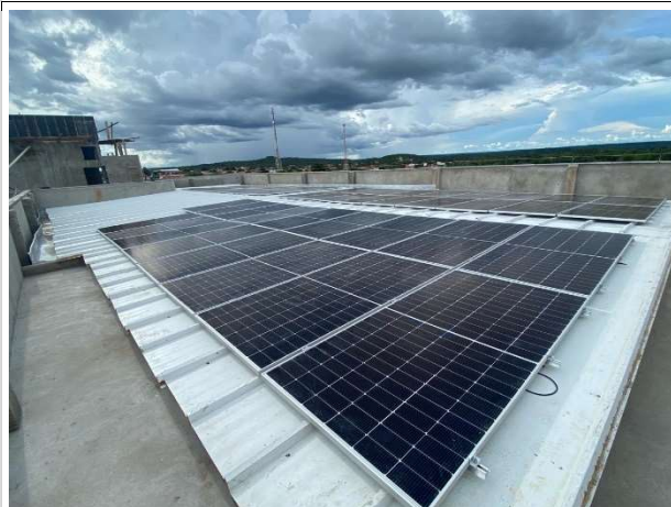
Fig. 11 – placas fotovoltaicas e estrutura da caixa d'água