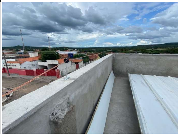
Fig. 3 – execução de SPDA