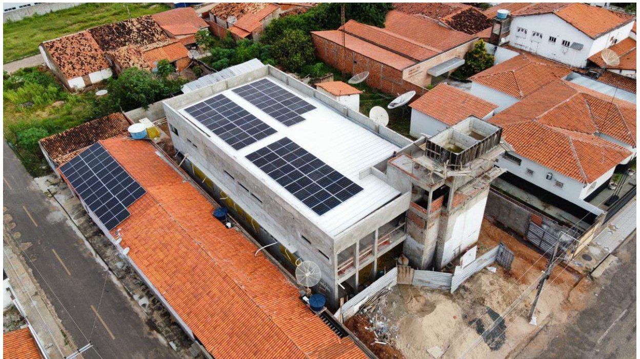
Fig. 1 – Vista aérea da obra