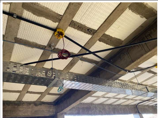
Fig. 6 – execução de instalações elétricas