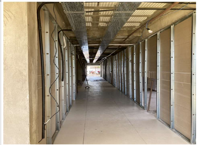
Fig. 10 – circulação do térreo