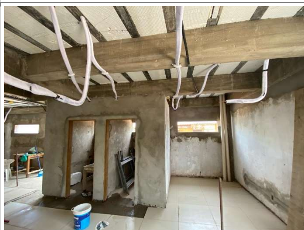
Fig. 5 – tubulação de cobre dos splits