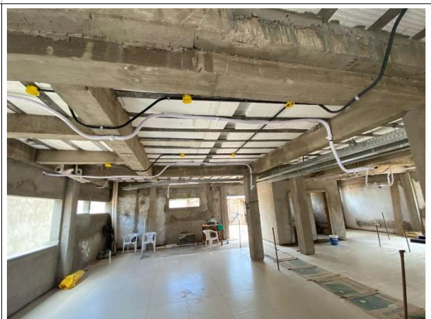
Fig. 8 – execução de piso, instalações elétricas e frigorígenas