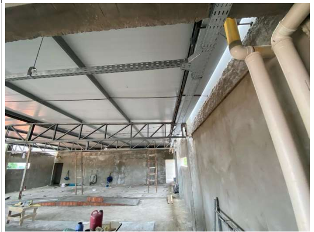
Fig. 4 – revestimentos, calha e instalações pluviais