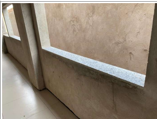
Fig. 7 – execução de peitoril de granito