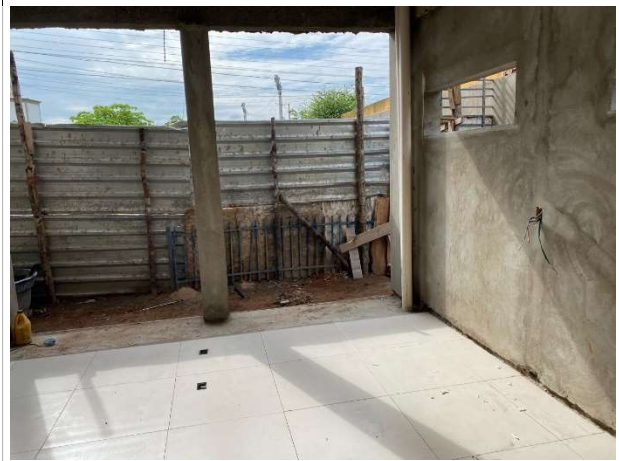
Fig. 10 – execução de piso e instalações pluviais