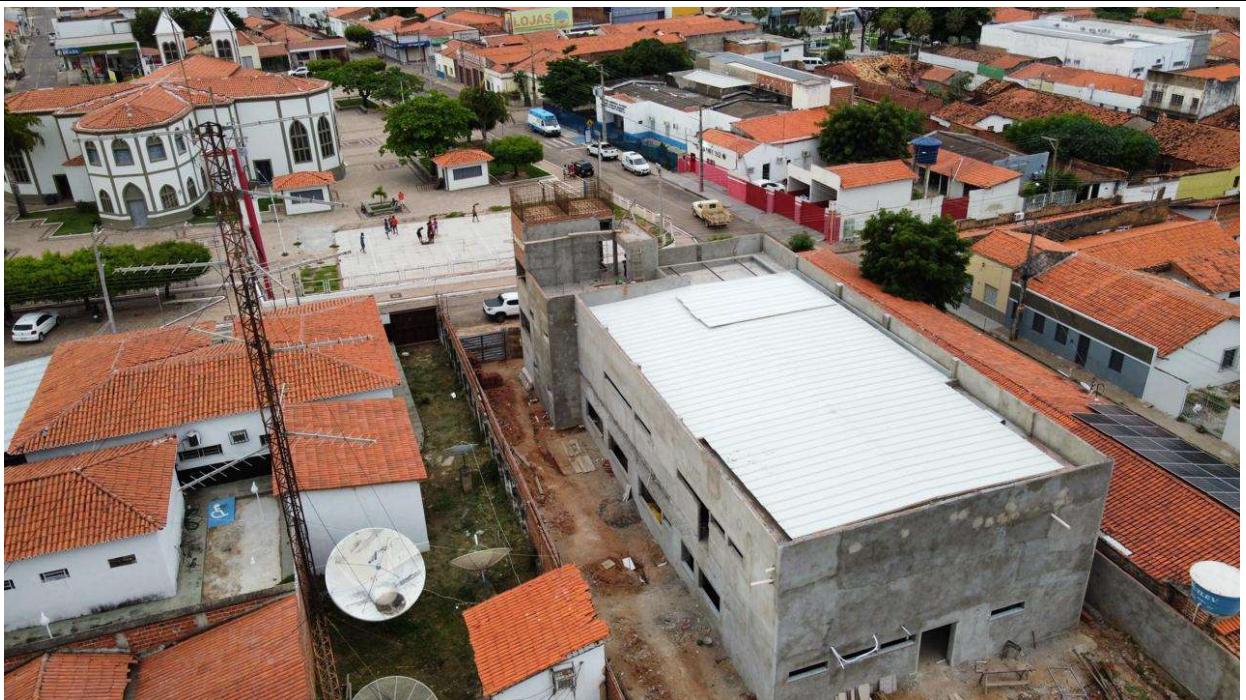
Fig. 2 – Vista aérea da obra em 03/02/2024