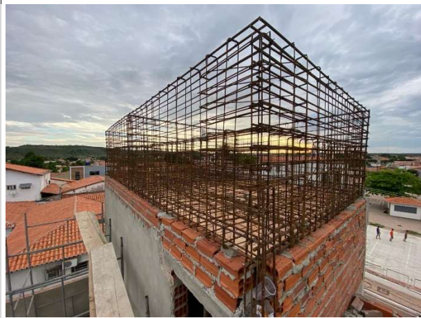
Fig. 3 – armação da caixa d'água