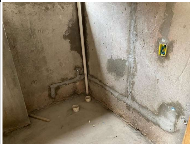
Fig. 9 – execução de instalações sanitárias