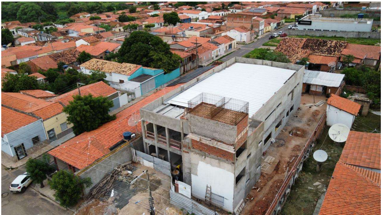
Fig. 1 – Vista aérea da obra em 03/02/2024