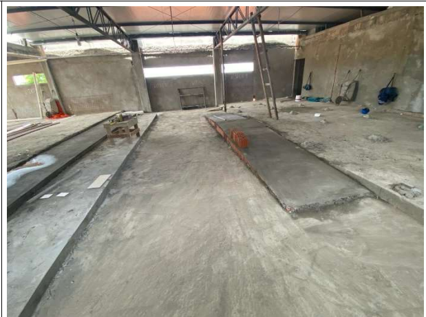
Fig. 12 – tribunal do júri