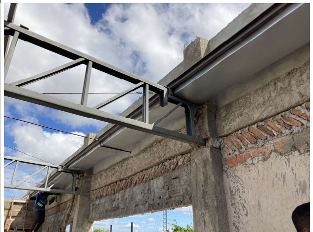
Fig. 4 – execução de calha pluvial e estrutura metálica