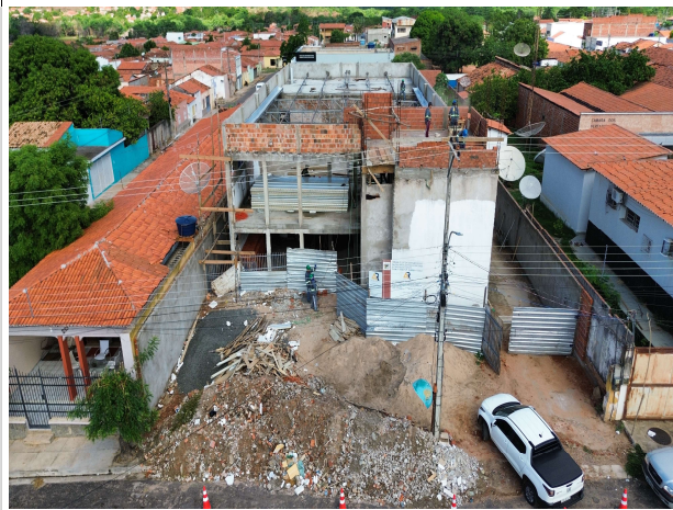
Fig. 3 – fachada frontal (21/11/2023)