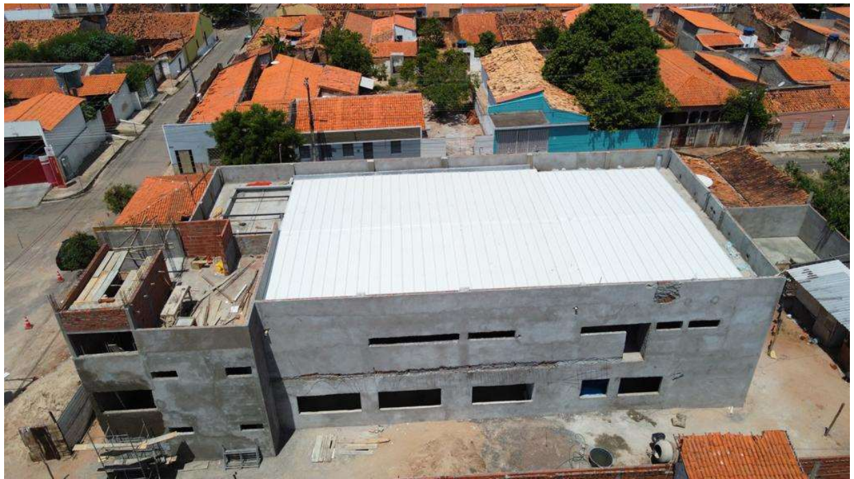
Fig. 1 – Vista aérea da obra