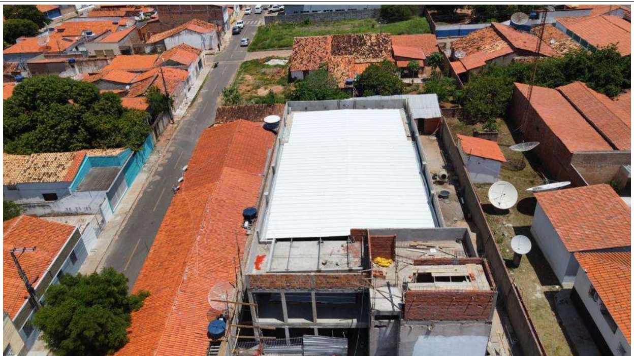
Fig. 2 – Vista aérea da obra