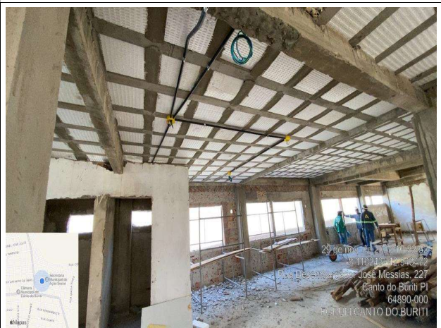
Fig. 8 – execução de instalações elétricas