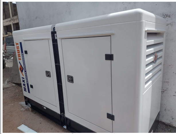
Fig. 9 – grupo gerador