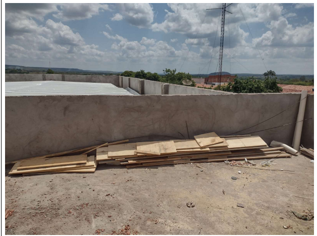
Fig. 10 – execução de laje de cobertura