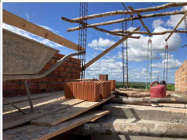
Fig. 5 – execução de alvenaria e estrutura