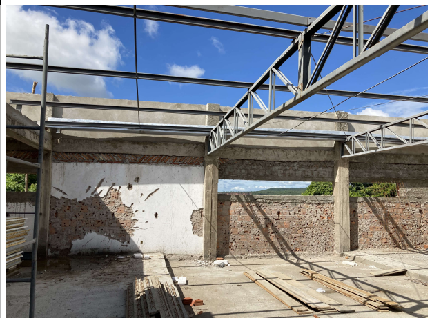
Fig. 6 – execução de estrutura metálica