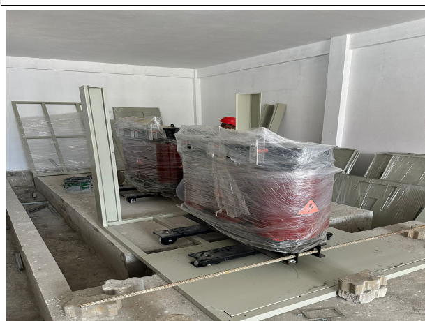
Fig. 17 – montagem do invólucro dos trafos