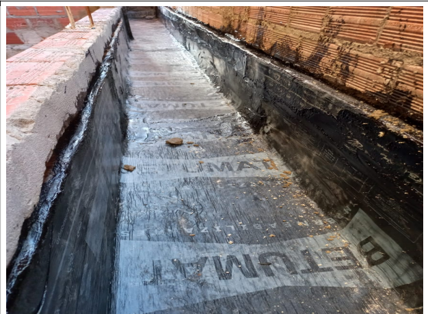
Fig. 10 – impermeabilização das calhas