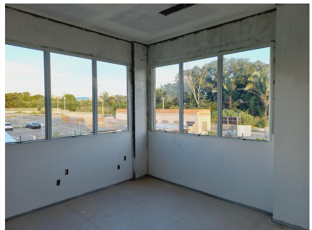
Fig. 14 – execução de piso e esquadrias