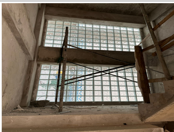
Fig. 11 – revestimento em tijolo de vidro