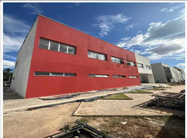
Fig. 2 – fachada da Ejud