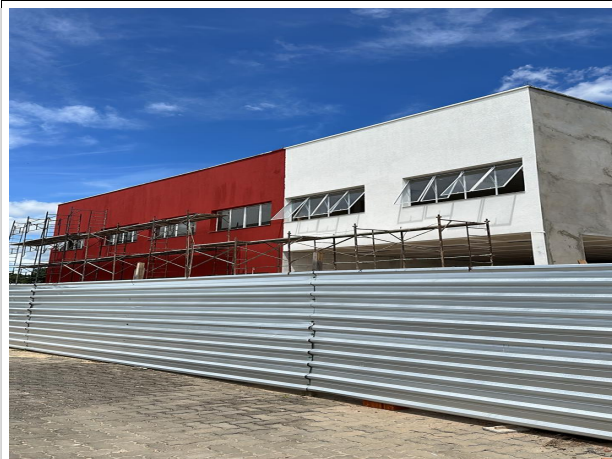
Fig. 1 – fachada da Ejud