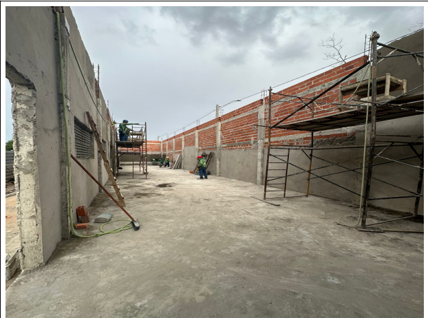
Fig. 22 – estrutura da cisterna