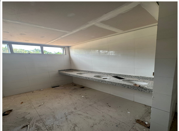
Fig. 8 – execução de bancada de granito