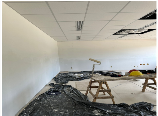
Fig. 20 – execução de pintura interna