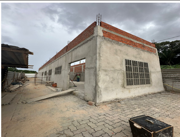
Fig. 21 – estrutura da cisterna