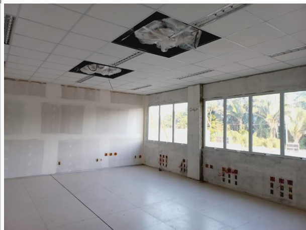
Fig. 13 – execução de piso e instalações