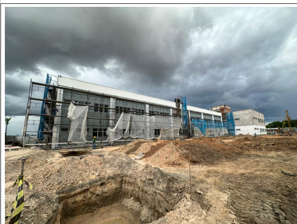
Fig. 5 – fachada da Corregedoria