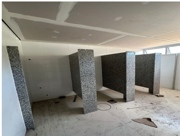
Fig. 7 – execução de divisórias e revestimentos