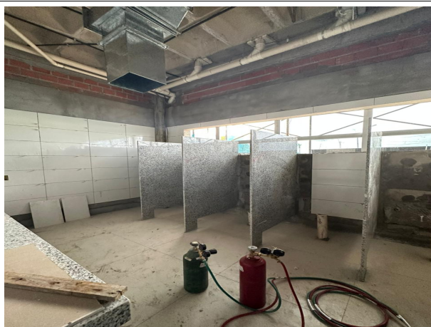
Fig. 9 – execução de divisórias e revestimentos