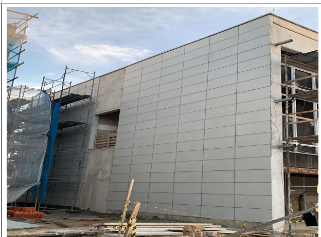
Fig. 6 – execução de revestimento da fachada