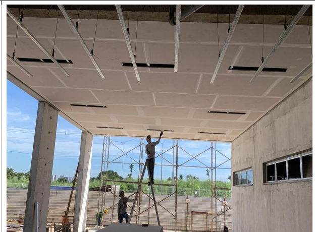
Fig. 4 – execução de forro e luminárias na Ejud