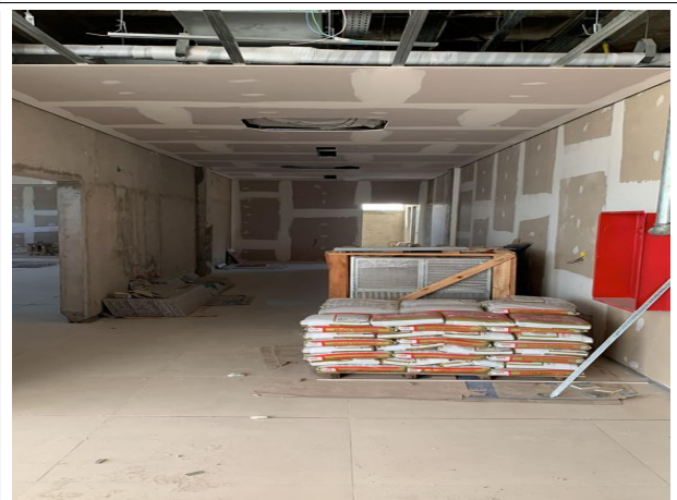
Fig. 16 – execução de forro e instalações