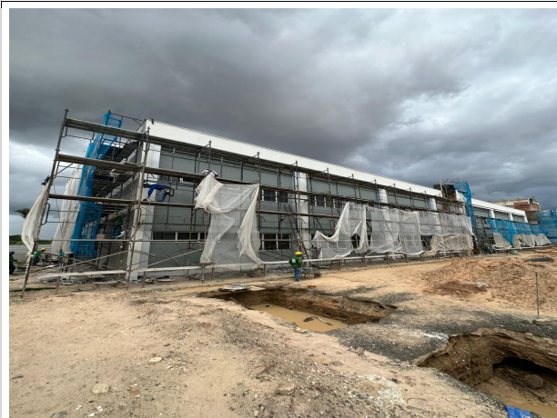
Fig. 3 – fachada da Corregedoria