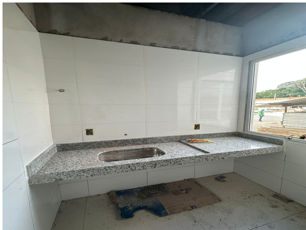
Fig. 19 – execução de louças e bancadas