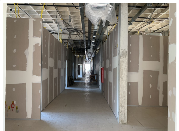
Fig. 12 – paredes em drywall e instalações