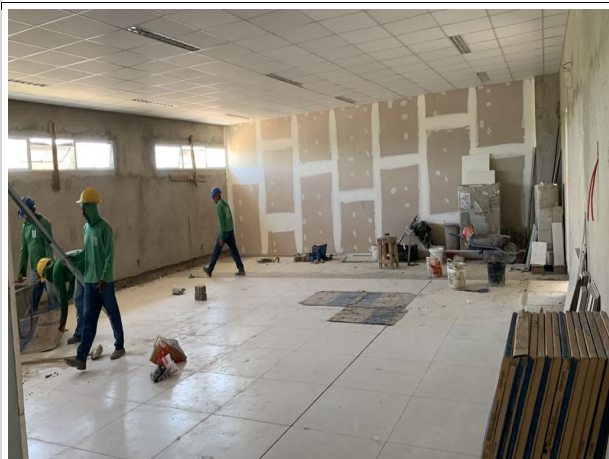
Fig. 15 – execução de piso, forro e luminárias