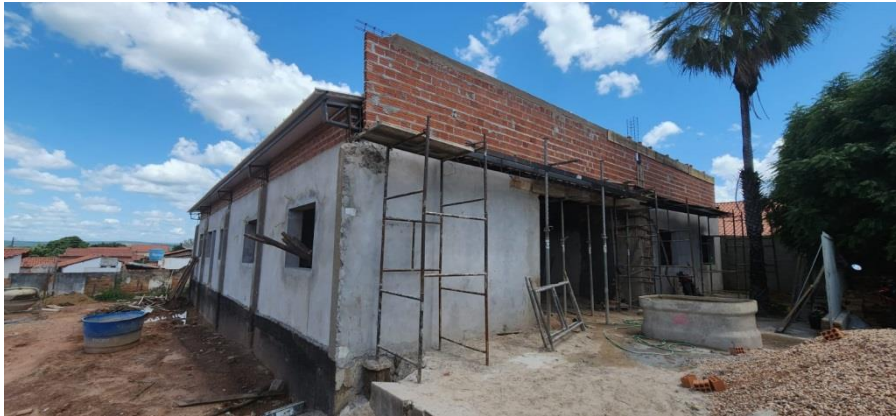
FOTO 12 – REBOCO, BALDRAME, PILARES, ALVENARIA E IMPERMEABILIZAÇÕES