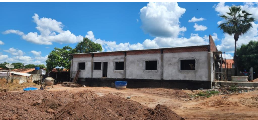
FOTO 14 – REBOCO, BALDRAME, ALVENARIA, PILARESE, IMPERMEABILIZAÇÕES, COBERTURA E ATERRO