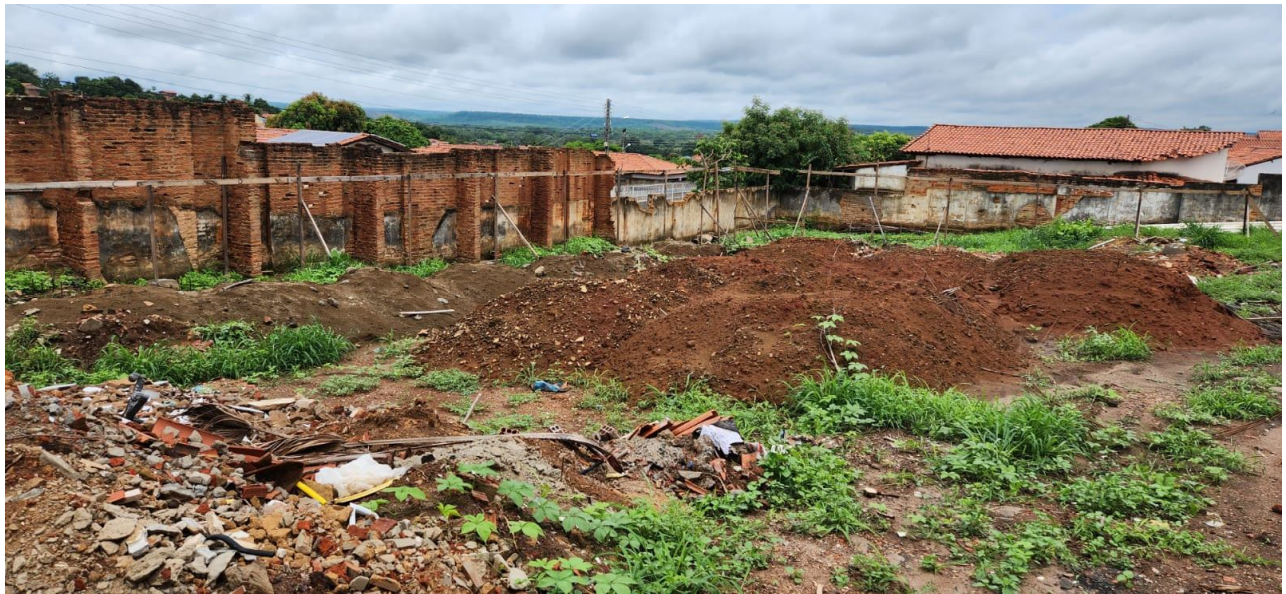
ESCAVAÇÃO DAS FUNDAÇÕES DA ÁREA DE AMPLIAÇÃO/ARIIMO