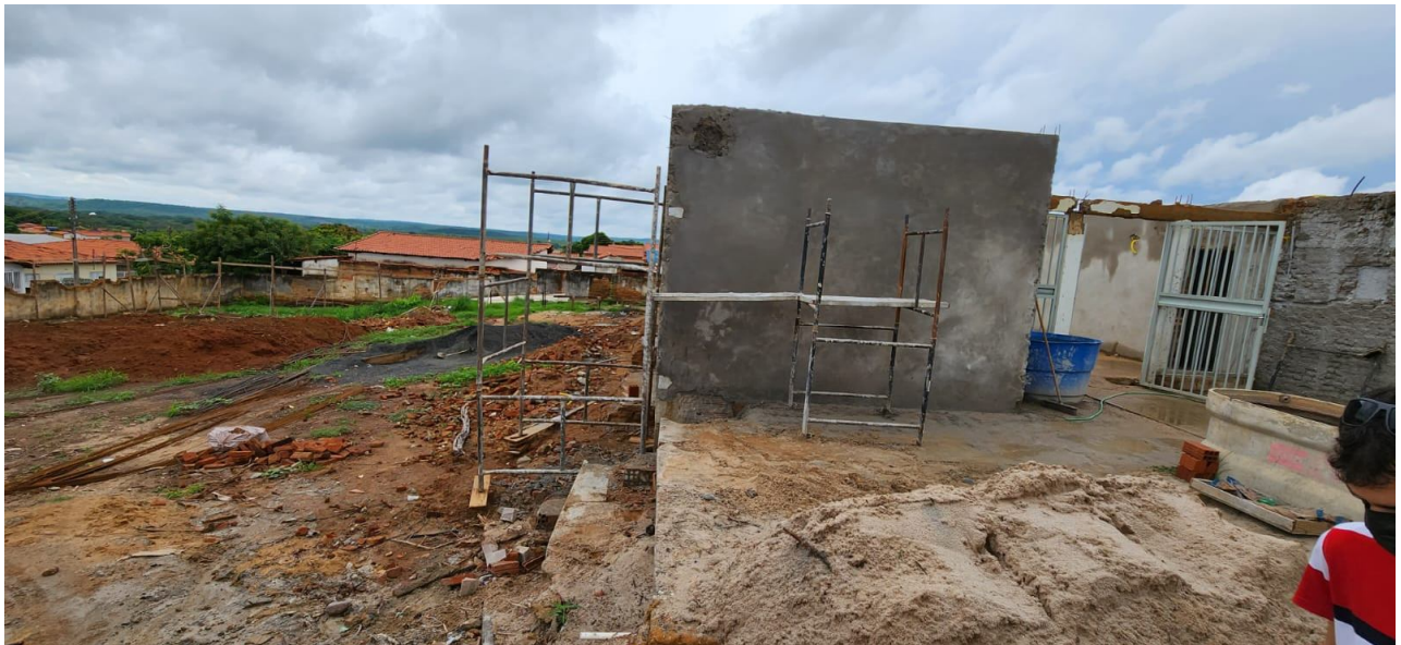
VISTA DA REFORMA DO PRÉDIO ANTIGO E DA ÁREA DE AMPLIAÇÃO