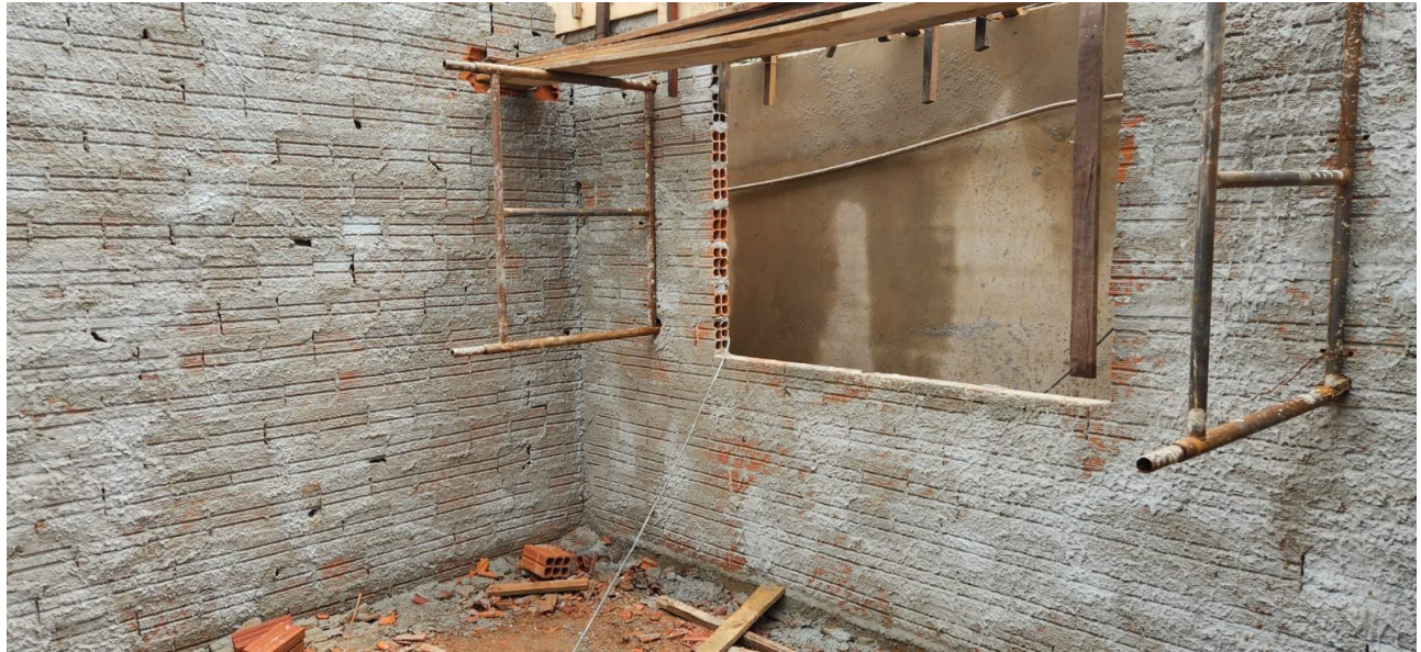
APLICAÇÃO DE CHAPISCO