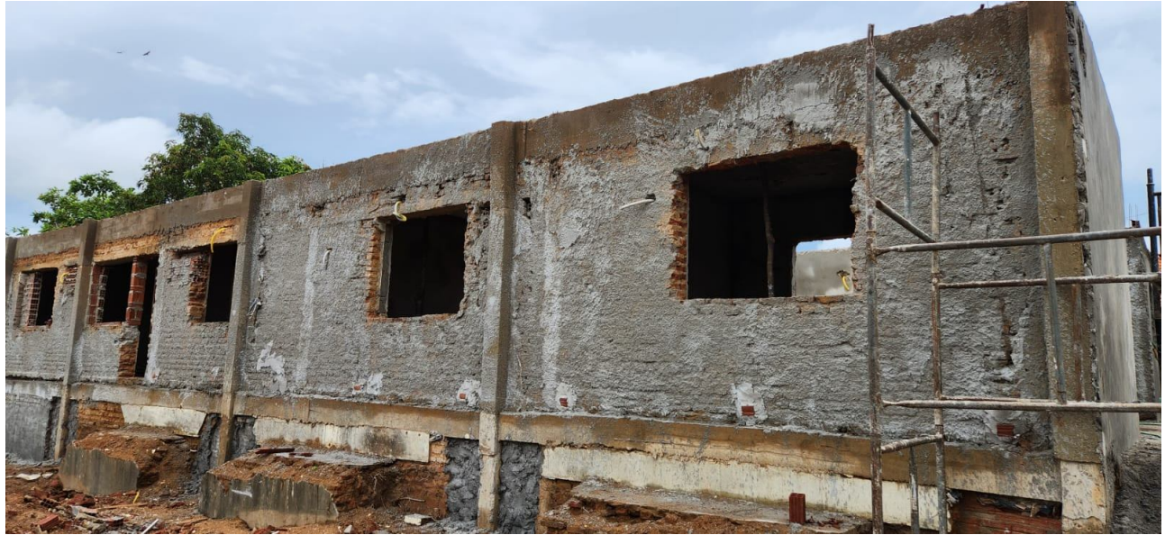
LATERAL DO PRÉDIO ANTIGO – EXECUÇÃO DE PILARES / APLICAÇÃO DE CHAPISCO