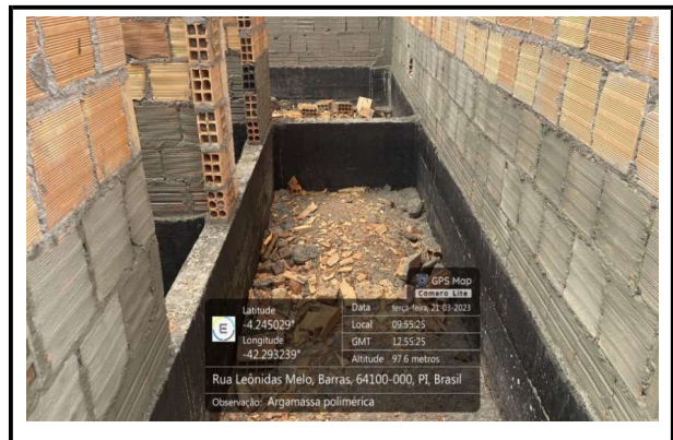
ALVENARIA E APLICAÇÃO DA ARGAMASSA POLIMÉRICA