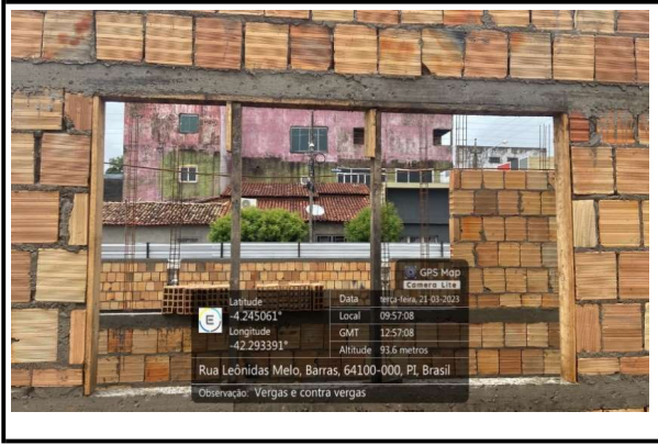
VERGAS E CONTRAVERGAS