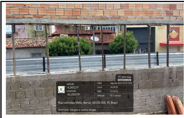
VERGAS E CONTRAVERGAS