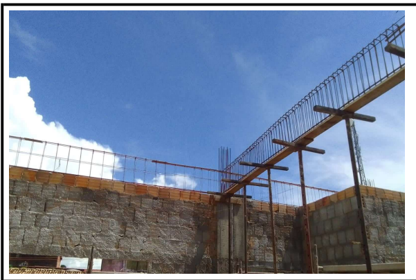
VIGAS 1º PAVIMENTO