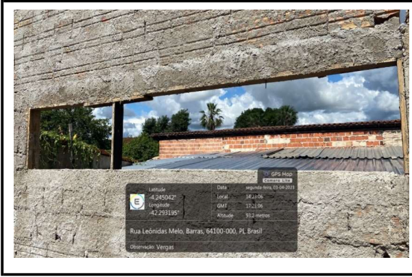
VERGAS E CONTRA VERGAS