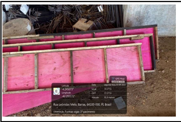
FORMA VIGAS 1º PAVIMENTO