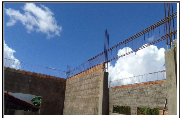
VIGAS 1º PAVIMENTO