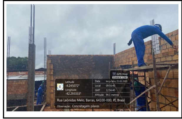
ALVENARIA E CONCRETAGEM DOS PILARES