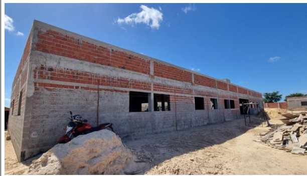
8-PAREDES E VEDAÇÃO/ 12-REVESTIMENTO