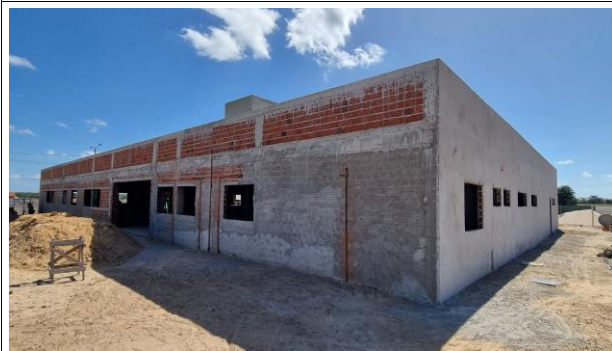
8-PAREDES E VEDAÇÃO/ 12-REVESTIMENTO