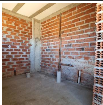
9-INST. HIDRÁULICAS/ 10-INST. SANITÁRIAS