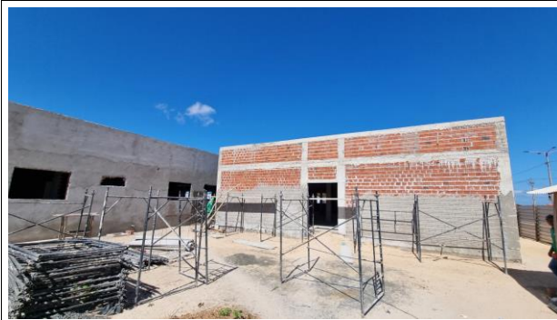
8-PAREDES E VEDAÇÃO/ 12-REVESTIMENTO