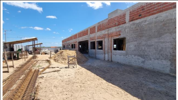
8-PAREDES E VEDAÇÃO/ 12-REVESTIMENTO