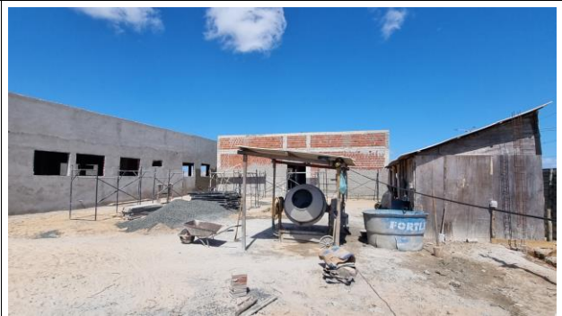
2-ADMINISTRAÇÃO LOCAL/CANTEIRO DE OBRAS