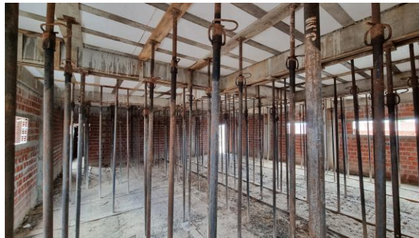
6-SUPERESTRUTURA/ 8-PAREDES E VEDAÇÃO