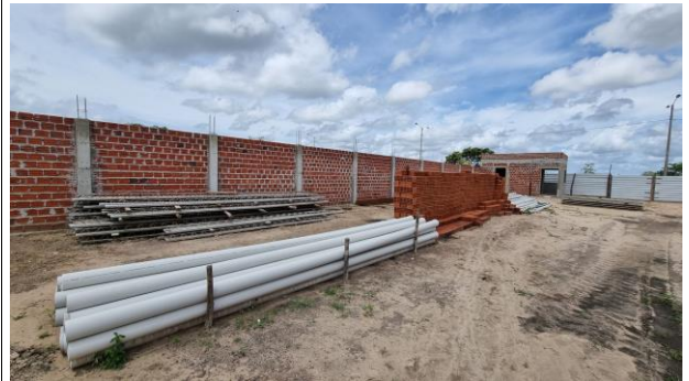
9-INSTALAÇÕES HIDRÁULICAS/ 10-INSTALAÇÕES SANITÁRIAS