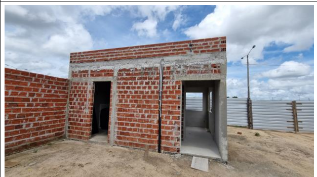
6-SUPERESTRUTURA/ 8-PAREDES E VEDAÇÃO