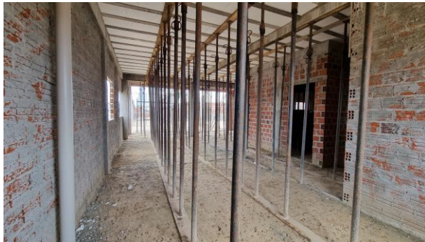
9-INSTALAÇÕES HIDRÁULICAS/ 10-INSTALAÇÕES SANITÁRIAS