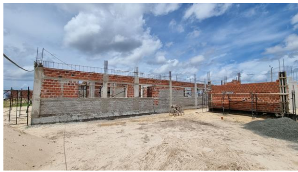
6-SUPERESTRUTURA/ 8-PAREDES DE VEDAÇÃO