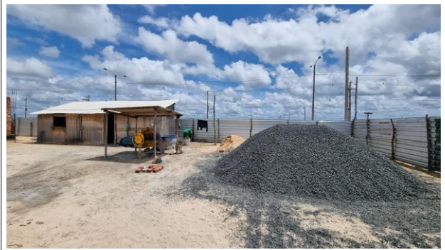
2-ADMINISTRAÇÃO LOCAL/CANTEIRO DE OBRAS