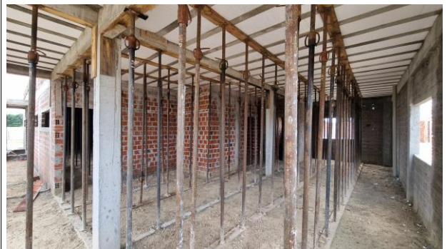
6-SUPERESTRUTURA/ 8-PAREDES E VEDAÇÃO