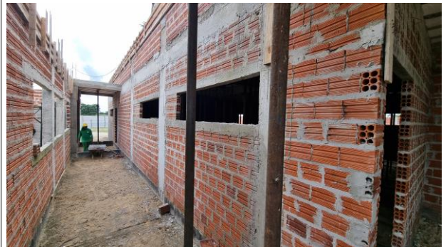
6-SUPERESTRUTURA/ 8-PAREDES E VEDAÇÃO