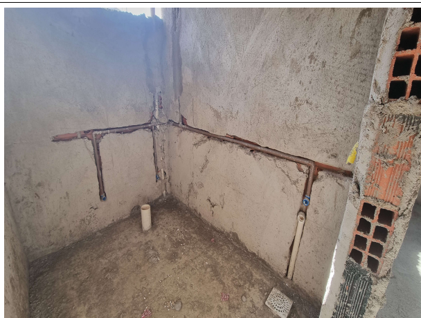
Fig. 5 - Instalações hidráulicas e sanitárias