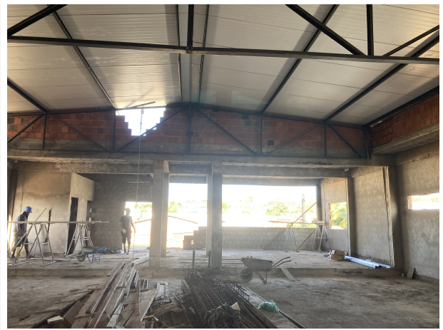
Fig. 8 – Auditório/Tribunal do Júri (1º Pavimento)