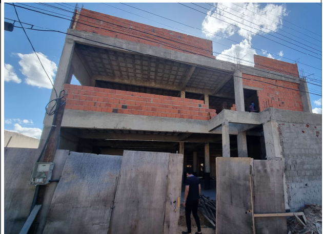
Fig. 2 – Fachada frontal do Novo Fórum de Simões