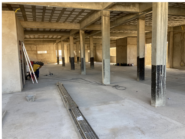
Fig. 3 - Vista interna do térreo da edificação