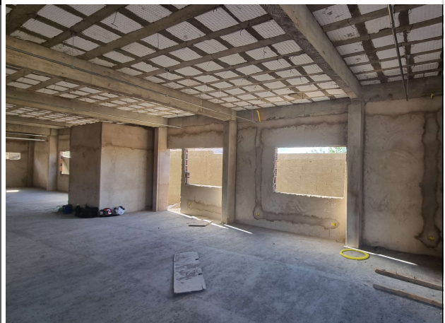
Fig. 4 – Vista interna do térreo da edificação