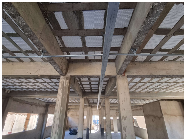
Fig. 9 – Execução de instalações no térreo