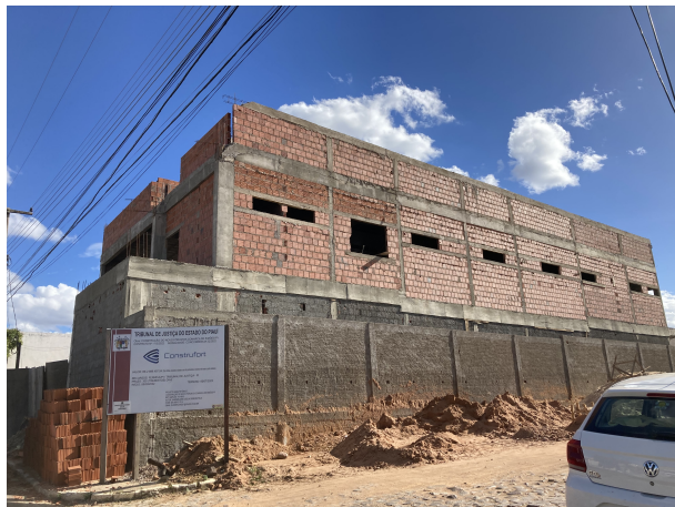
Fig. 1 – Fachada lateral do Novo Fórum de Simões