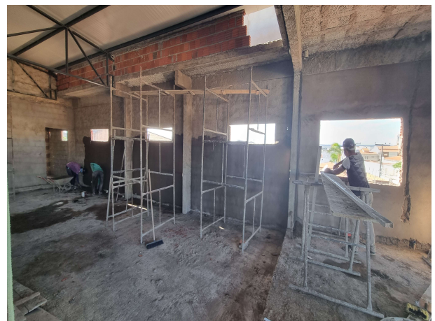
Fig. 10 – Execução de reboco no 1º Pavimento