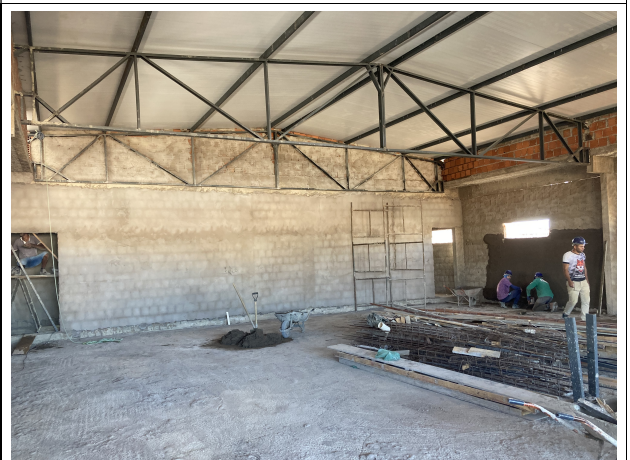
Fig. 6 - Estrutura metálica da cobertura (1º Pavimento)