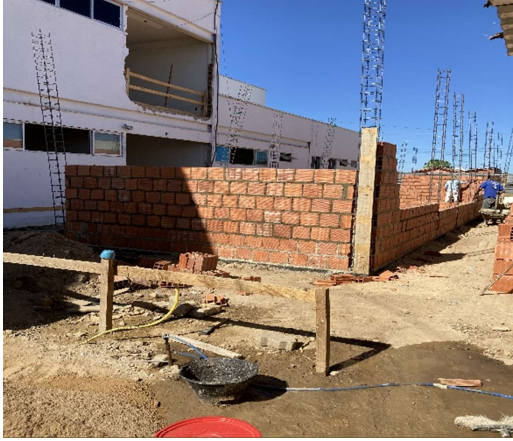
ARMAÇÃO DE PILARES/PAREDES