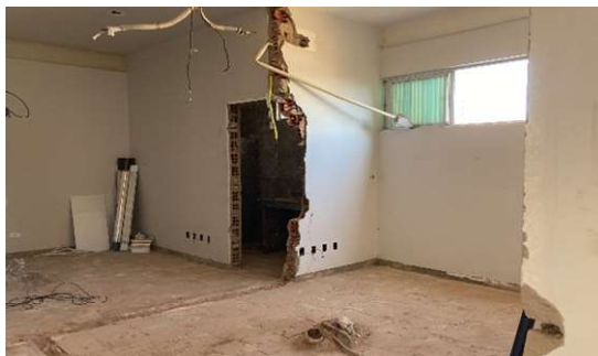
DEMOLIÇÕES DE PAREDES