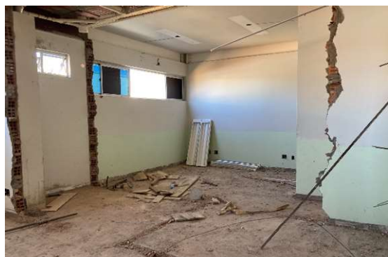
DEMOLIÇÕES DE PAREDE