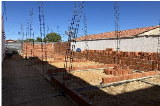
ARMAÇÃO DE PILARES/PAREDES