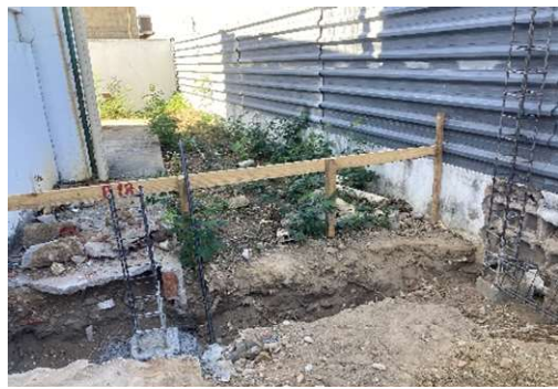
FUNDAÇÕES/MOVIMENTAÇÃO DE TERRA