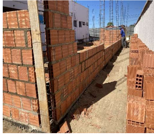
ARMAÇÃO DE PILARES/PAREDES